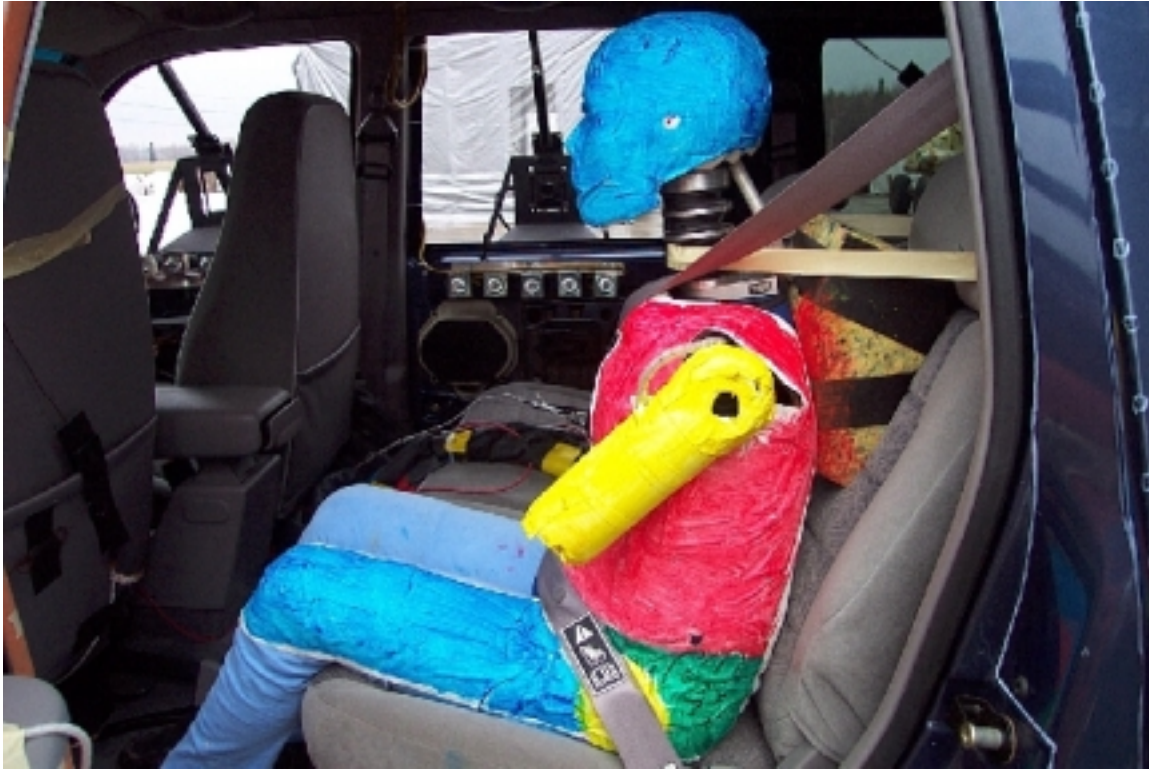
46. Côté gauche du passager arrière gauche, véhicule cible, avant essai. Left side of left rear passenger, target vehicle, pre-test.