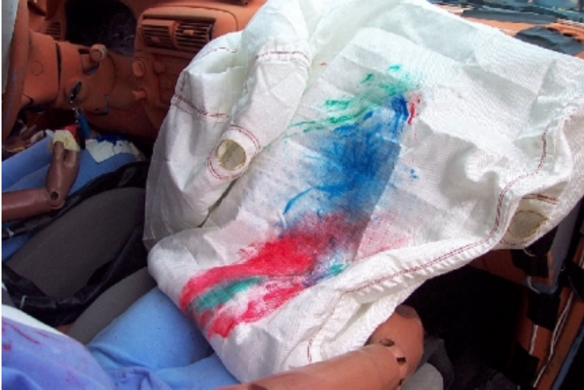
61. Point de contact de tête du passager, véhicule bélière, après essai. Passenger's head contact point, bullet vehicle, post-test.