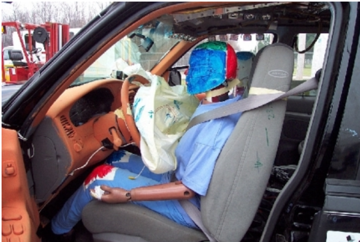
55. Position du conducteur, véhicule bélière, après essai. Driver's position, bullet vehicle, post-test.