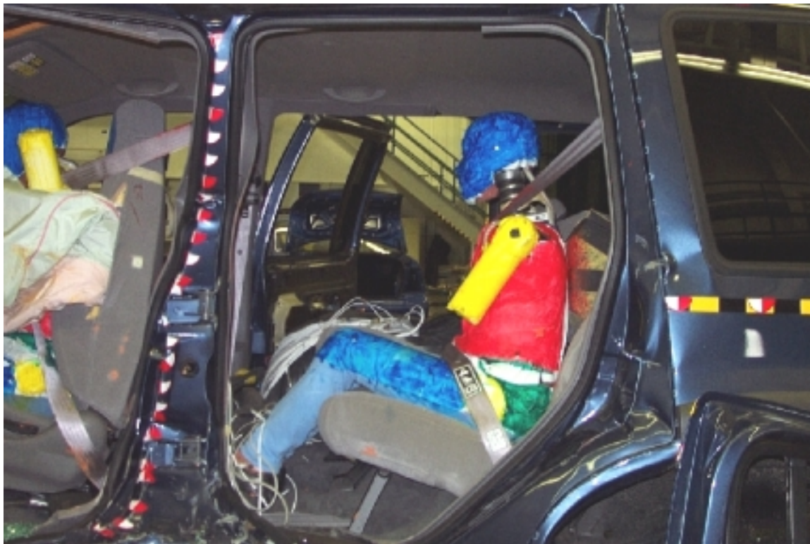
47. Côté gauche du passager arrière gauche, véhicule cible, après essai. Left side of left rear passenger, target vehicle, post-test.