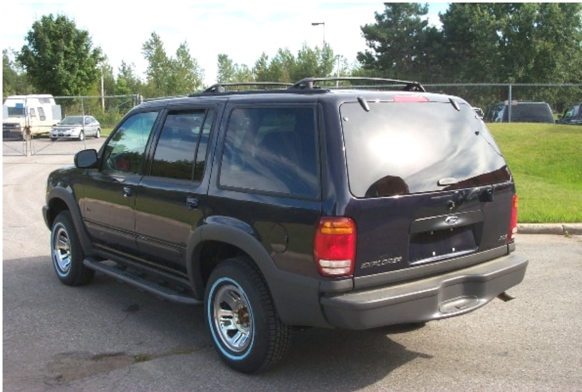
4. Vue ¾ arrière du véhicule béliet. ¾ rear view of bullet vehicle.