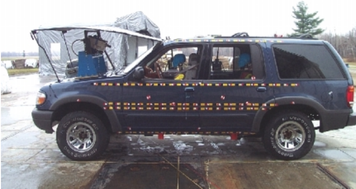
17. Vue générale côté gauche du véhicule cible, avant essai. General left side view of target vehicle, pre-test.