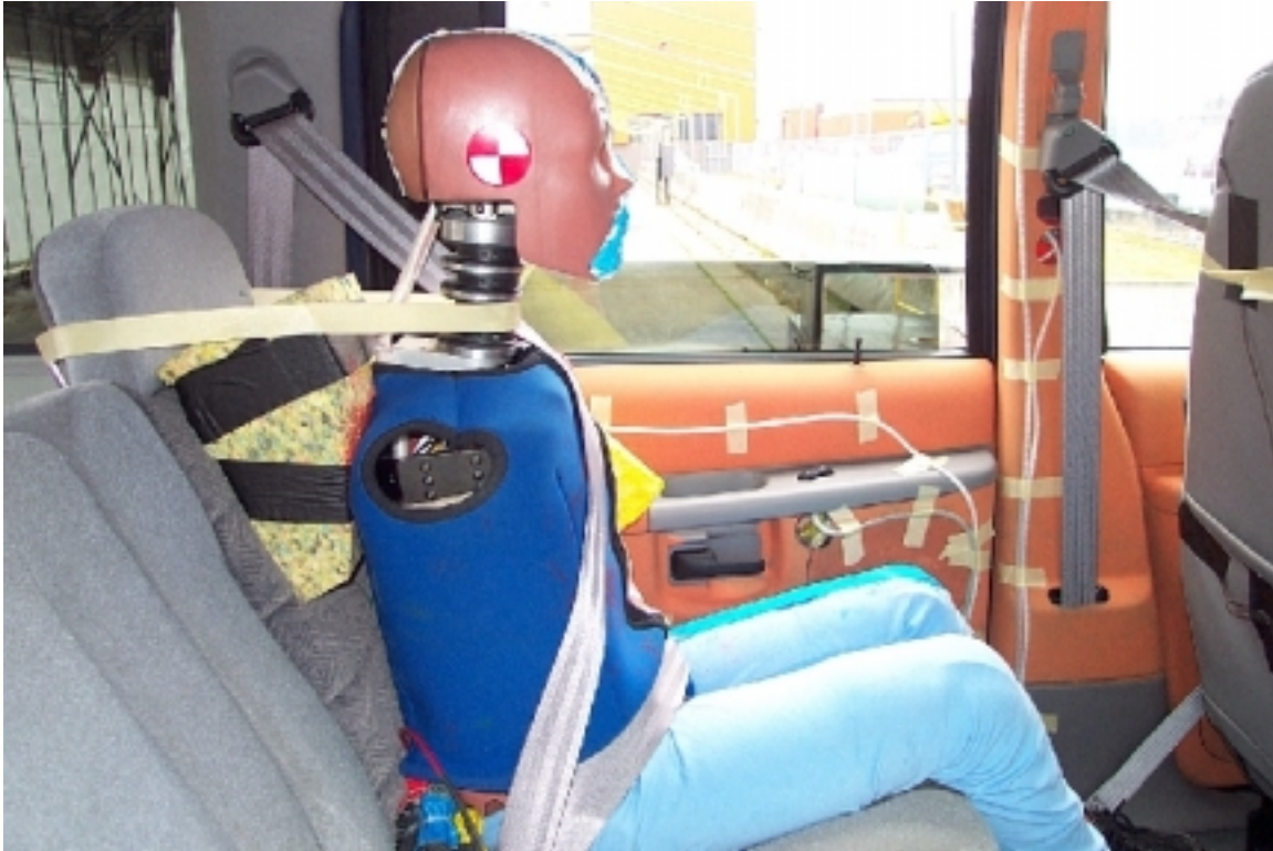
48. Côté droit du passager arrière gauche, véhicule cible, avant essai. Right side of left rear passenger, target vehicle, pre-test.