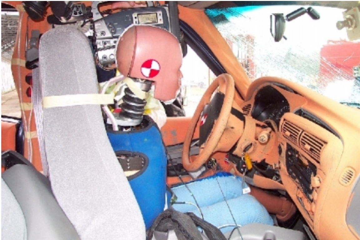
43. Côté droit du conducteur, véhicule cible, après essai. Right side of driver, target vehicle, post-test.