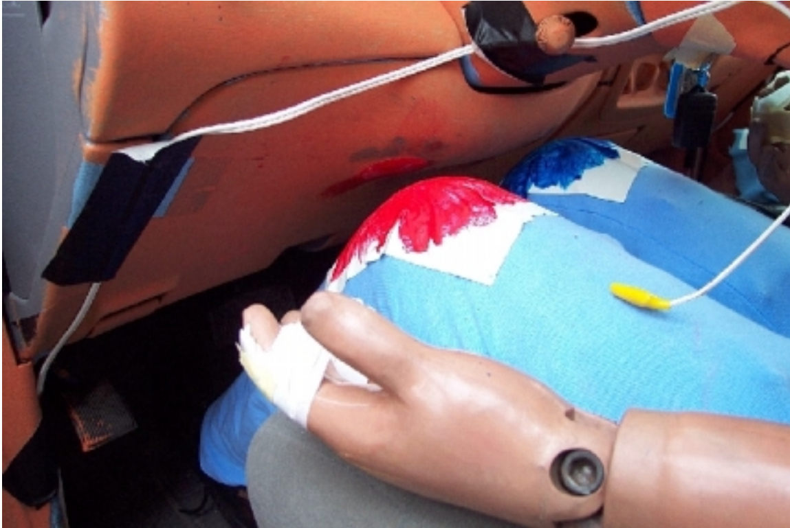
58. Point de contact des genoux du conducteur, véhicule béliier, après essai. Driver's knees contact points, bullet vehicle, post-test.