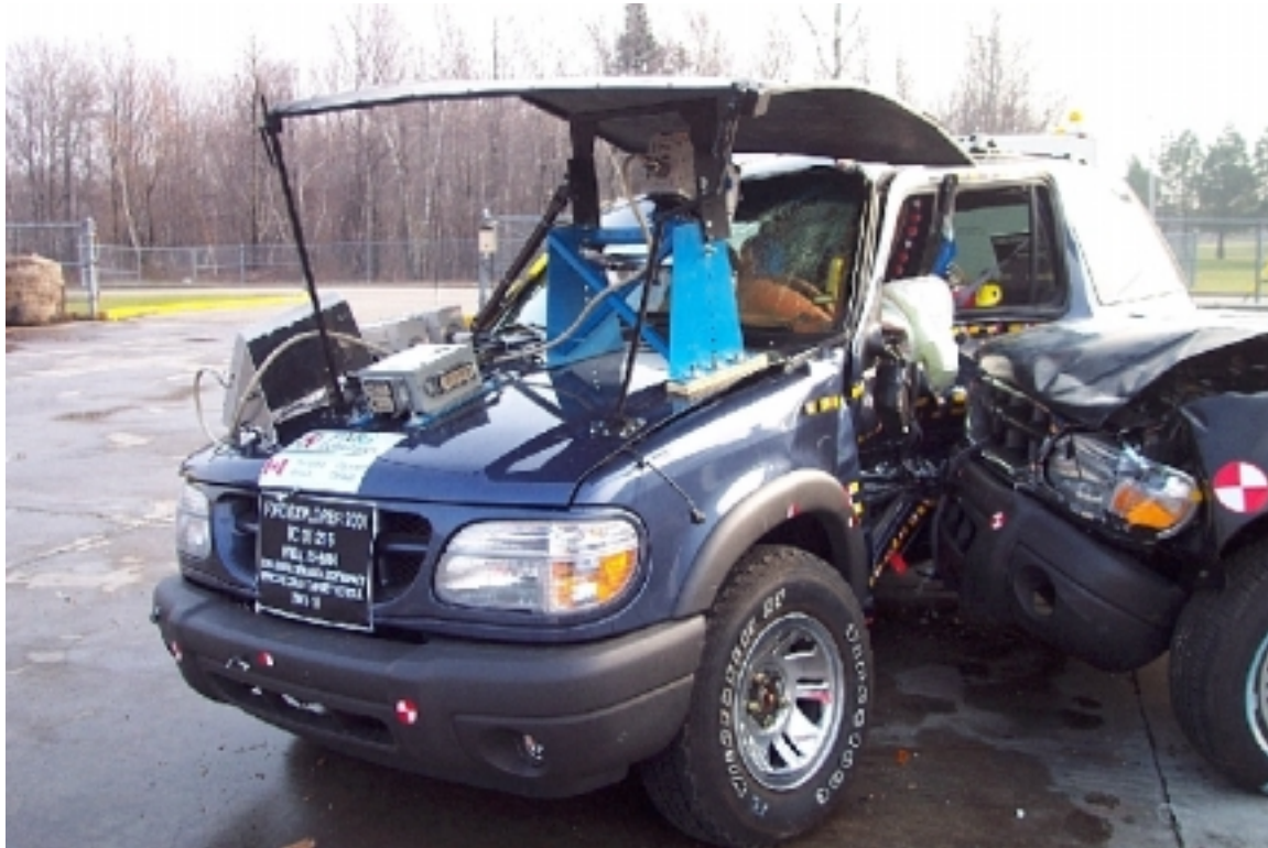
28. Position des véhicules, après essai. Position of vehicles, post-test.