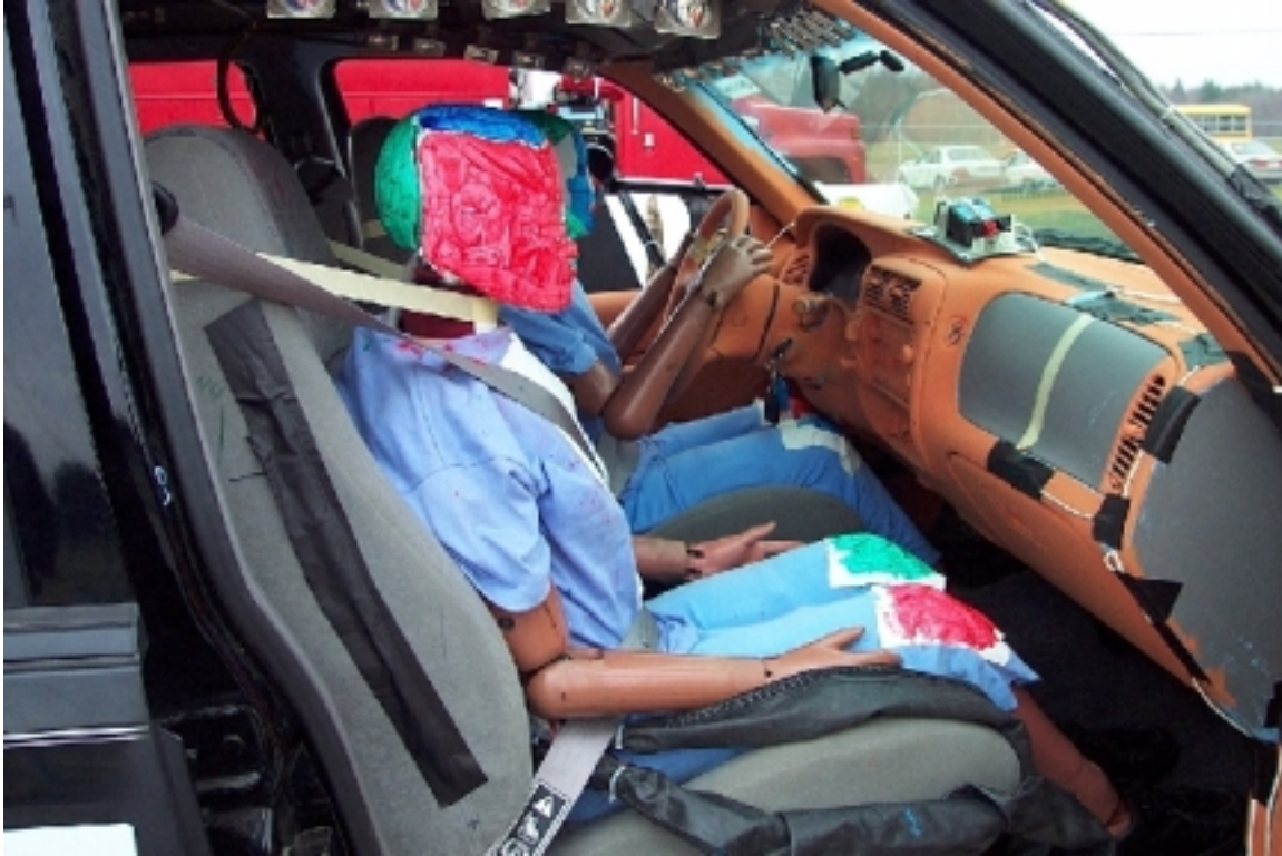
59. Position du passager, véhicule bélière, avant essai. Passenger's position, bullet vehicle, pre-test.