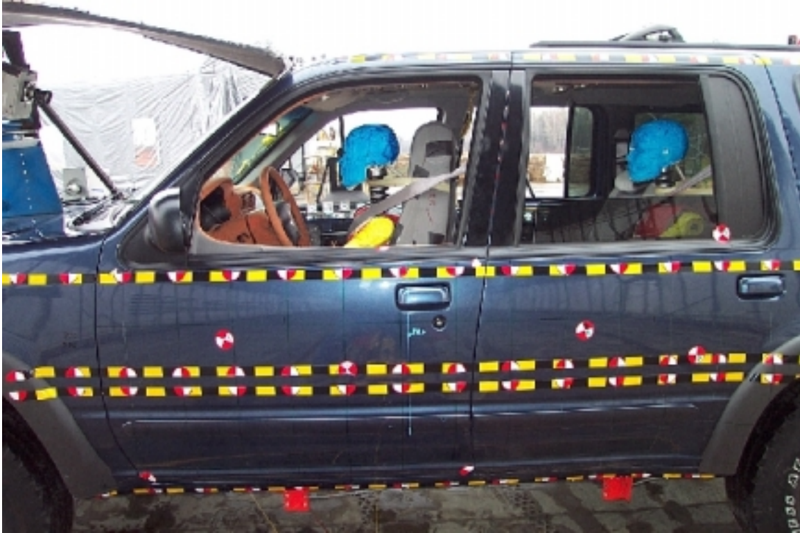
23. Surface ciblée côté gauche du véhicule cible, avant essai. Targets on left side of target vehicle, pre-test.