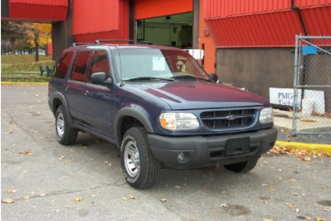
13. Vue \frac{3}{4} avant du véhicule cible. \frac{3}{4} front view of target vehicle.