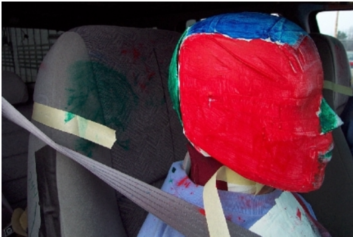
62. Point de contact de tête du passager, véhicule bélière, après essai. Passenger's head contact point, bullet vehicle, post-test.