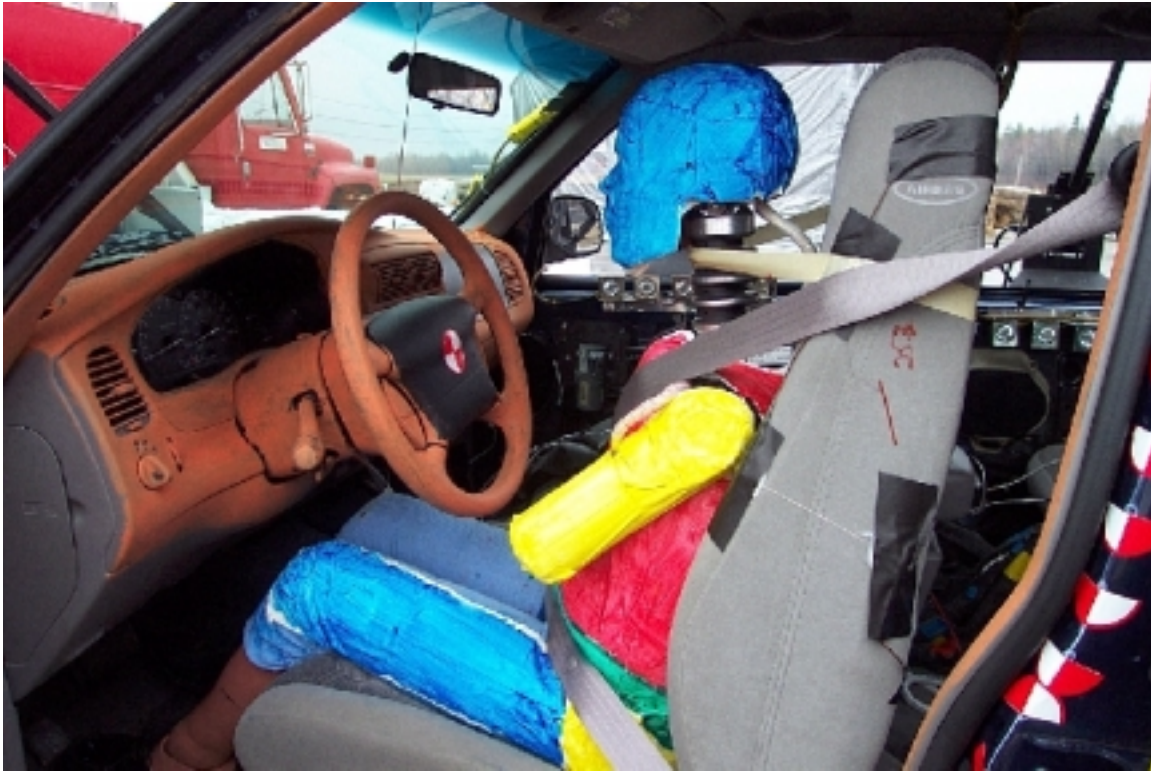
40. Côté gauche du conducteur, véhicule cible, avant essai. Left side of driver, target vehicle, pre-test.