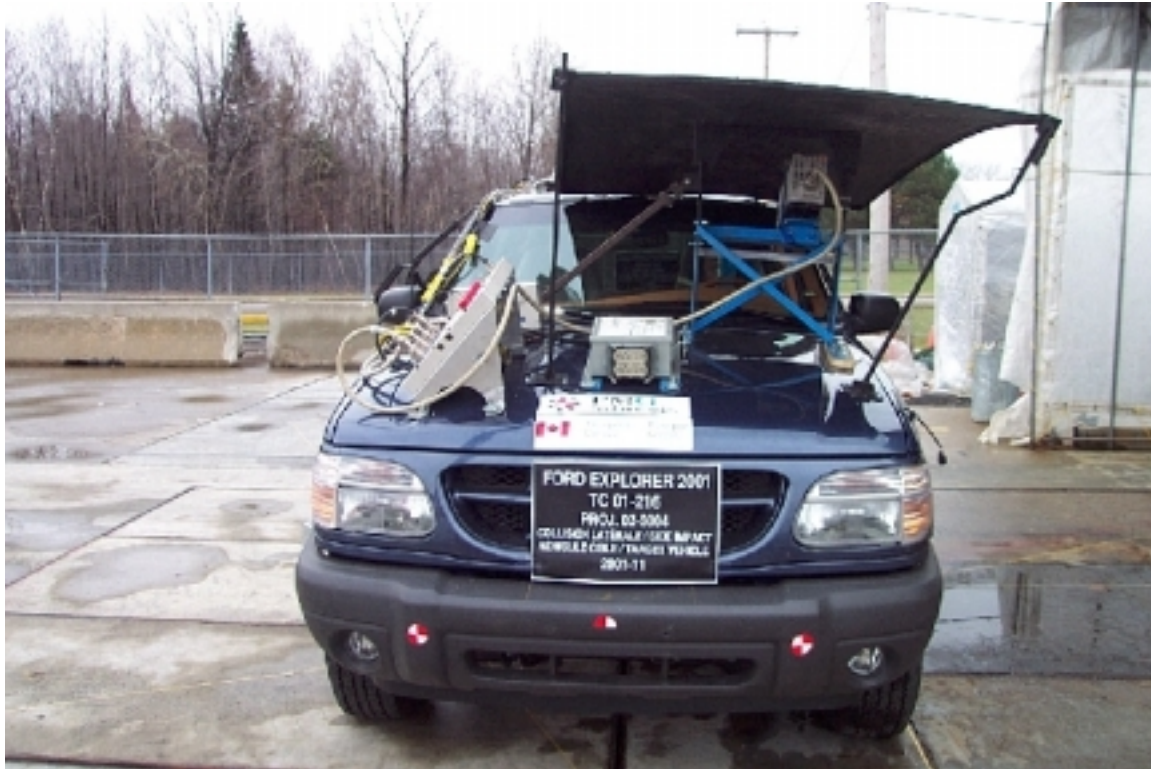
19. Vue générale avant du véhicule cible, avant essai. General front view of target vehicle, pre-test.