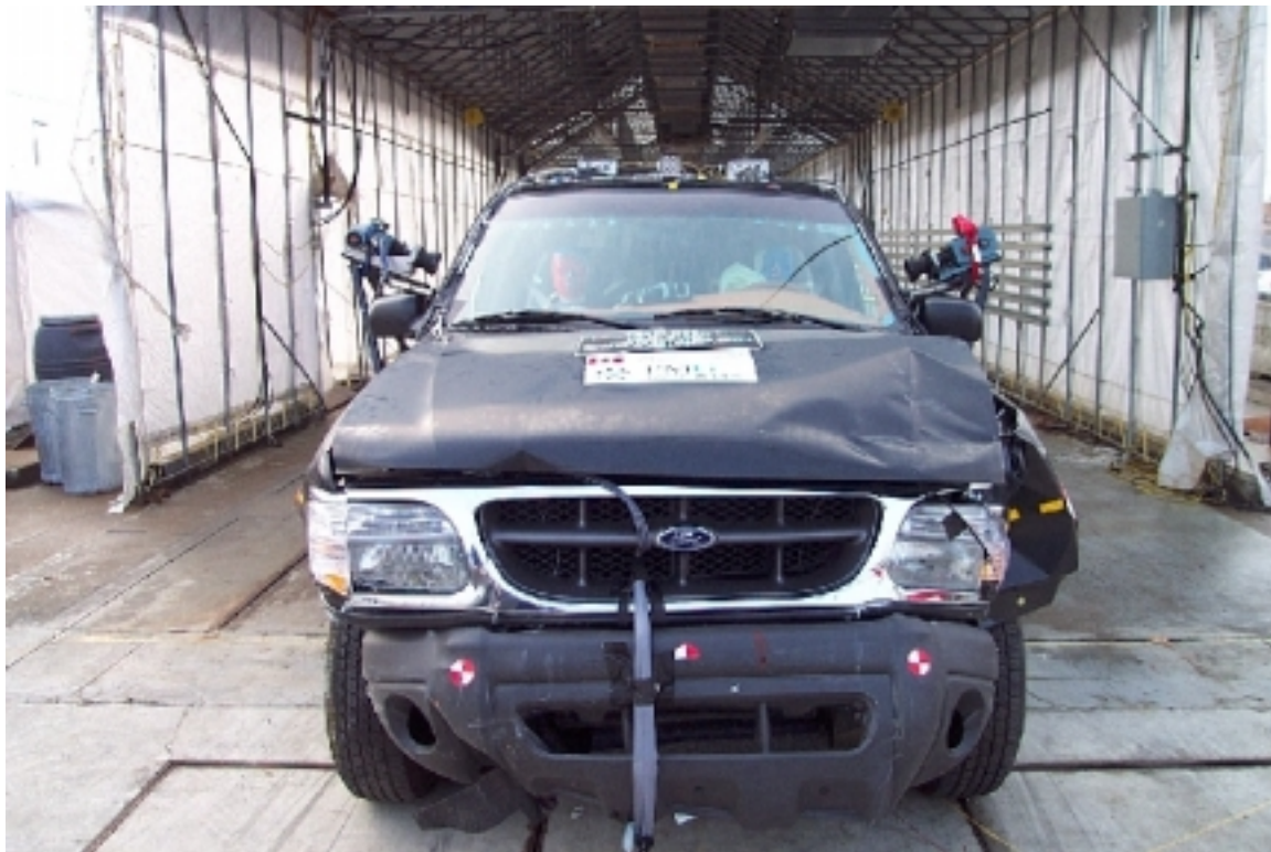
10. Vue générale avant du véhicule bélier, après essai. General front view of bullet vehicle, post-test.