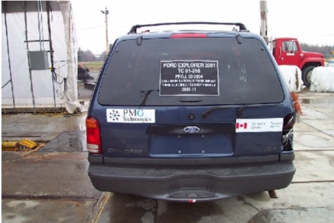
21. Vue générale arrière du véhicule cible, avant essai. General rear view of target vehicle, pre-test.