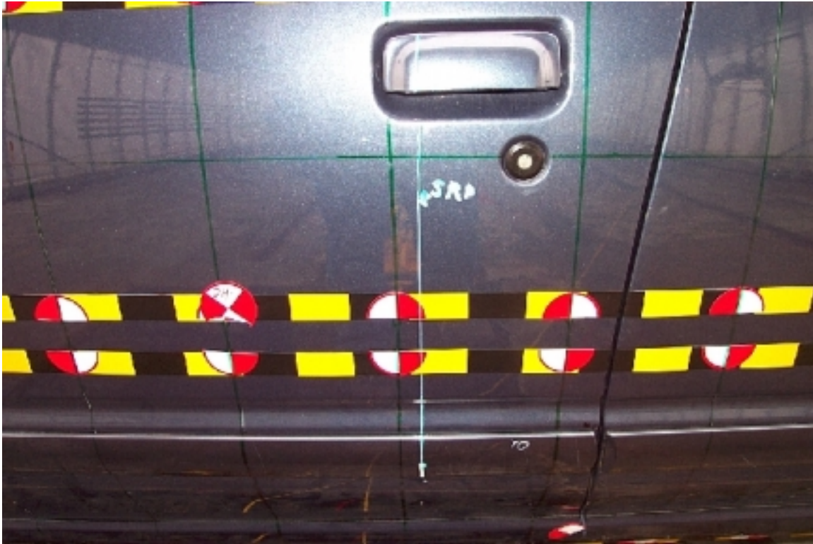
25. Point d'impact sur véhicule cible, avant essai. Impact point on target vehicle, pre-test.