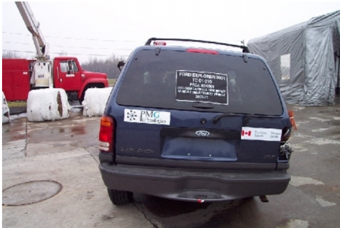
22. Vue générale arrière du véhicule cible, après essai. General rear view of target vehicle, post-test.