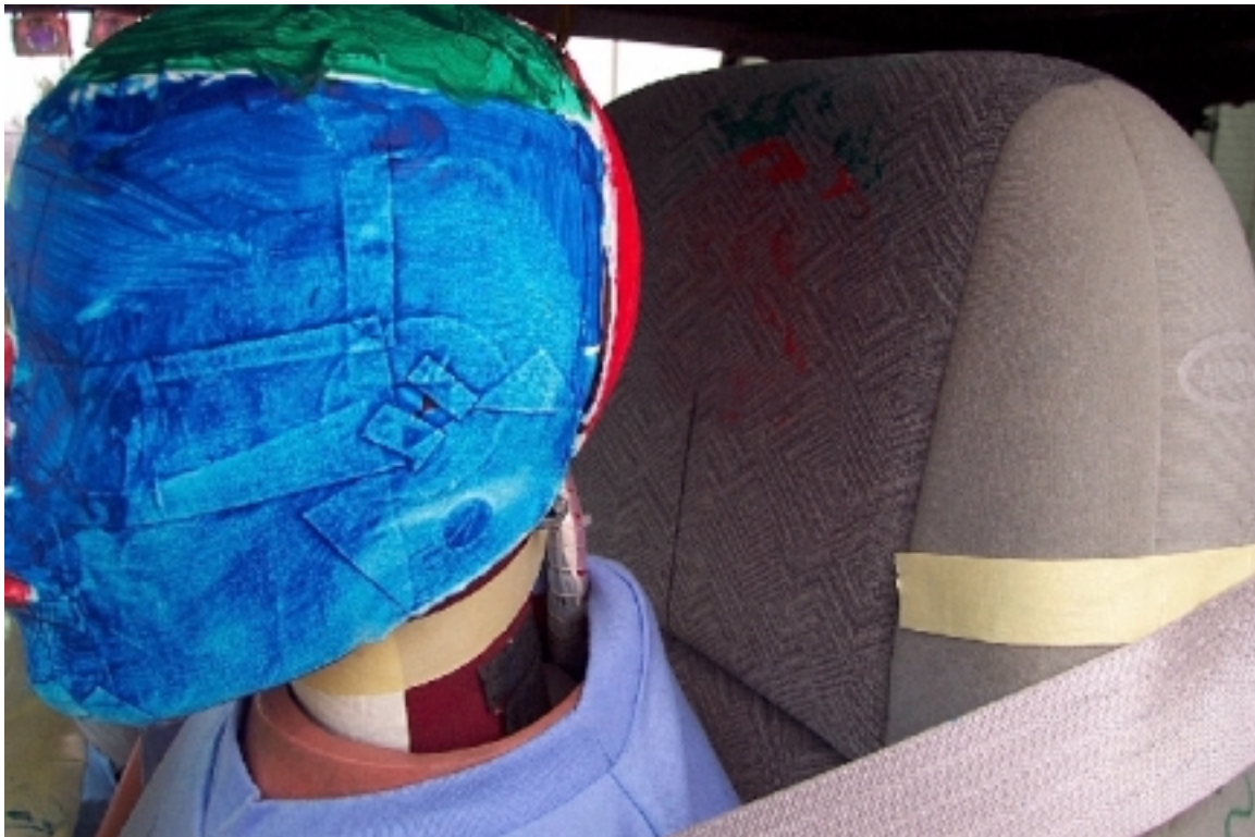
57. Point de contact de tête du conducteur, véhicule bélier, après essai. Driver's head contact point, bullet vehicle, post-test.