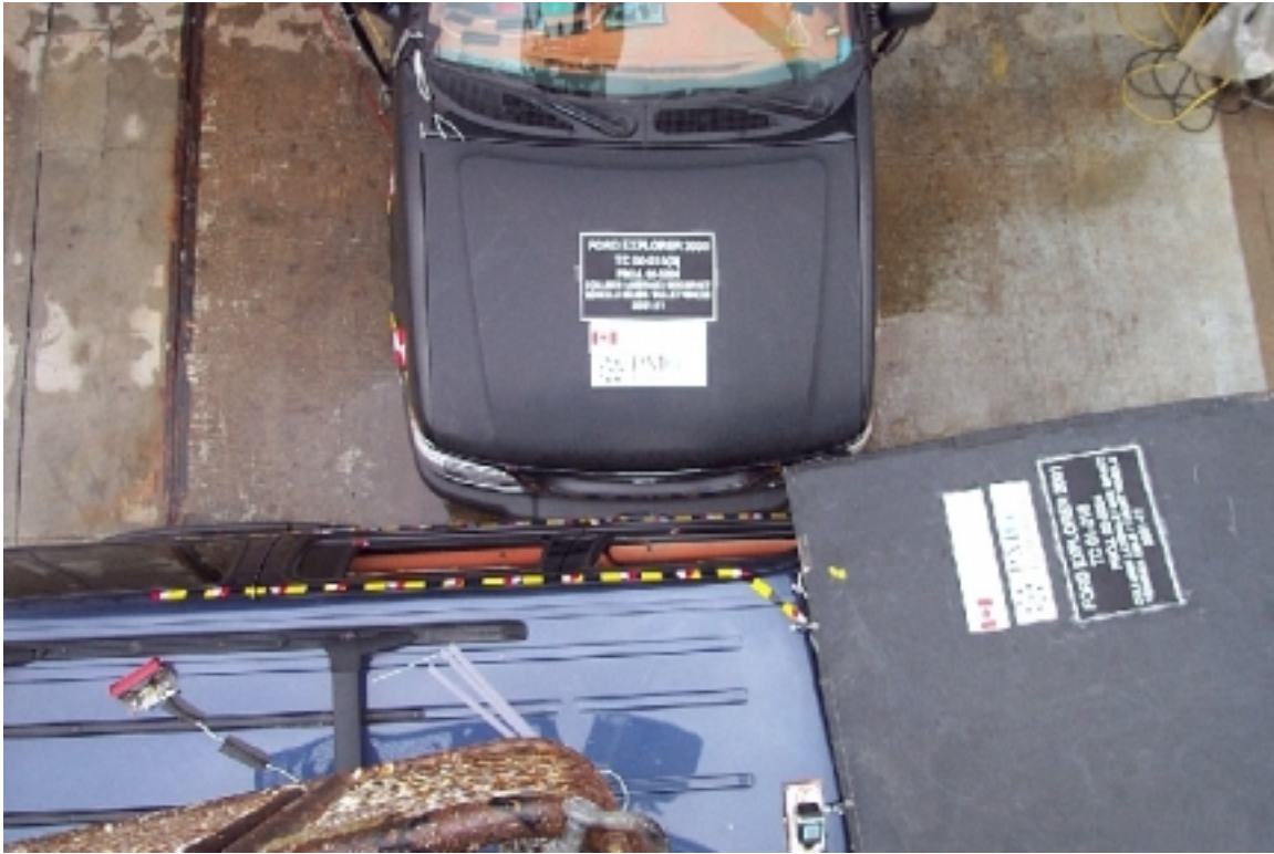
31. Vue de plan des véhicules en contact, avant essai. Top view of vehicles in contact, pre-test.