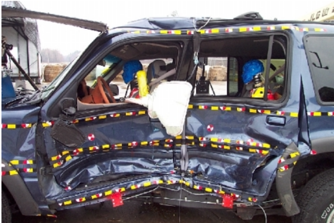
24. Surface ciblée côté gauche du véhicule cible, après essai. Targets on left side of target vehicle, post-test.