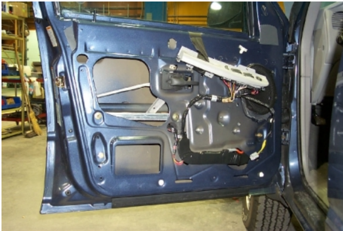
34. Mousse de protection à l'intérieur de la porte avant gauche. Protective foam inside left front door.