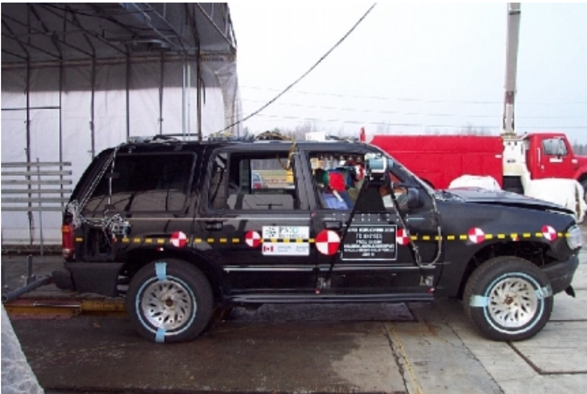
6. Vue générale côté droit du véhicule bélière, après essai. General right side view of bullet vehicle, post-test.