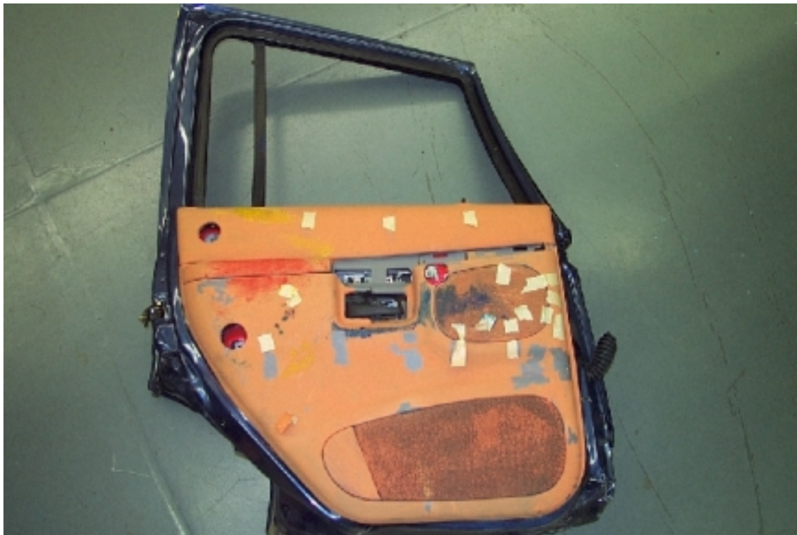
53. Points de contact sur l'intérieur de la portière arrière gauche, après essai. Contact points on the inside of the left rear door trim, post-test .