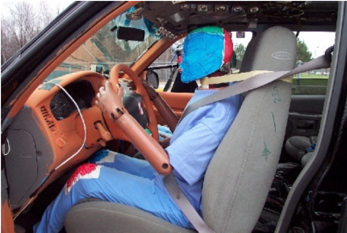
54. Position du conducteur, véhicule bélière, avant essai. Driver's position, bullet vehicle, pre-test.