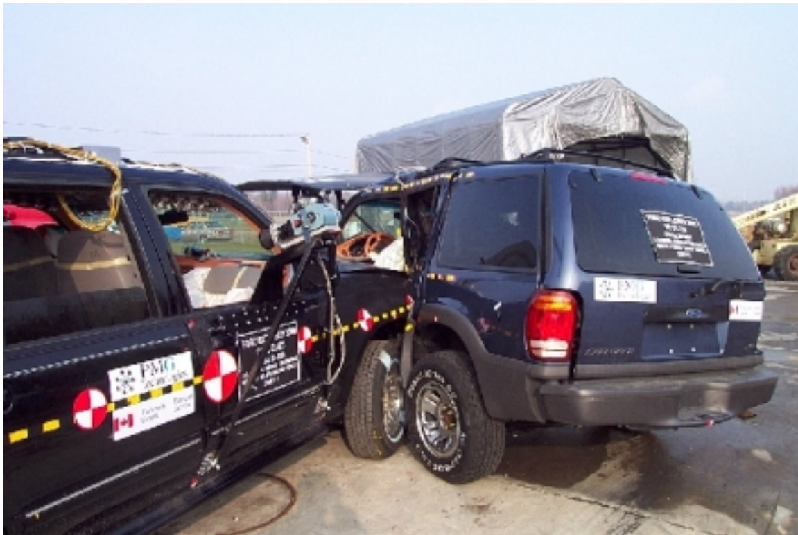
30. Position des véhicules, après essai. Position of vehicles, post-test.