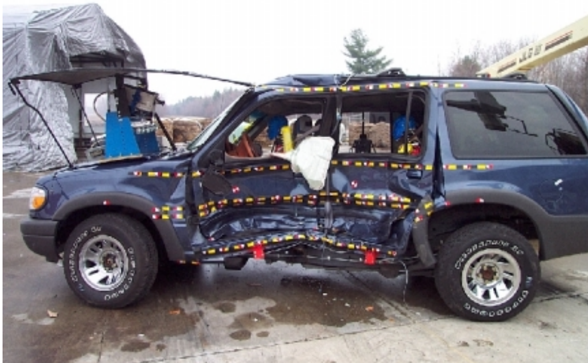
18. Vue générale côté gauche du véhicule cible, après essai. General left side view of target vehicle, post-test.