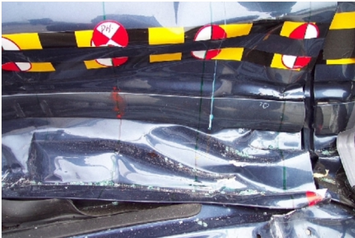
26. Point d'impact sur véhicule cible, après essai. Impact point on target vehicle, post-test.