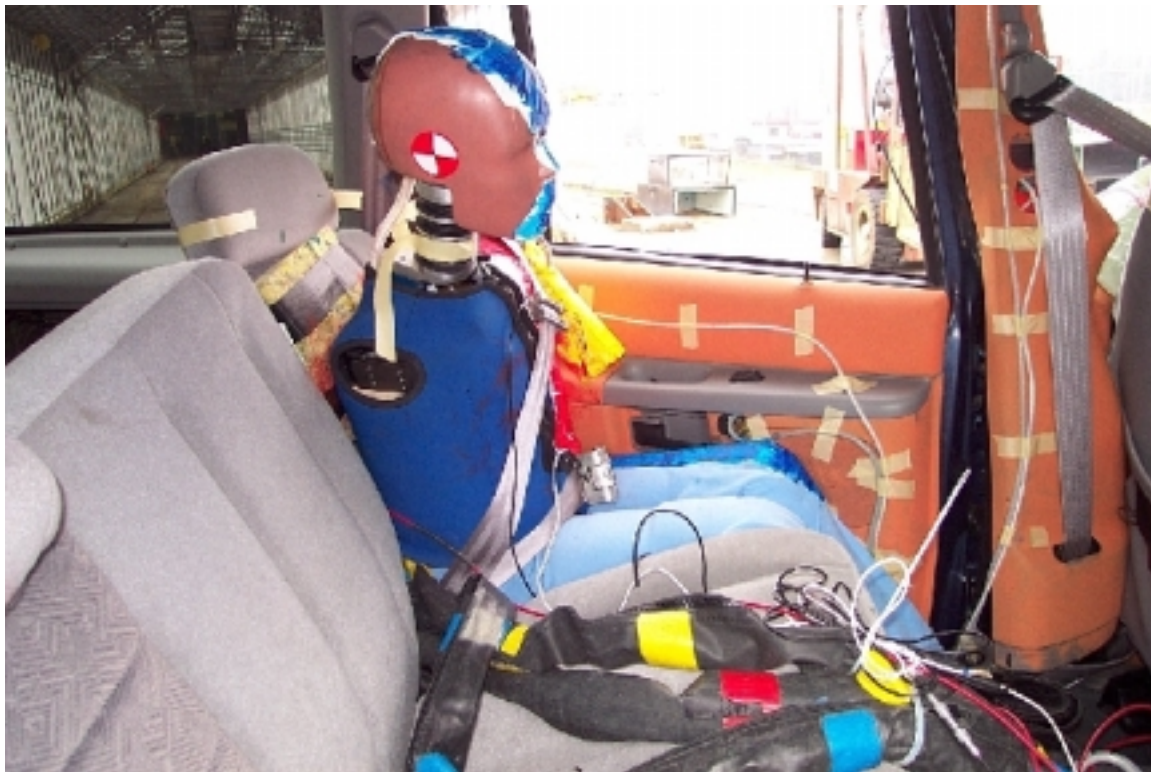
49. Côté droit du passager arrière gauche, véhicule cible, après essai. Right side of left rear passenger, target vehicle, post-test.