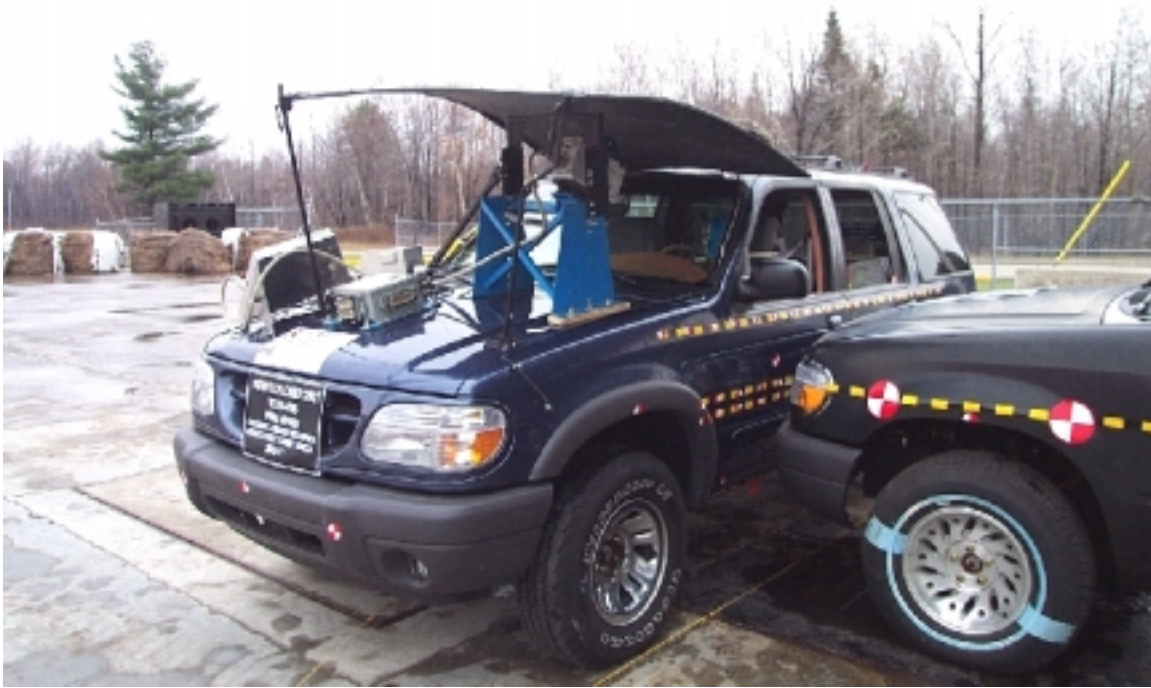
27. Vue \frac{3}{4} avant des véhicules en contact, avant essai. \frac{3}{4} front view of vehicles in contact, pre-test.