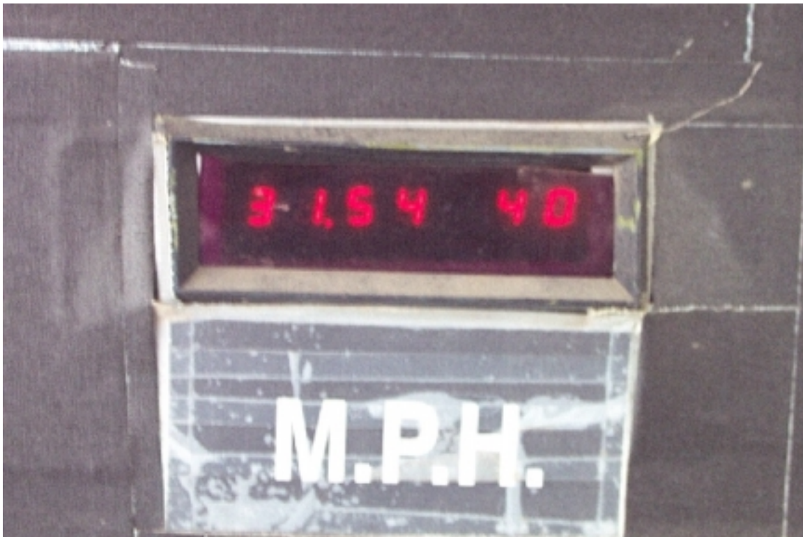
64. Affichage du lecteur de vitesse. Speed trap reading.