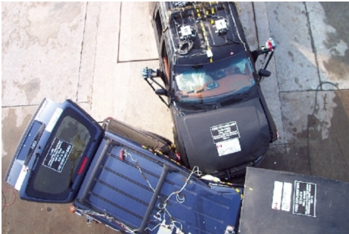
32. Vue de plan des véhicules en contact, après essai. Top view of vehicles in contact, post-test.