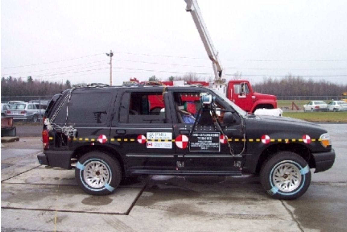
5. Vue générale côté droit du véhicule bélière, avant essai. General right side view of bullet vehicle, pre-test.