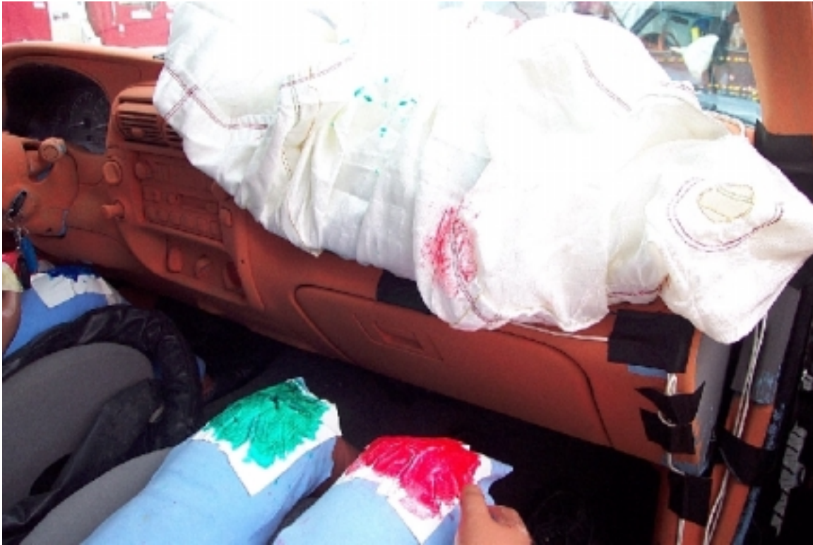
63. Point de contact des genoux du passager, véhicule bélière, après essai. Passenger's knees contact points, bullet vehicle, post-test.