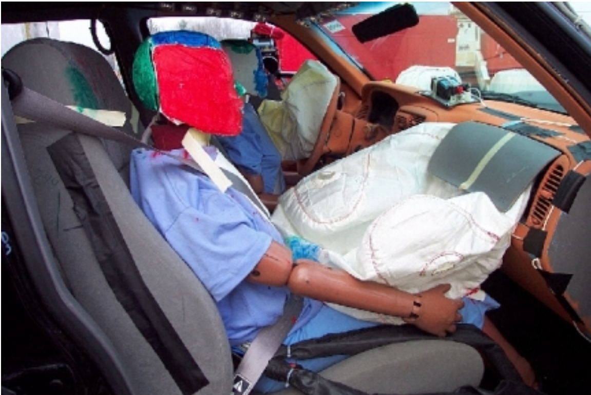
60. Position du passager, véhicule bélière, après essai. Passenger's position, bullet vehicle, post-test.