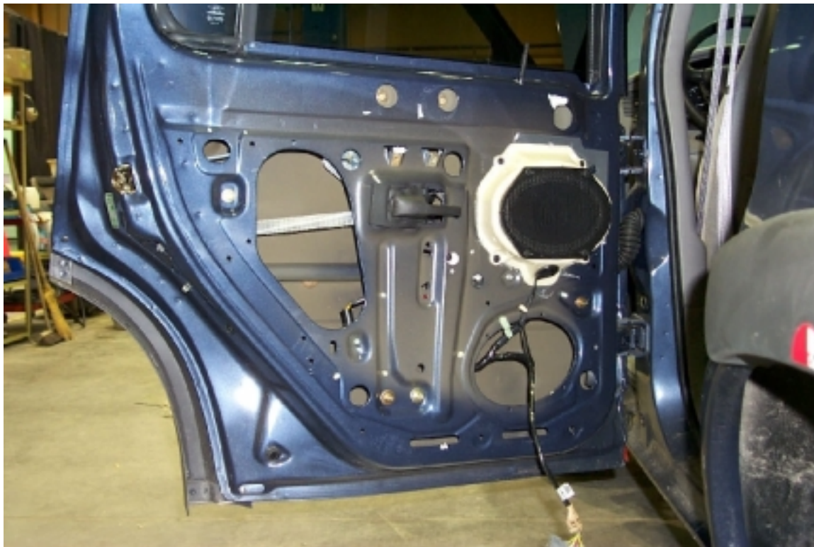
36. Mousse de protection à l'intérieur de la porte arrière gauche. Protective foam inside left rear door.