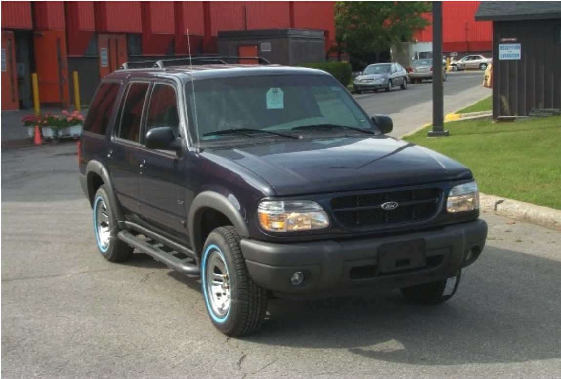
3. Vue ¾ avant du véhicule béliet. ¾ front view of bullet vehicle.