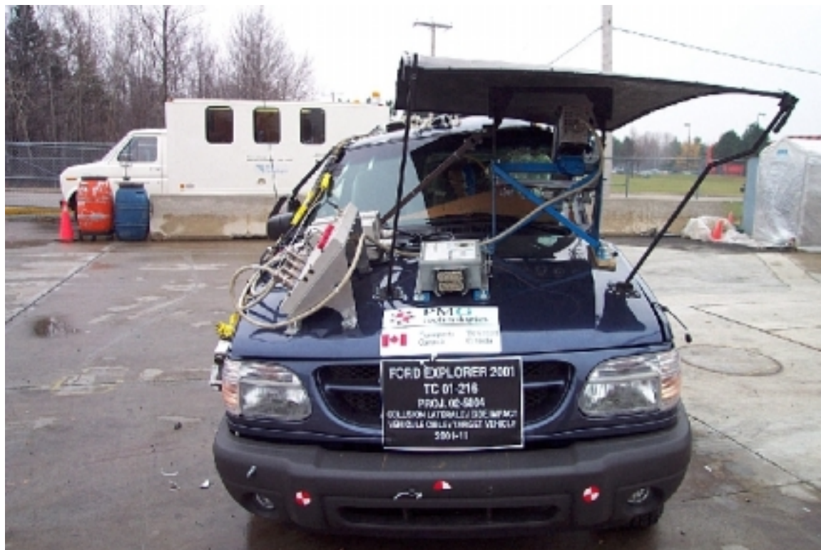
20. Vue générale avant du véhicule cible, après essai. General front view of target vehicle, post-test.