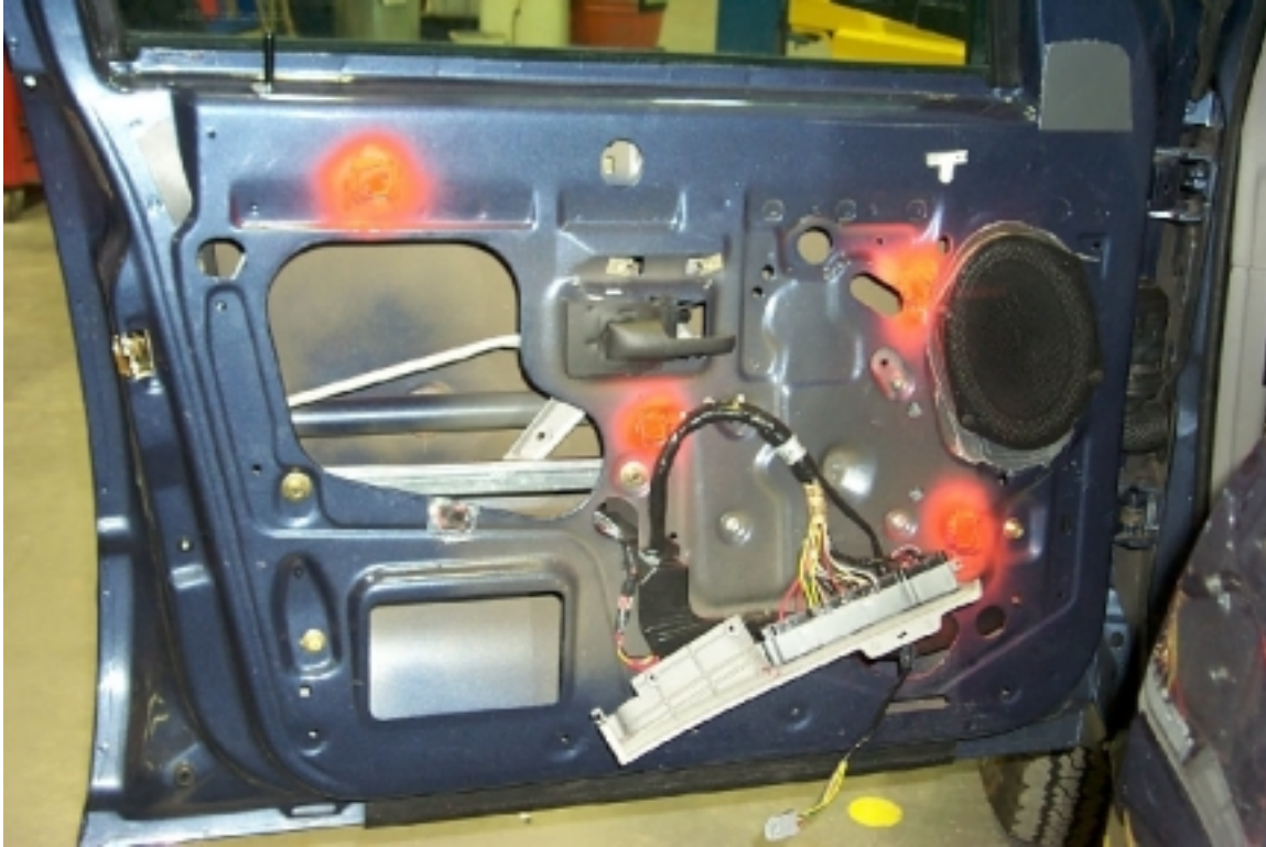
37. Position des accéléromètres dans la porte avant gauche. Position of accelerometers in front left door.