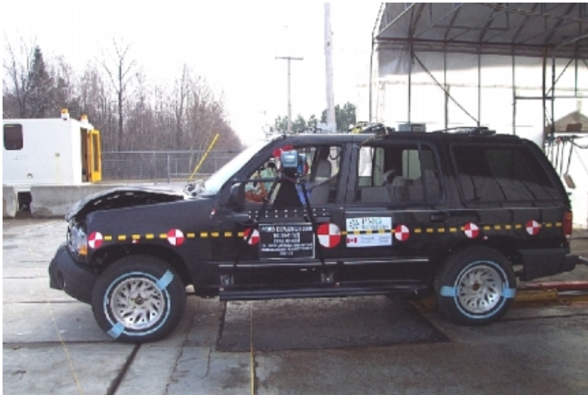
8. Vue générale côté gauche du véhicule bélière, après essai. General left side view of bullet vehicle, post-test