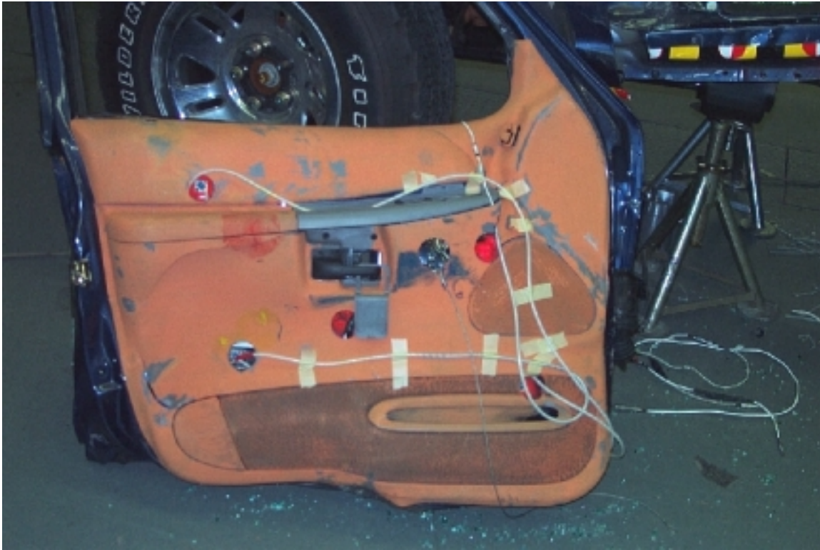
52. Points de contact sur l'intérieur de la portière avant gauche, après essai. Contact points on the inside of the left front door trim, post-test .