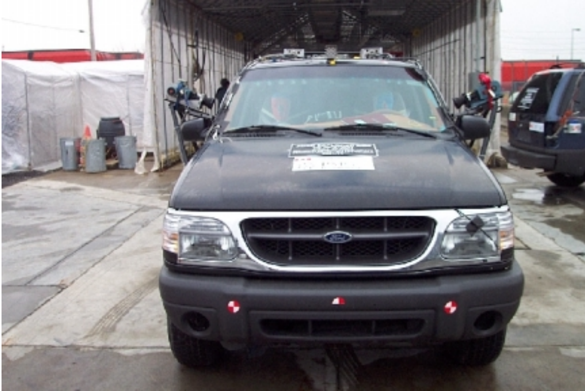
9. Vue générale avant du véhicule bélier, avant essai. General front view of bullet vehicle, pre-test.