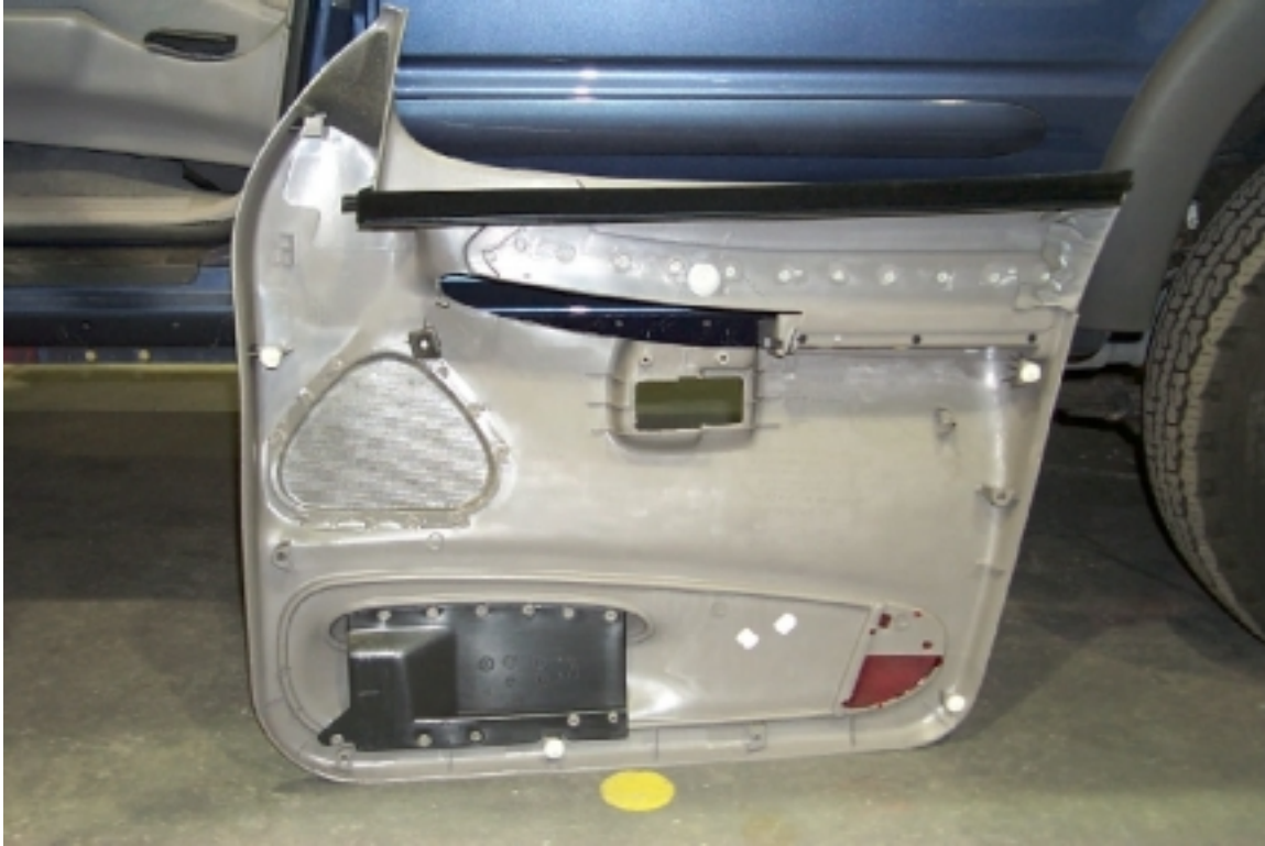
33. Mousse de protection située dans la garniture de la porte avant gauche. Protective foam located in left front door trim.