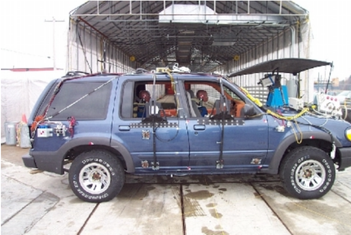
15. Vue générale côté droit du véhicule cible, avant essai. General right side view of target vehicle, pre-test.