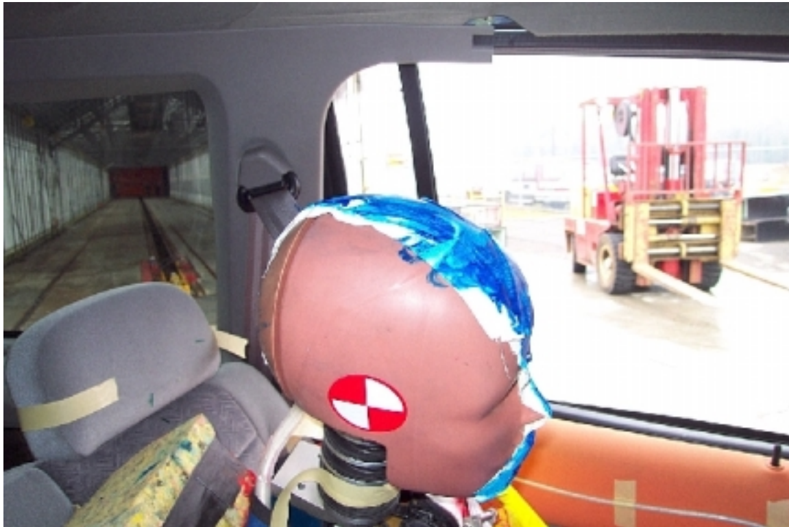
51. Cadre de fenêtre et pilier "C" du côté gauche, véhicule cible, après essai. Window edge and left side "C" pillar, target vehicle, post-test.