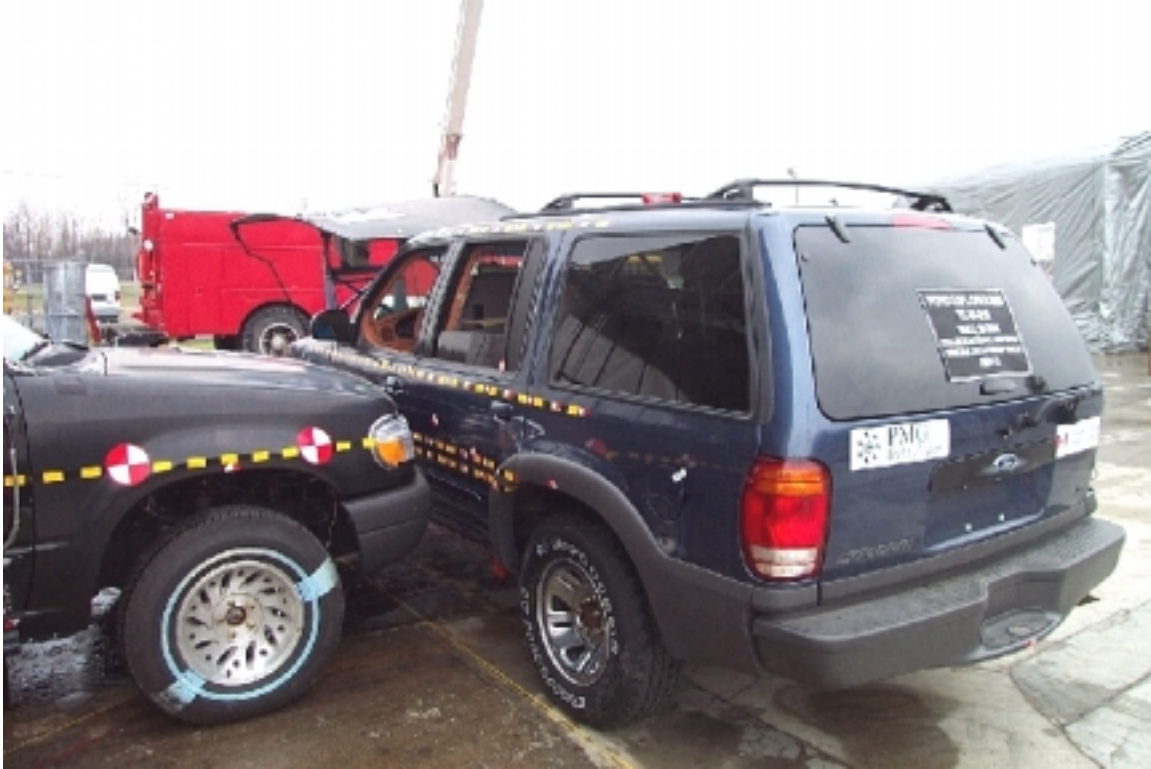
29. Vue \frac{3}{4} arrière des véhicules en contact, avant essai. \frac{3}{4} rear view of vehicles in contact, pre-test.