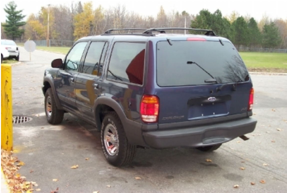
14. Vue \frac{3}{4} arrière du véhicule cible. \frac{3}{4} rear view of target vehicle.