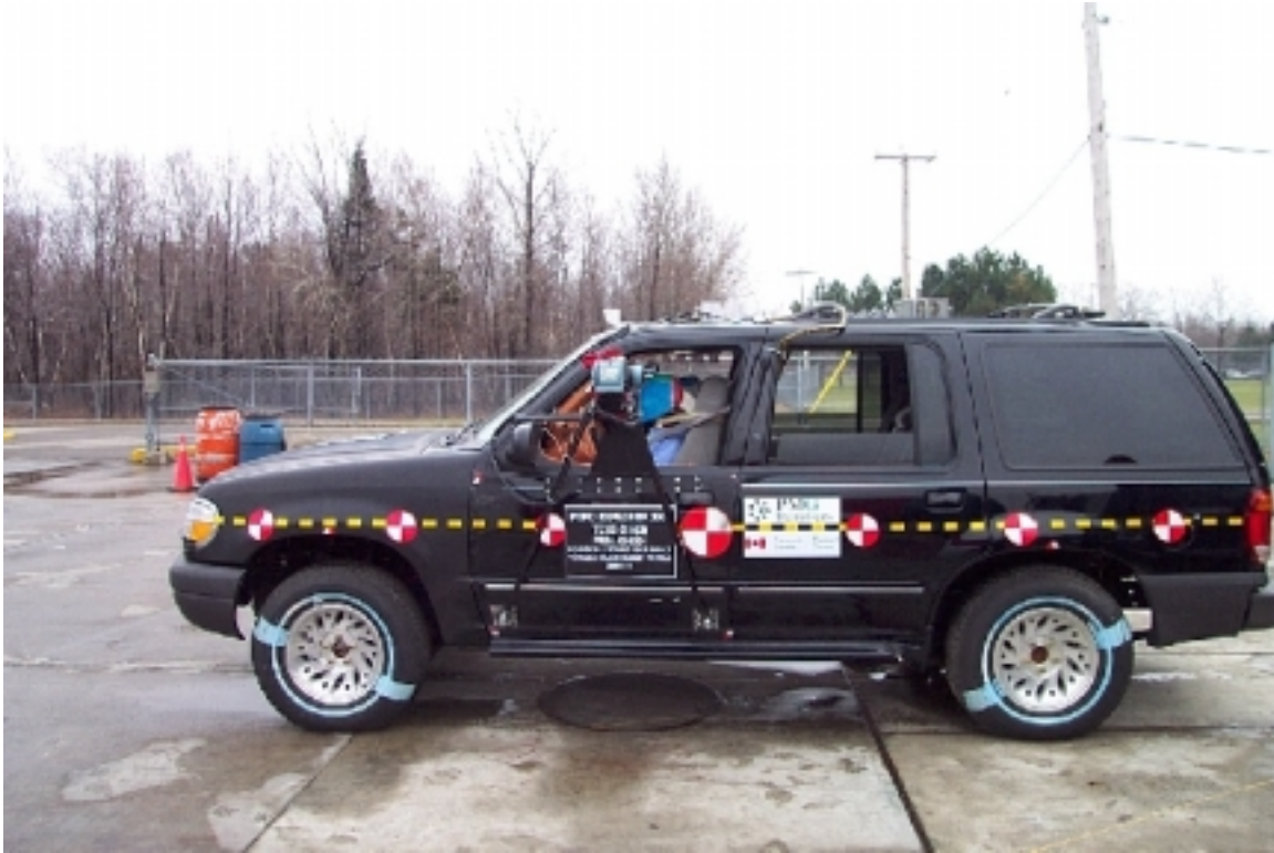
7. Vue générale côté gauche du véhicule bélière, avant essai. General left side view of bullet vehicle, pre-test.