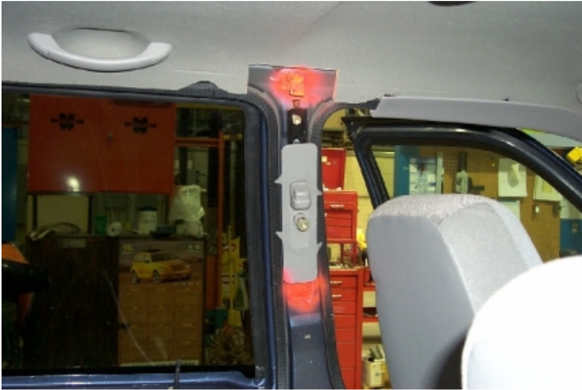
39. Position des accéléromètres sur le pilier "B". Position of accelerometers on "B"pillar.