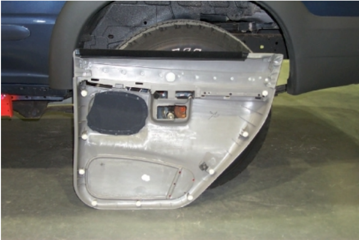
35. Mousse de protection située dans la garniture de la porte arrière gauche. Protective foam located in left rear door trim.