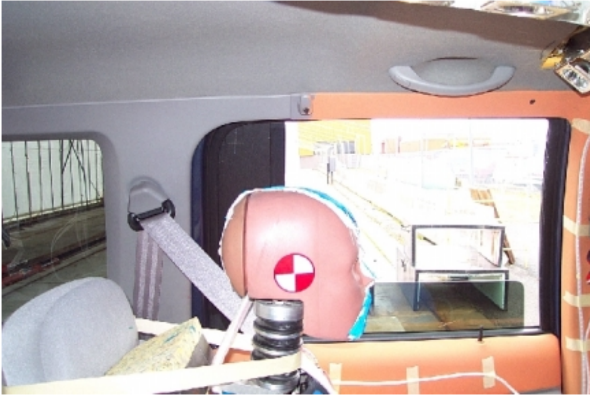
50. Cadre de fenêtre et pilier "C" du côté gauche, véhicule cible, avant essai. Window edge and left side "C" pillar, target vehicle, pre-test.