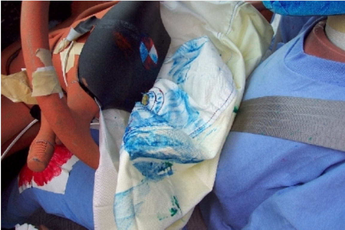
56. Point de contact de tête du conducteur, véhicule bélier, après essai. Driver's head contact point, bullet vehicle, post-test.