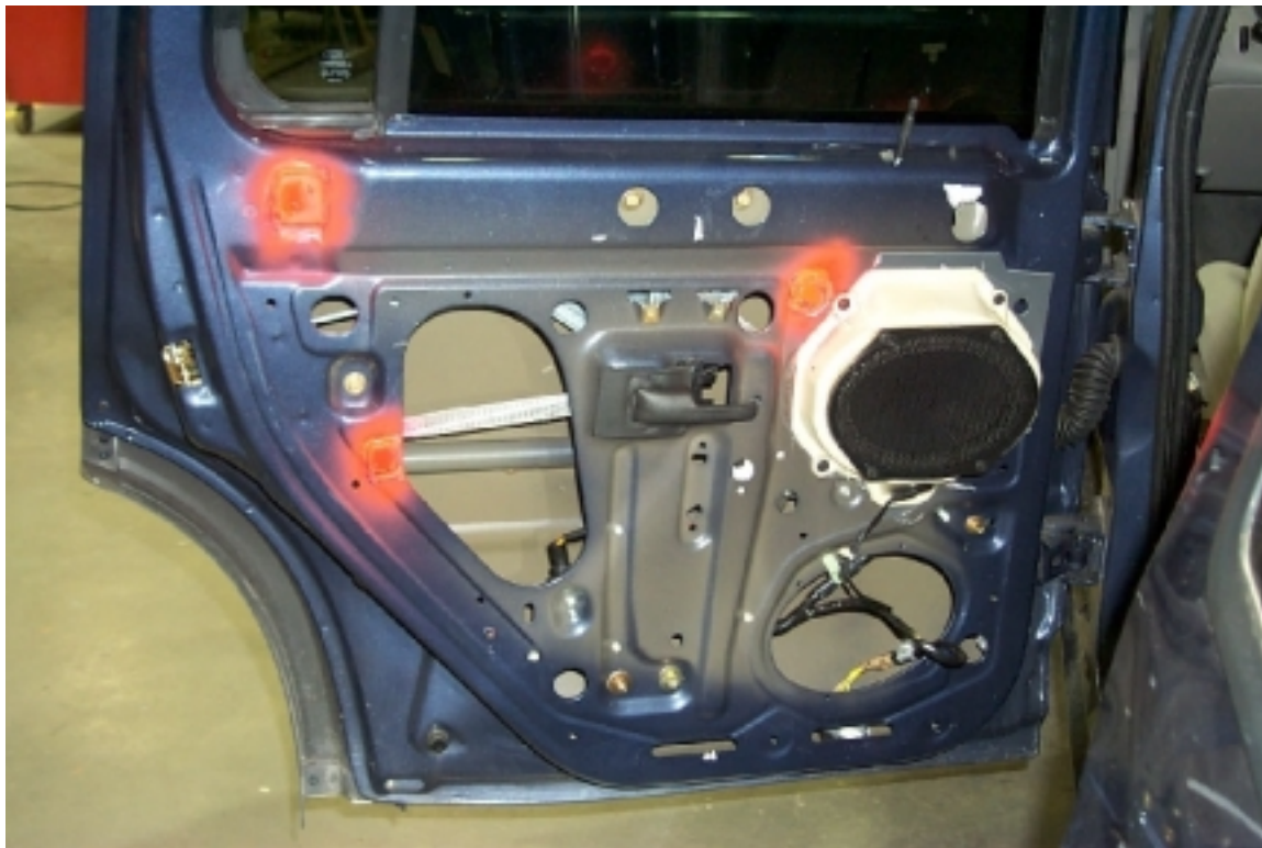
38. Position des accéléromètres dans la porte arrière gauche. Position of accelerometers in rear left door.