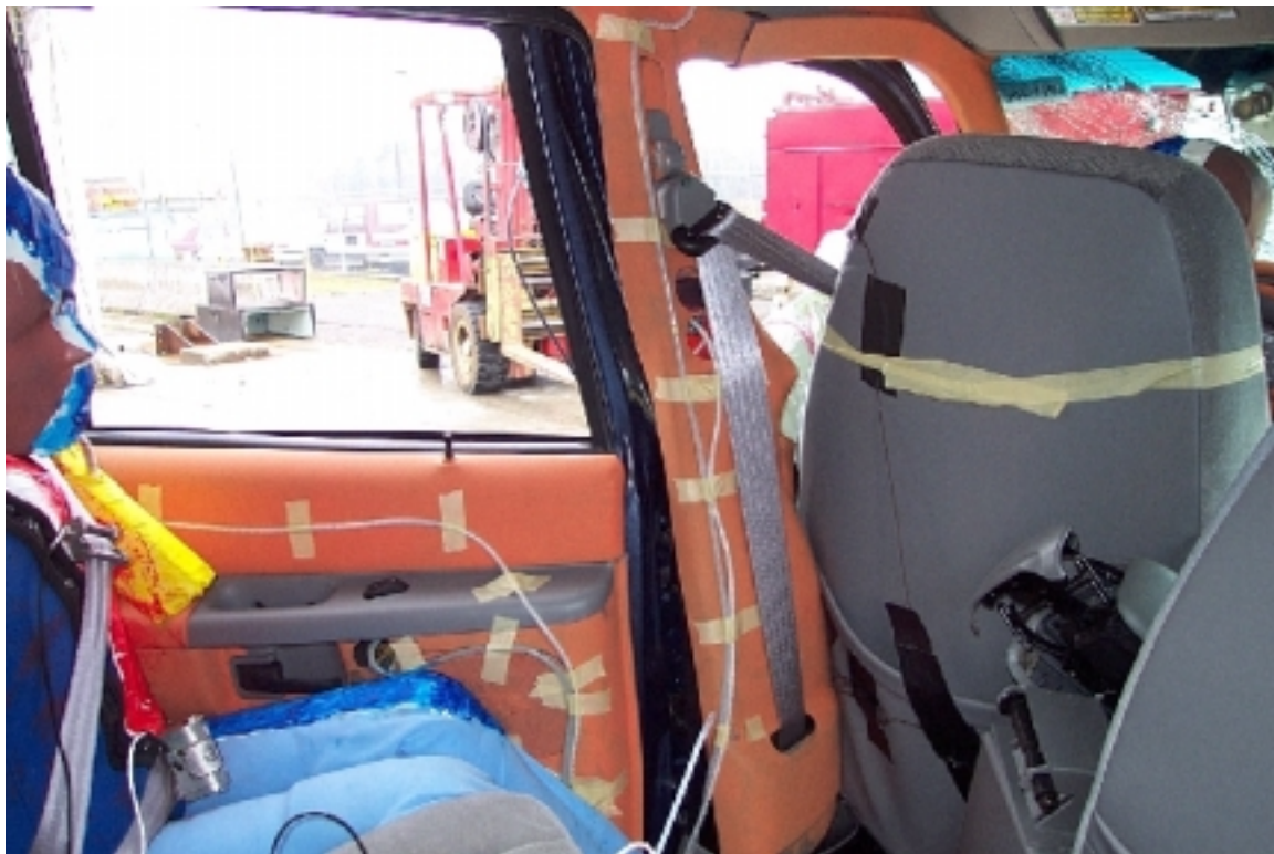
45. Pilier "B" du côté gauche, véhicule cible, après essai. Left side "B" pillar, target vehicle, post-test.