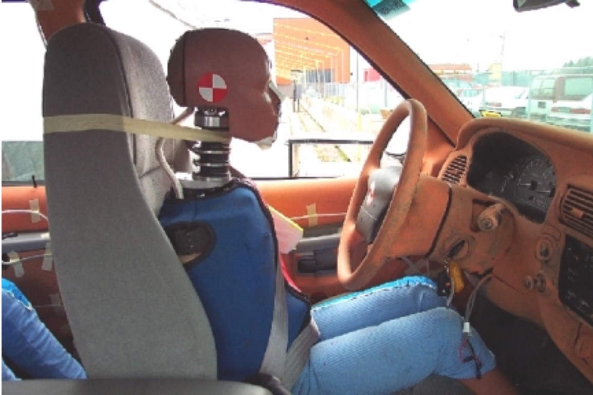
42. Côté droit du conducteur, véhicule cible, avant essai. Right side of driver, target vehicle, pre-test.