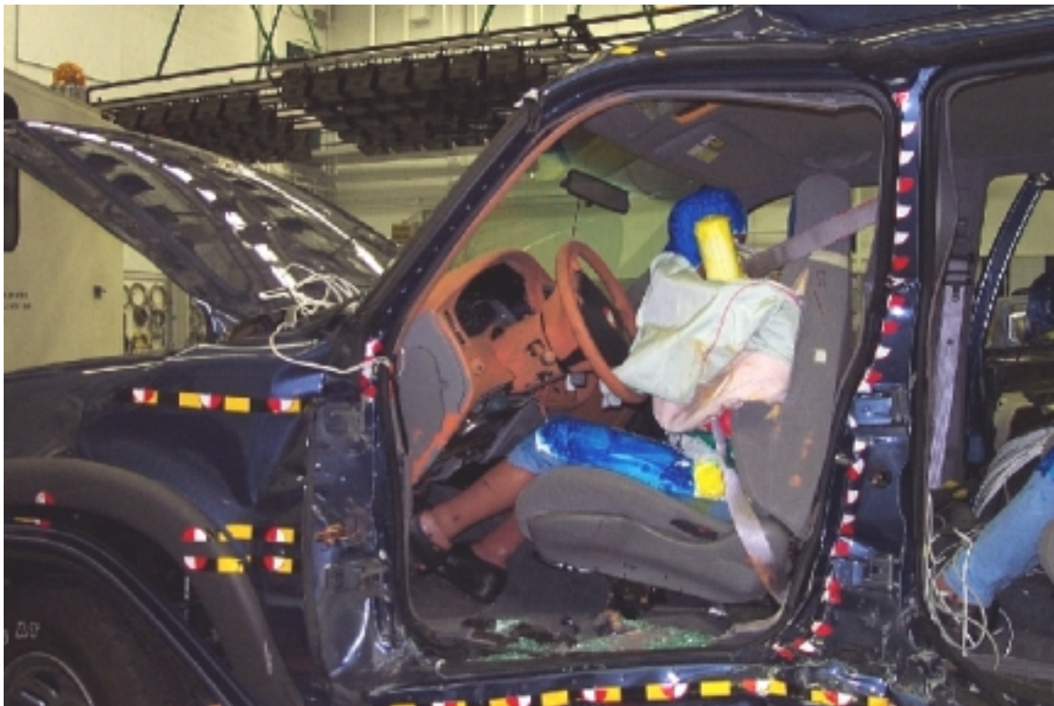
41. Côté gauche du conducteur, véhicule cible, après essai. Left side of driver, target vehicle, post-test.