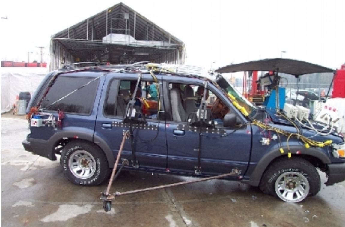
16. Vue générale côté droit du véhicule cible, après essai. General right side view of target vehicle, post-test.