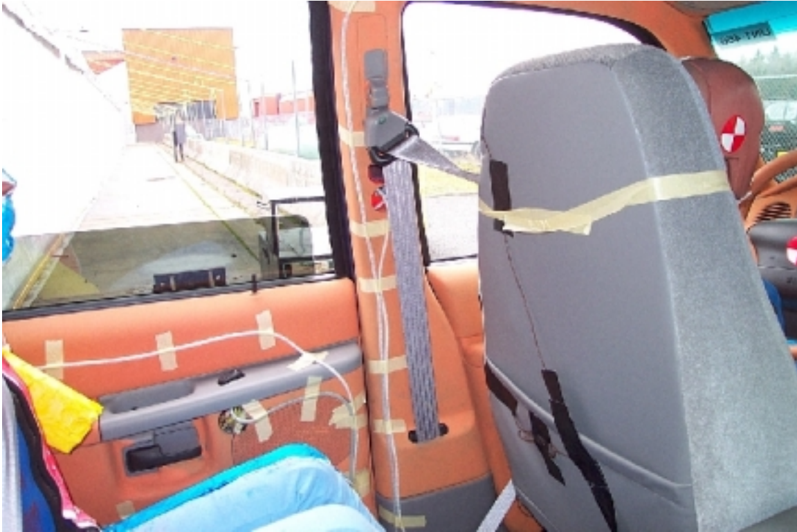
44. Pilier "B" du côté gauche, véhicule cible, avant essai. Left side "B" pillar, target vehicle, pre-test.