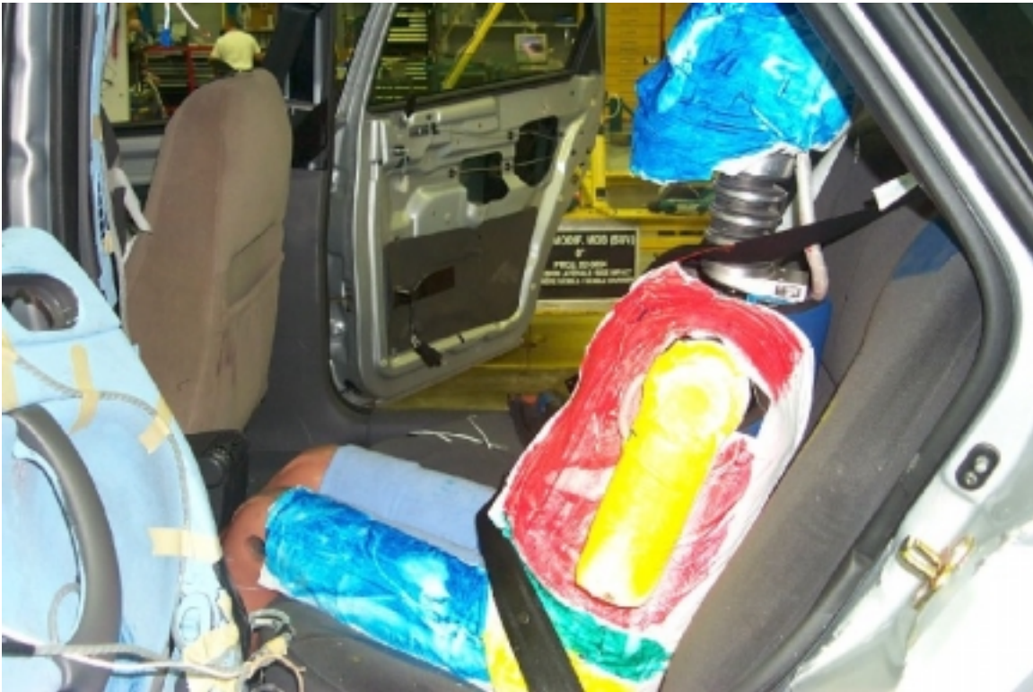
46. Côté gauche du passager arrière gauche, véhicule cible, après essai. Left side of left rear passenger, target vehicle, post-test.