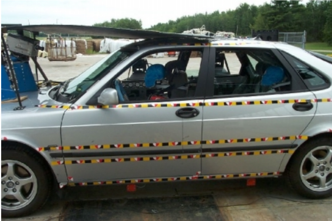
13. Surface ciblée côté gauche du véhicule cible, avant essai. Targets on left side of target vehicle, pre-test.