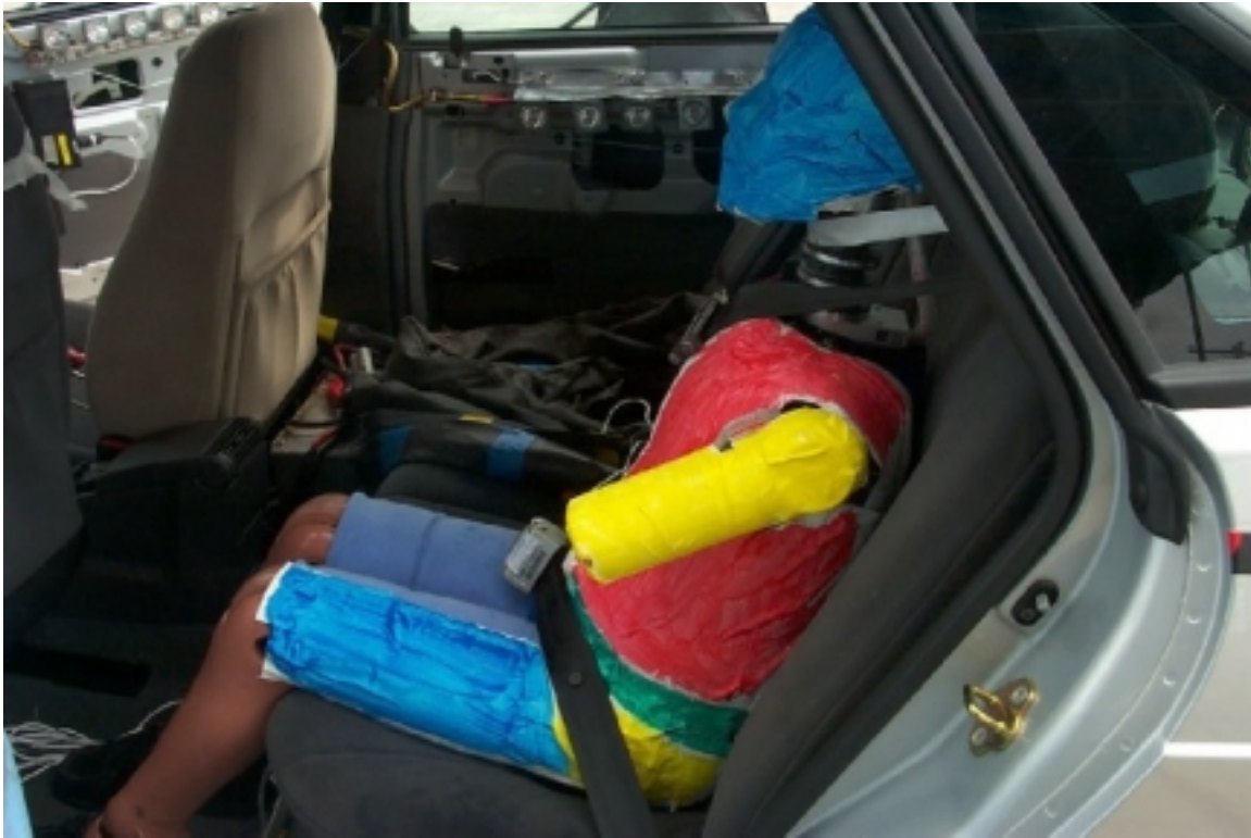
45. Côté gauche du passager arrière gauche, véhicule cible, avant essai. Left side of left rear passenger, target vehicle, pre-test.