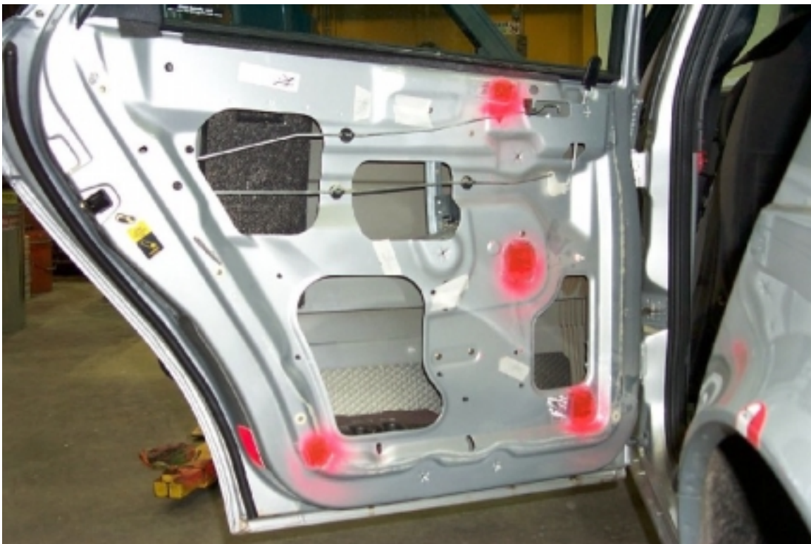
36. Position des accéléromètres dans la porte arrière gauche. Position of accelerometers in rear left door.