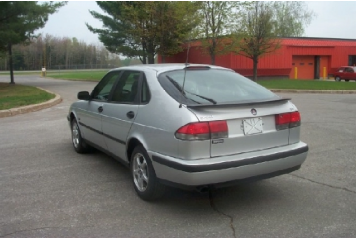
4. Vue ¾ arrière du véhicule cible. ¾ rear view of target vehicle.