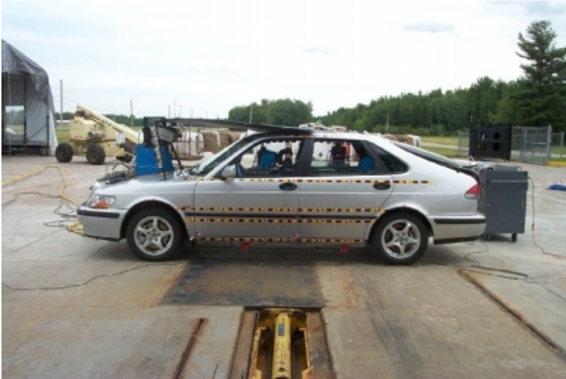
7. Vue générale côté gauche du véhicule cible, avant essai. General left side view of target vehicle, pre-test.