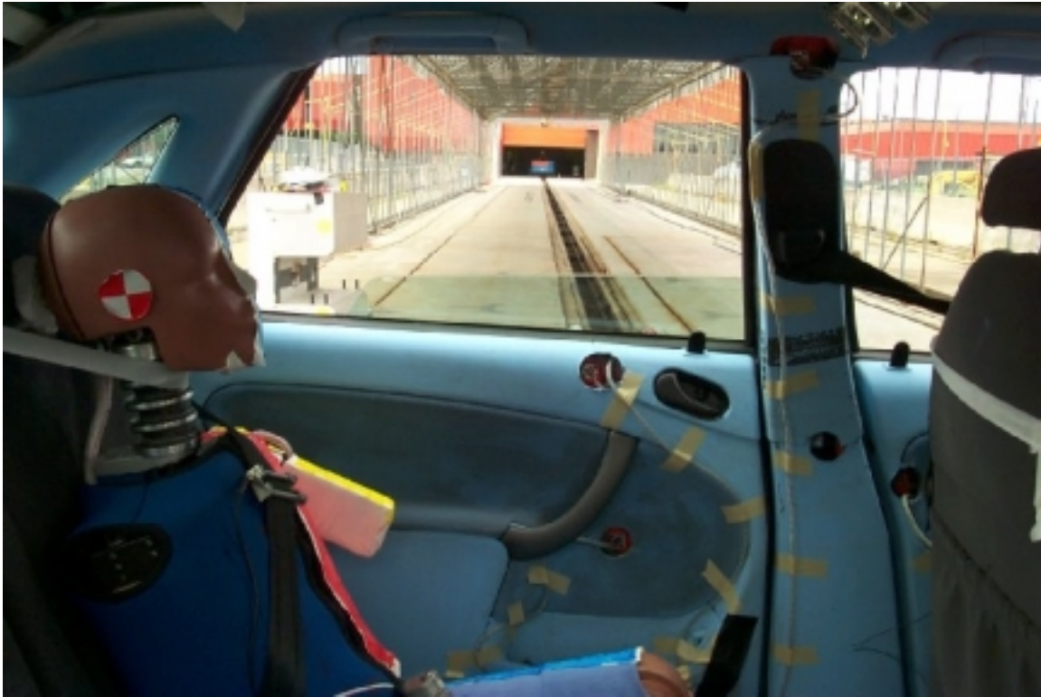
43. Pilier "B" du côté gauche, véhicule cible, avant essai. Left side "B" pillar, target vehicle, pre-test.