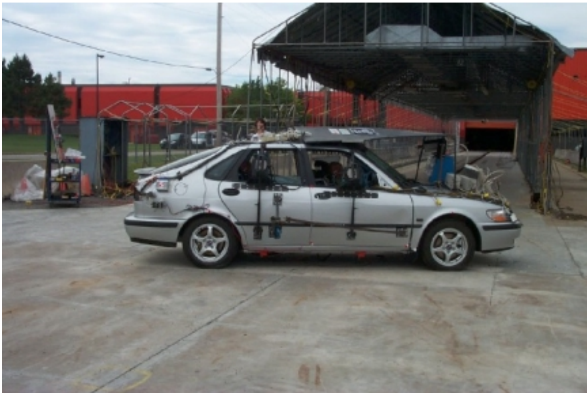
6. Vue générale côté droit du véhicule cible, après essai. General right side view of target vehicle, post-test.