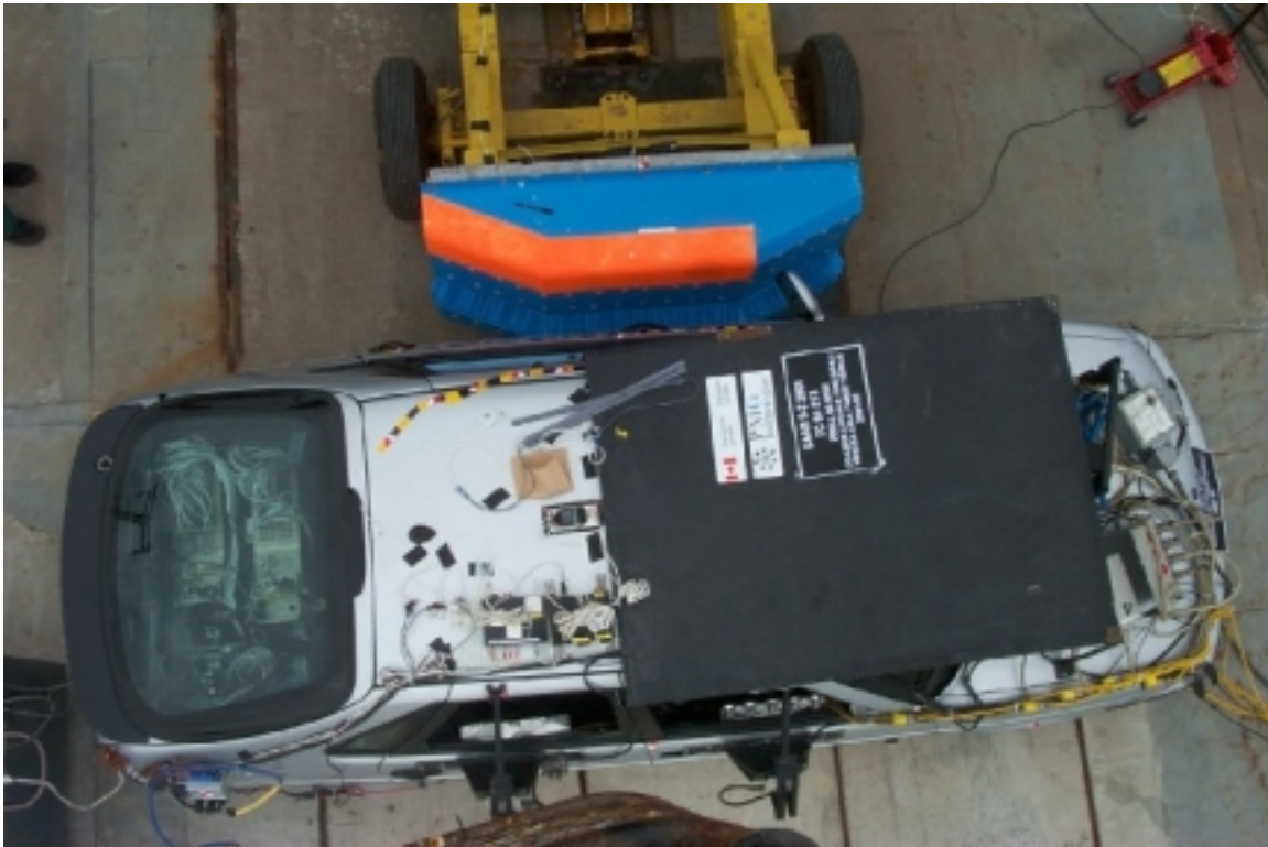
29. Vue de plan des véhicules en contact, avant essai. Top view of vehicles in contact, pre-test.