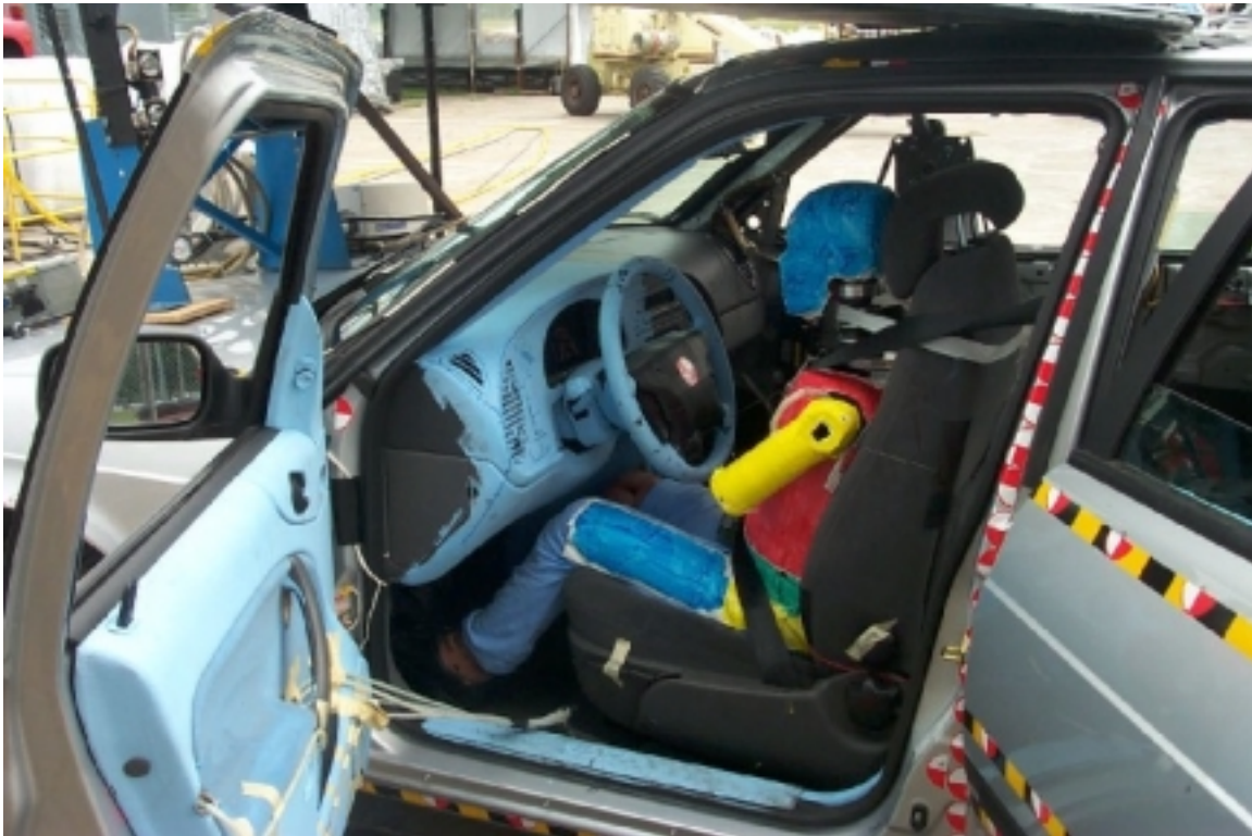
39. Côté gauche du conducteur, véhicule cible, avant essai. Left side of driver, target vehicle, pre-test.