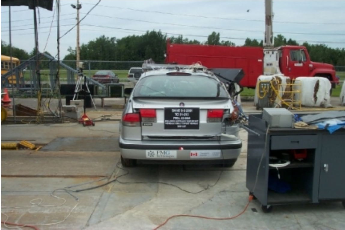
11. Vue générale arrière du véhicule cible, avant essai. General rear view of target vehicle, pre-test.