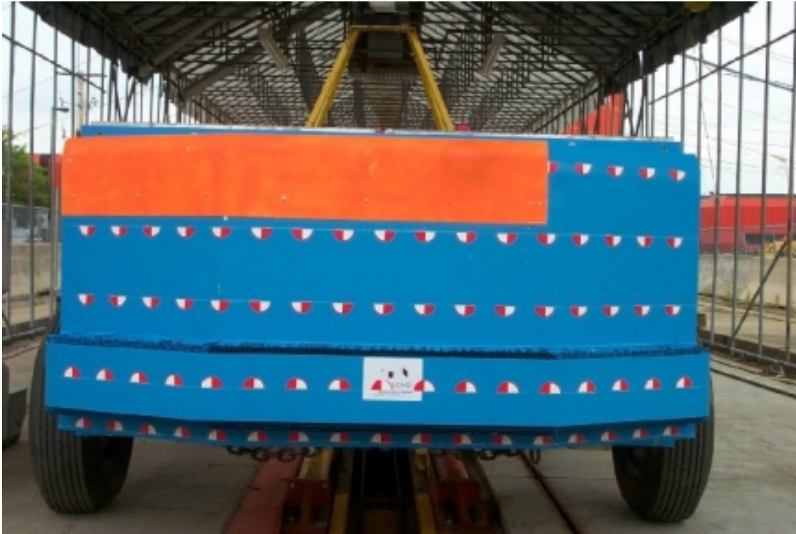
17. Vue de l'avant de la face déformable, avant essai. Front view of the deformable face, pre-test.