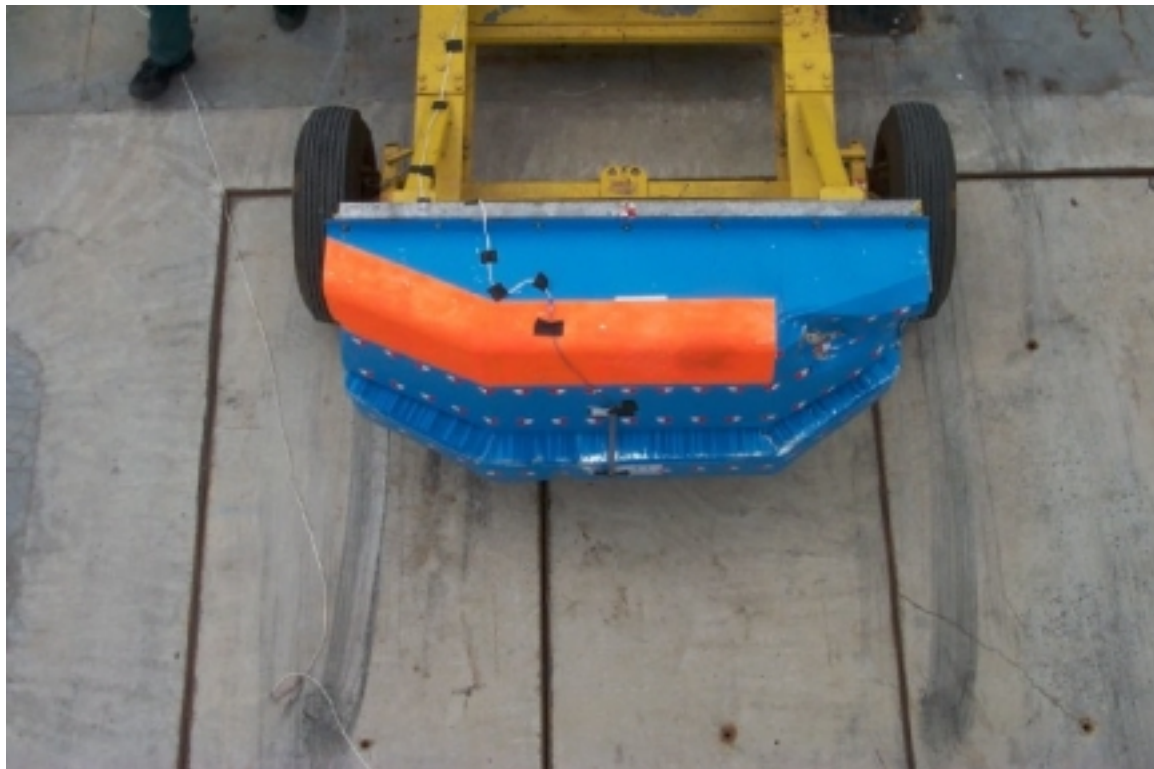
24. Vue de plan de la face déformable, après essai. Overview of the deformable face, post-test.