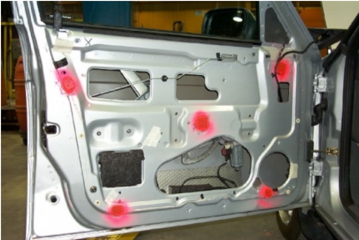
35. Position des accéléromètres dans la porte avant gauche. Position of accelerometers in front left door.