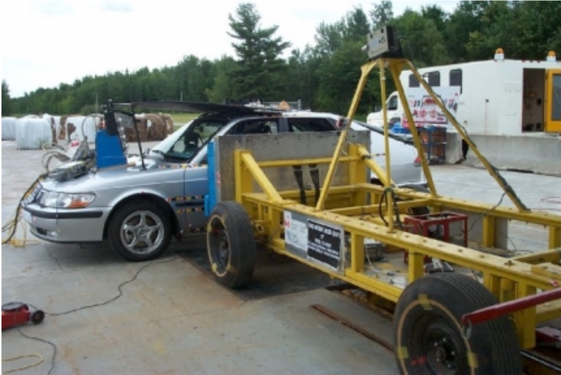
25. Vue ¾ avant des véhicules en contact, avant essai. ¾ front view of vehicles in contact, pre-test.