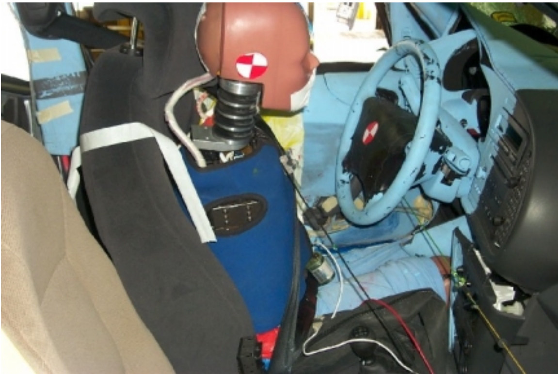
42. Côté droit du conducteur, véhicule cible, après essai. Right side of driver, target vehicle, post-test.