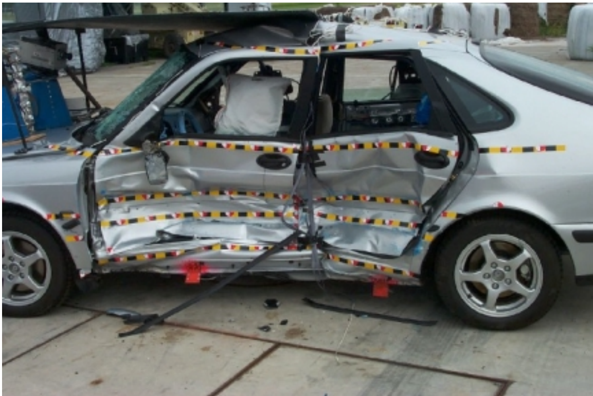
14. Surface ciblée côté gauche du véhicule cible, après essai. Targets on left side of target vehicle, post-test.