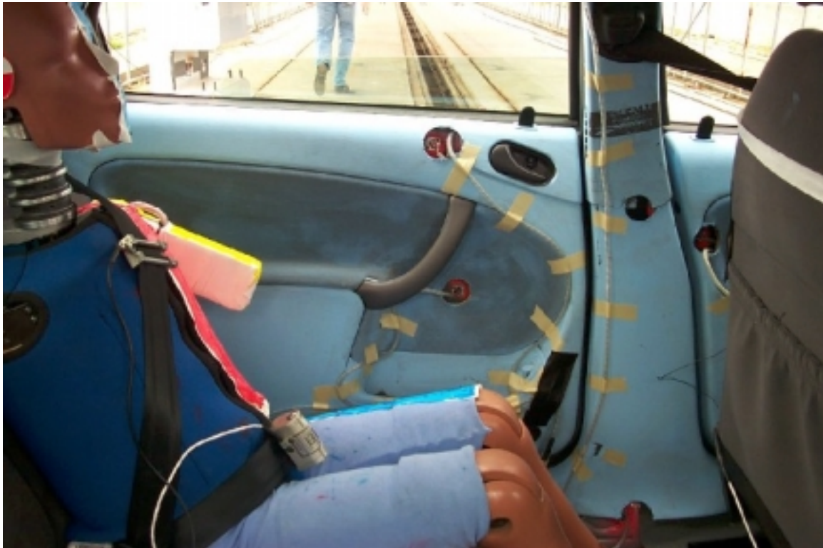
47. Côté droit du passager arrière gauche, véhicule cible, avant essai. Right side of left rear passenger, target vehicle, pre-test.