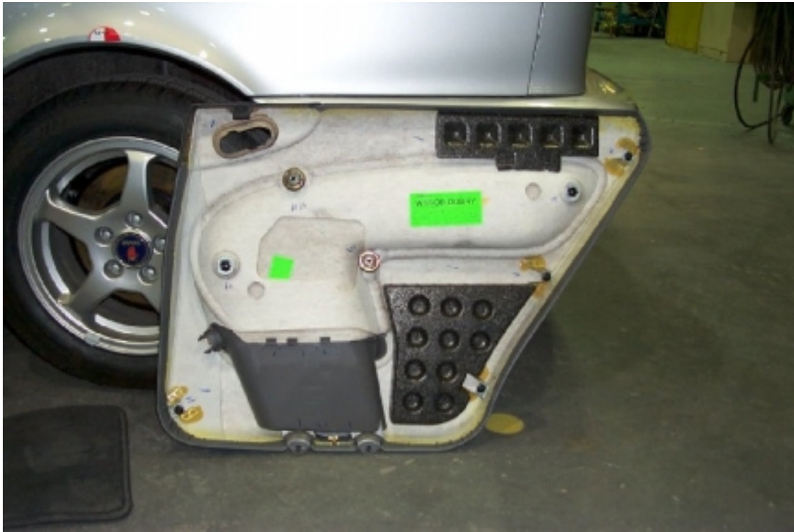
33. Mousse de protection située dans la garniture de la porte arrière gauche. Protective foam located in left rear door trim.