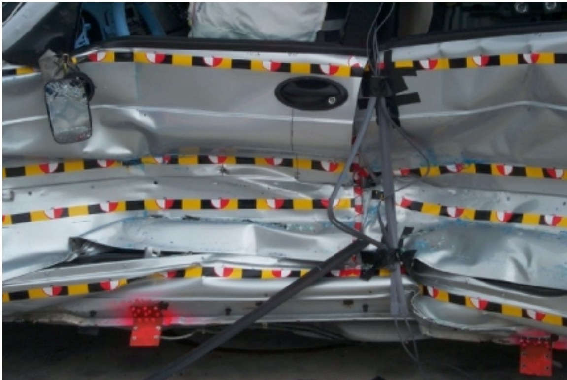
16. Point d'impact sur véhicule cible, après essai. Impact point on target vehicle, post-test.