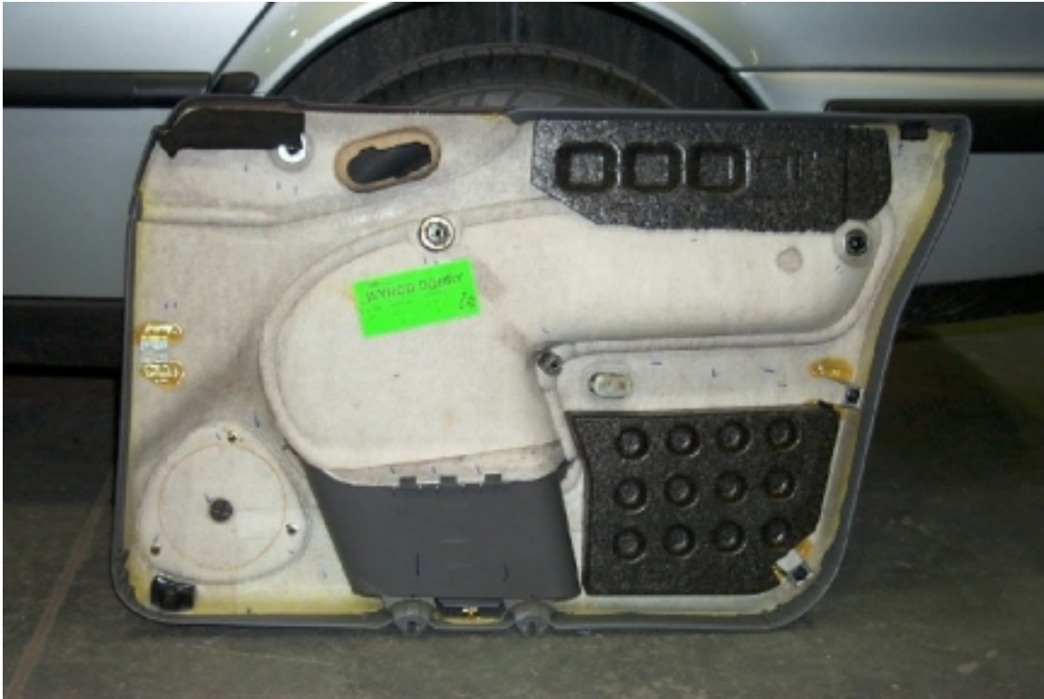
31. Mousse de protection située dans la garniture de la porte avant gauche. Protective foam located in left front door trim.