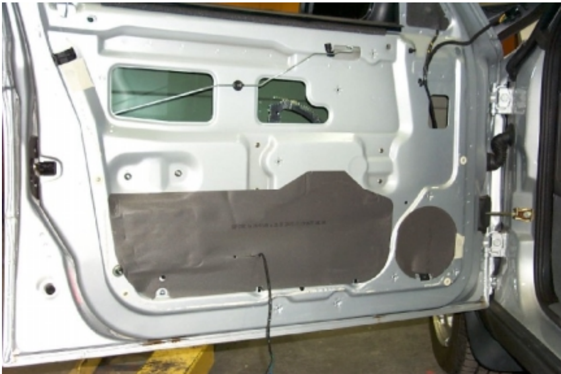
32. Mousse de protection à l'intérieur de la porte avant gauche. Protective foam inside left front door.