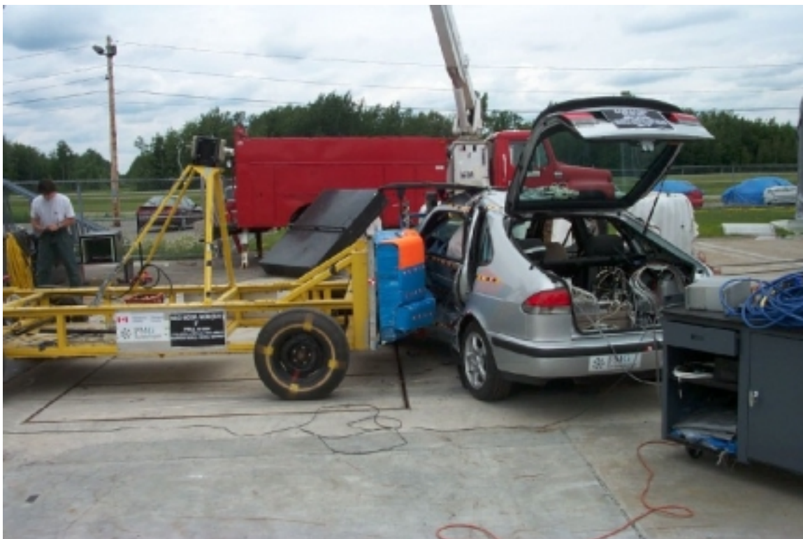
28. Position des véhicules, après essai. Position of vehicles, post-test.