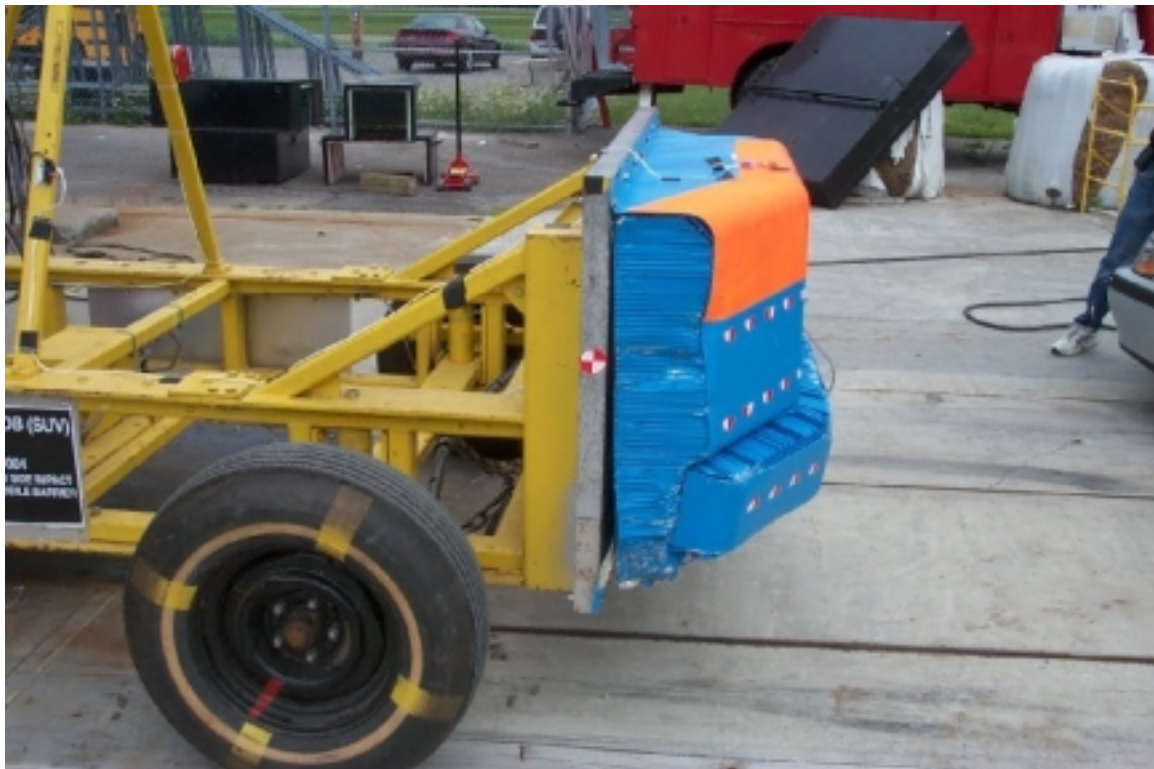
20. Vue du côté gauche de la face déformable, après essai. Left side view of the deformable face, post-test.