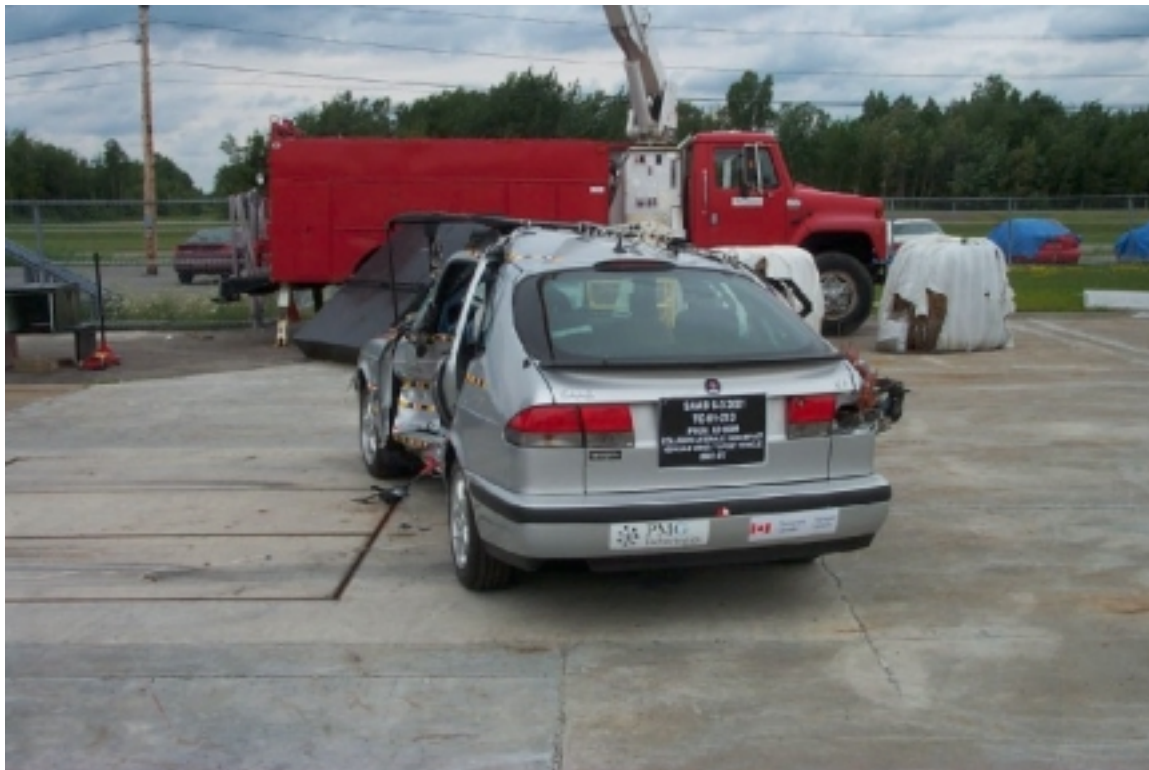
12. Vue générale arrière du véhicule cible, après essai. General rear view of target vehicle, post-test.