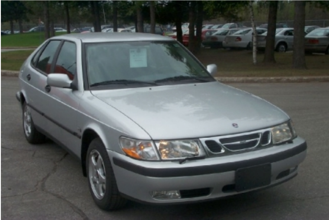
3. Vue ¾ avant du véhicule cible. ¾ front view of target vehicle.