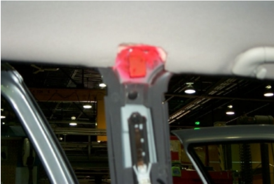
37. Position des accéléromètres sur le pilier "B". Position of accelerometers on "B"pillar.