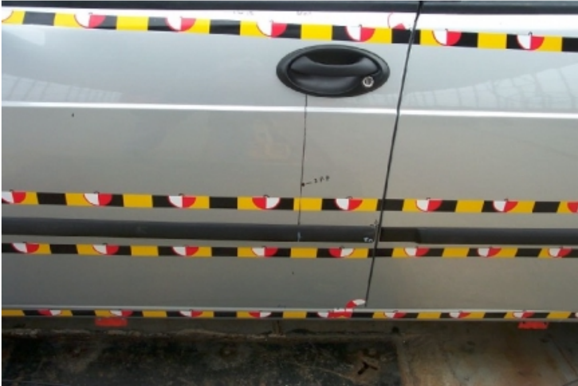
15. Point d'impact sur véhicule cible, avant essai. Impact point on target vehicle, pre-test.