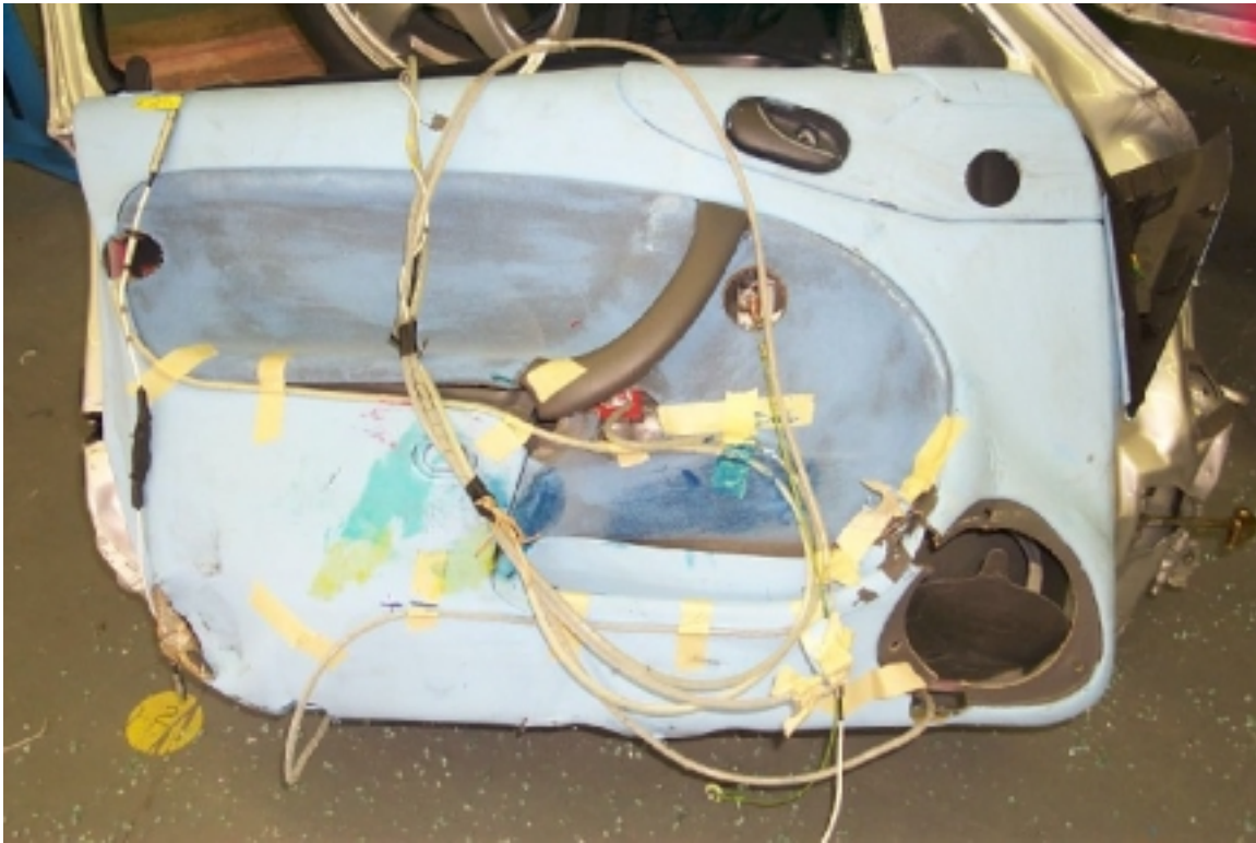
51. Points de contact sur l'intérieur de la portière avant gauche, après essai. Contact points on the inside of the left front door trim, post-test .