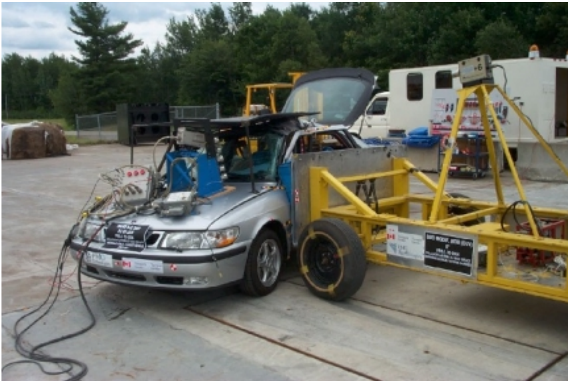
26. Position des véhicules, après essai. Position of vehicles, post-test.