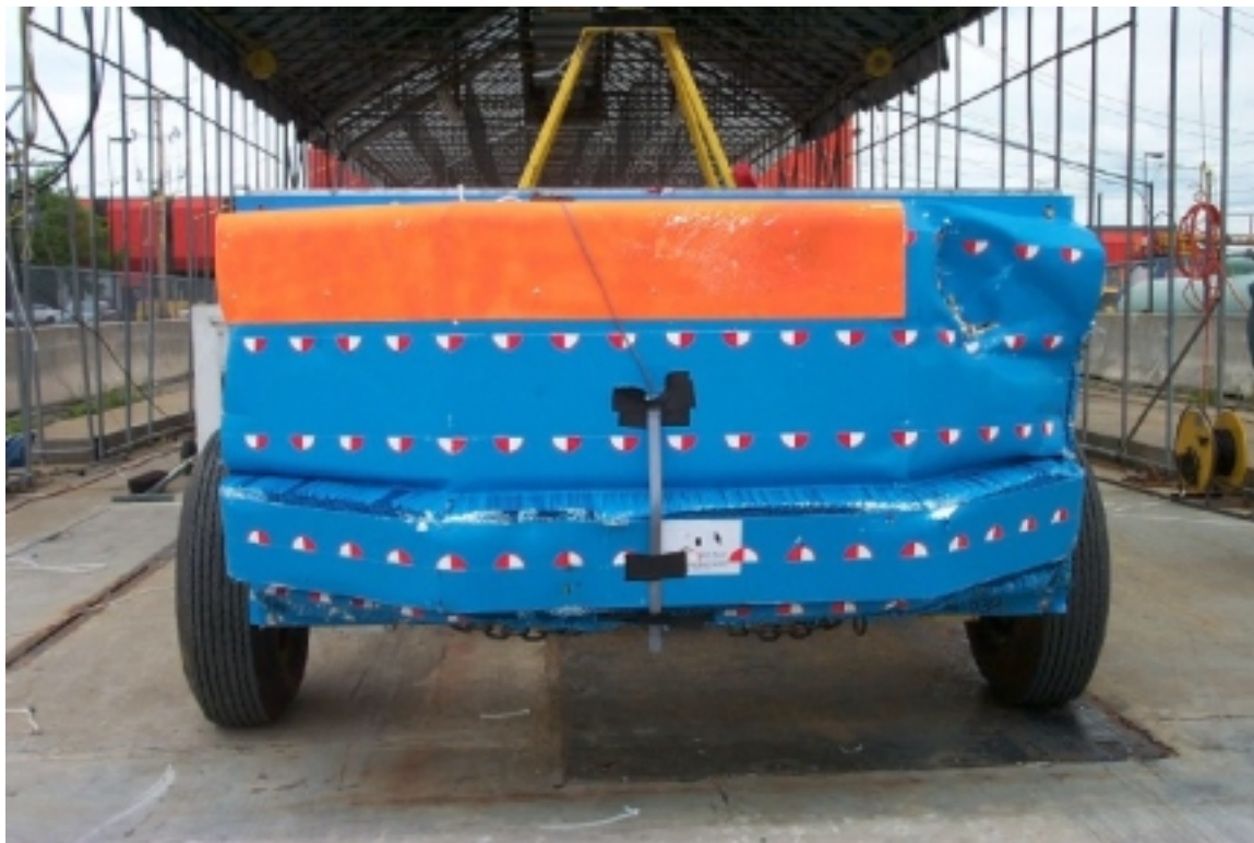
18. Vue de l'avant de la face déformable, après essai. Front view of the deformable face, post-test.