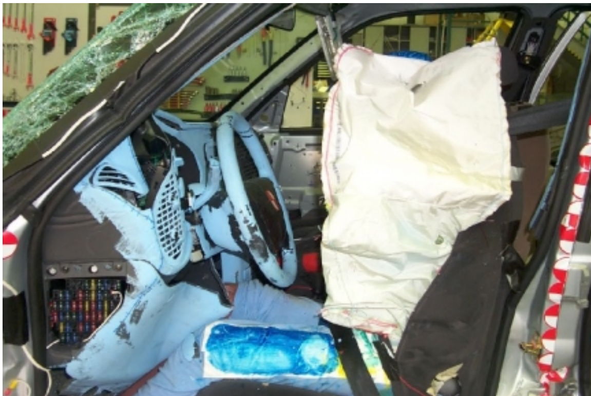
40. Côté gauche du conducteur, véhicule cible, après essai. Left side of driver, target vehicle, post-test.