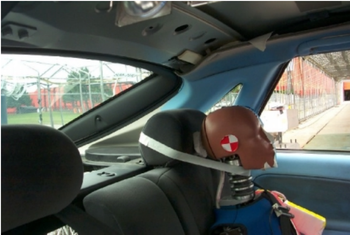
49. Cadre de fenêtre et pilier "C" du côté gauche, véhicule cible, avant essai. Window edge and left side "C" pillar, target vehicle, pre-test.