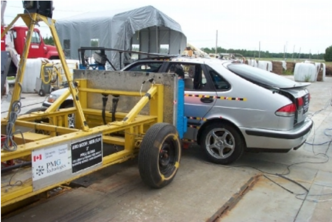
27. Vue ¾ arrière des véhicules en contact, avant essai. ¾ front view of vehicles in contact, pre-test.