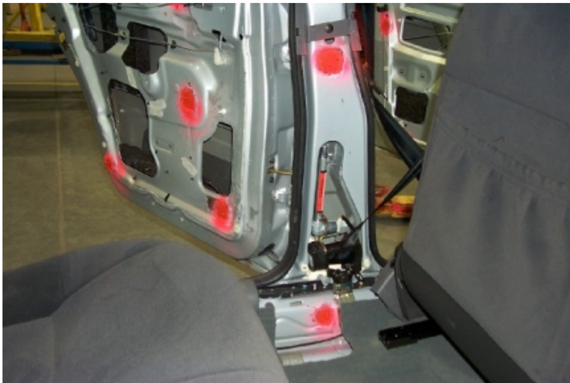
38. Position des accéléromètres sur le pilier "B". Position of accelerometers on "B"pillar.