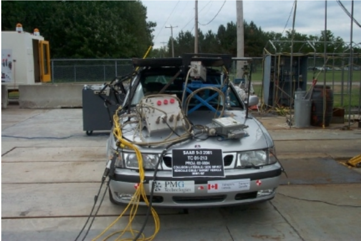
9. Vue générale avant du véhicule cible, avant essai. General front view of target vehicle, pre-test.