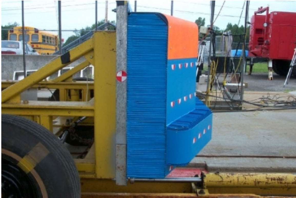
19. Vue du côté gauche de la face déformable, avant essai. Left side view of the deformable face, pre-test.