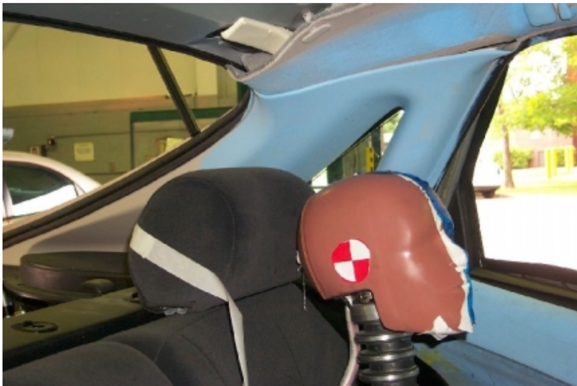
50. Cadre de fenêtre et pilier "C" du côté gauche, véhicule cible, après essai. Window edge and left side "C" pillar, target vehicle, post-test.