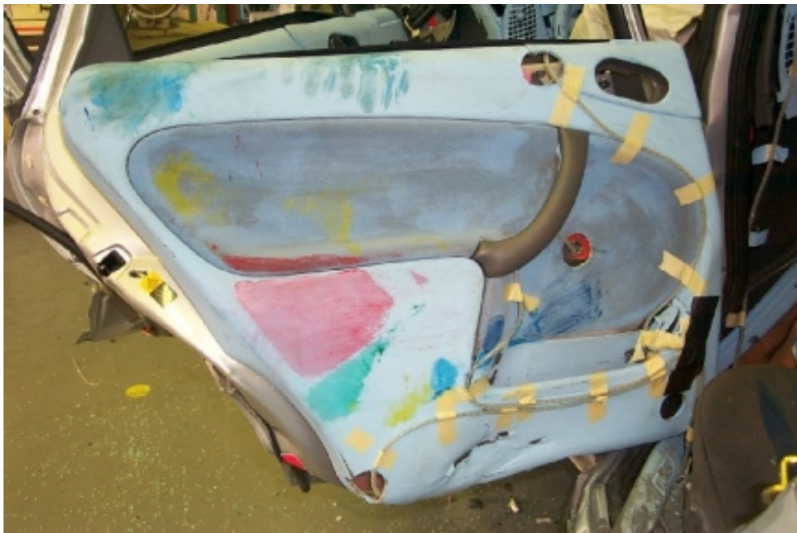
52. Points de contact sur l'intérieur de la portière arrière gauche, après essai. Contact points on the inside of the left rear door trim, post-test .