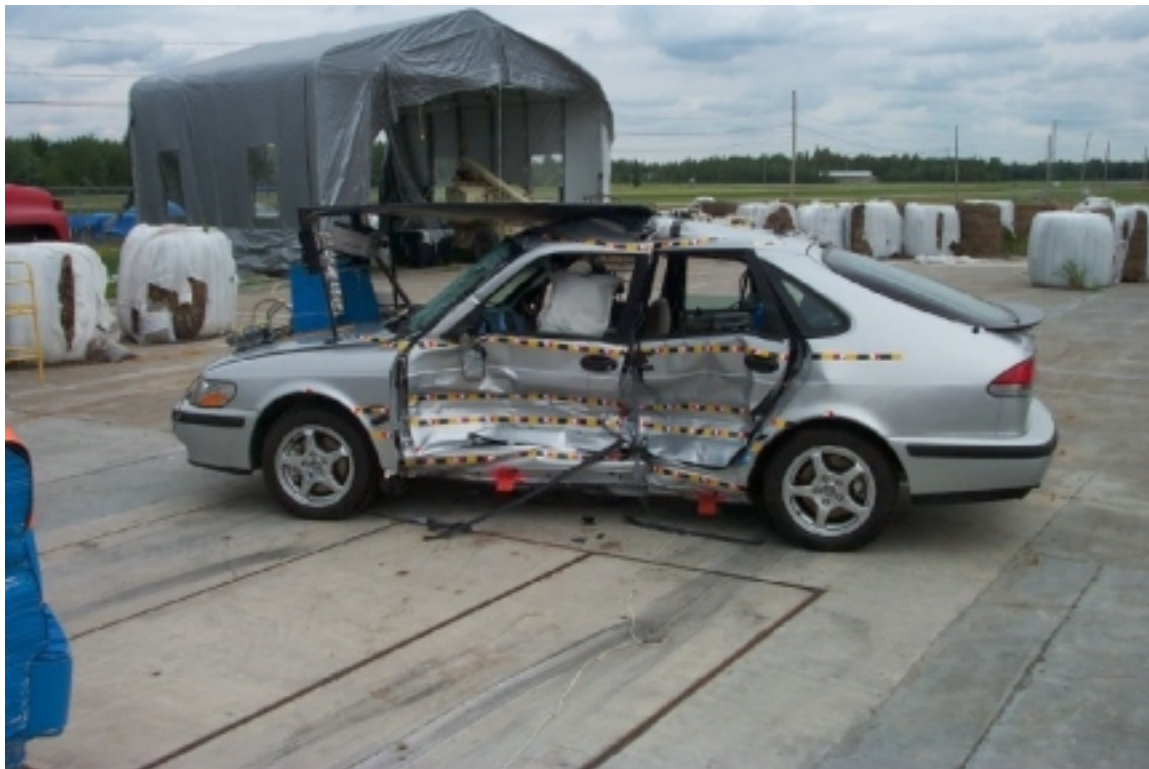
8. Vue générale côté gauche du véhicule cible, après essai. General left side view of target vehicle, post-test.