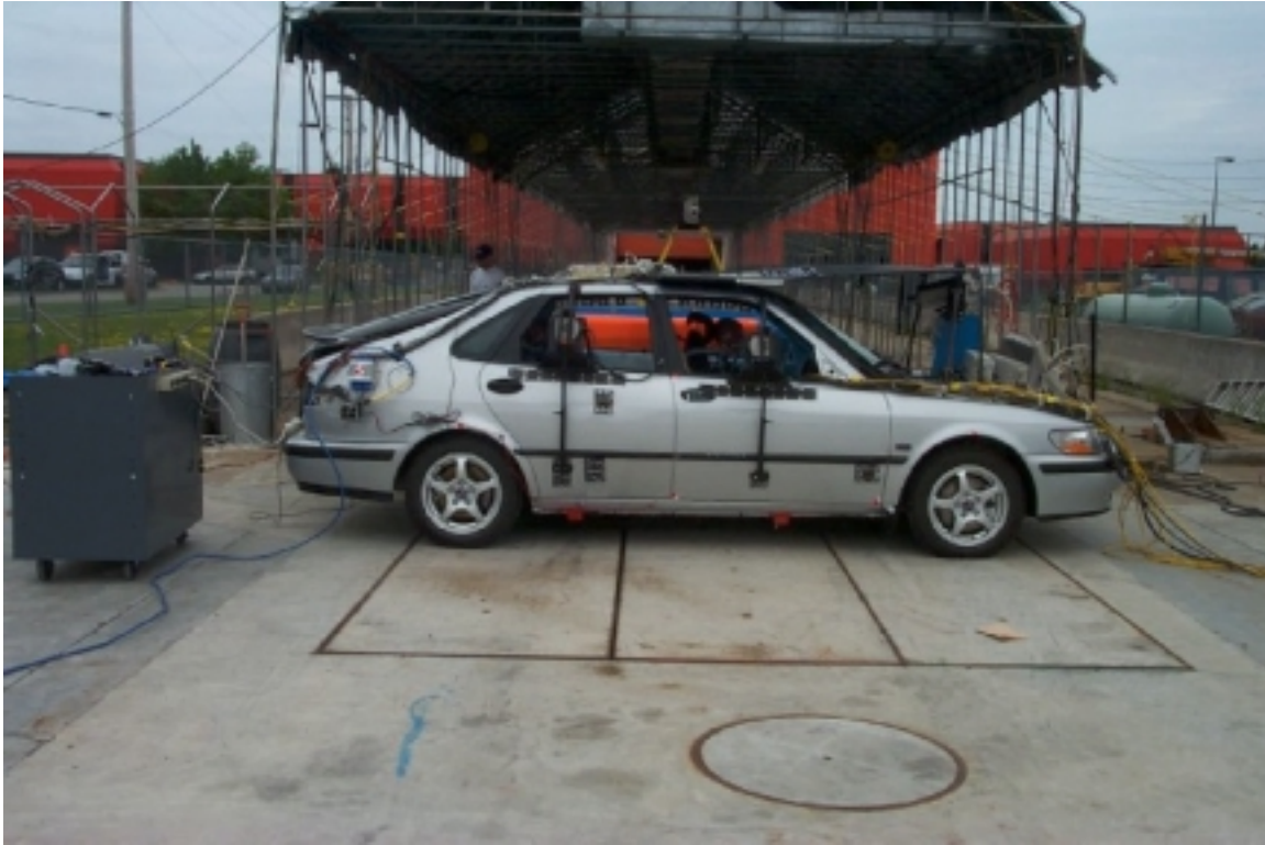
5. Vue générale côté droit du véhicule cible, avant essai. General right side view of target vehicle, pre-test.