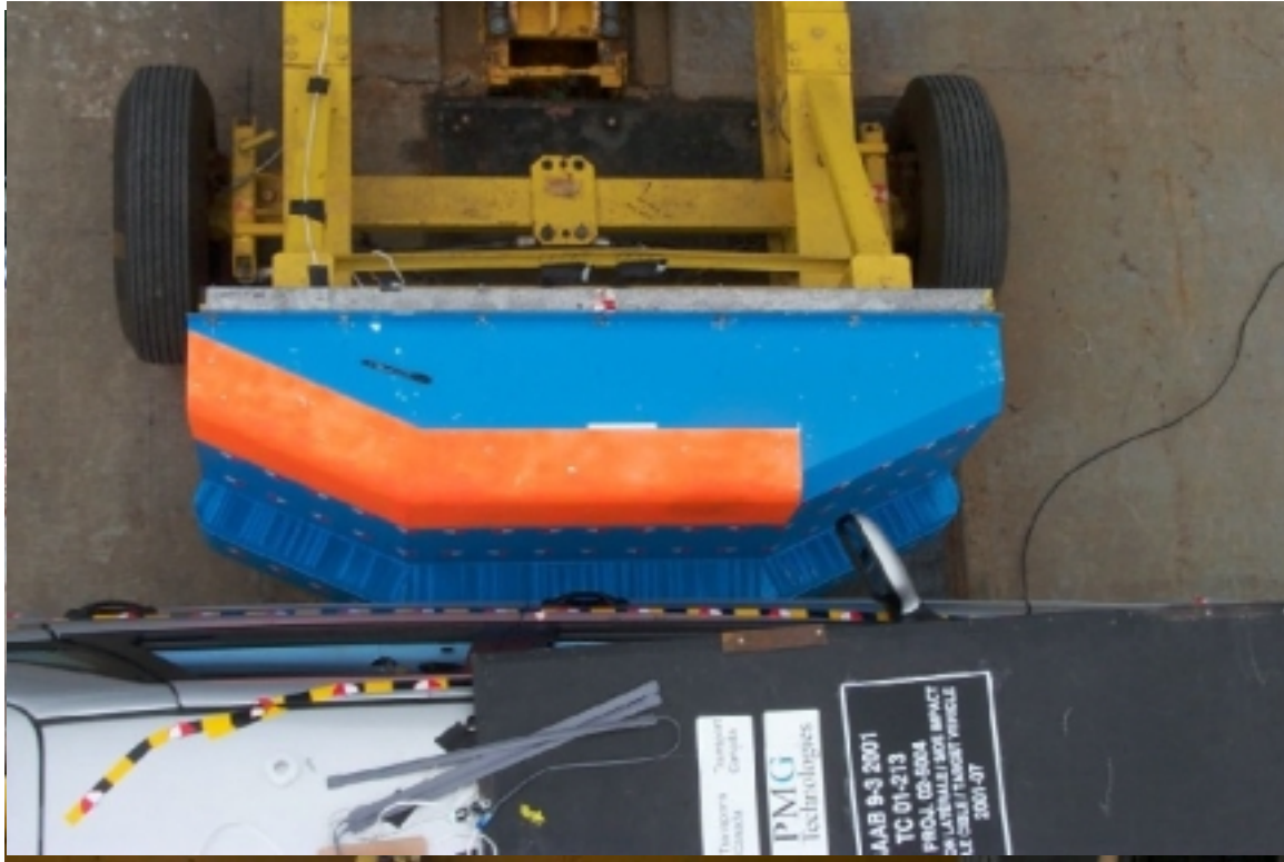
23. Vue de plan de la face déformable, avant essai. Overview of the deformable face, pre-test.