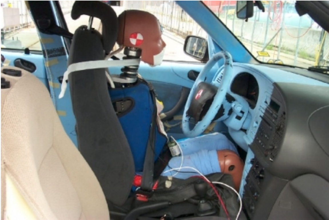
41. Côté droit du conducteur, véhicule cible, avant essai. Right side of driver, target vehicle, pre-test.