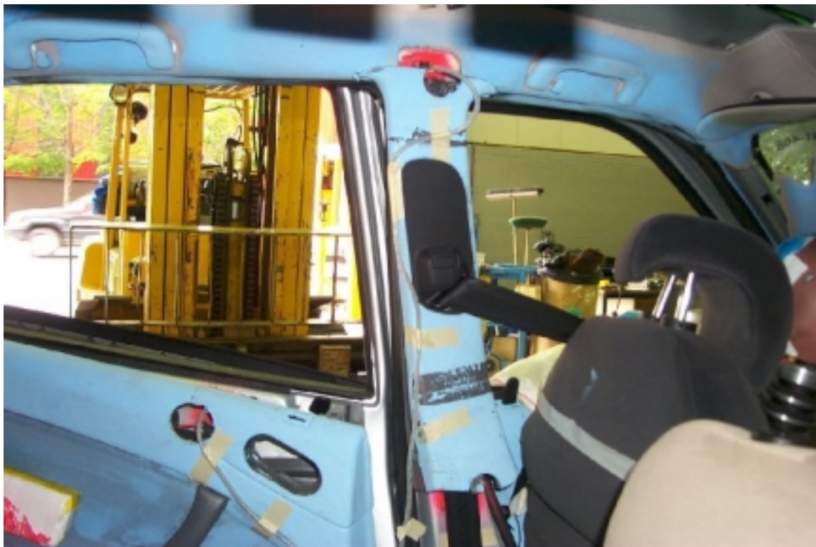
44. Pilier "B" du côté gauche, véhicule cible, après essai. Left side "B" pillar, target vehicle, post-test.