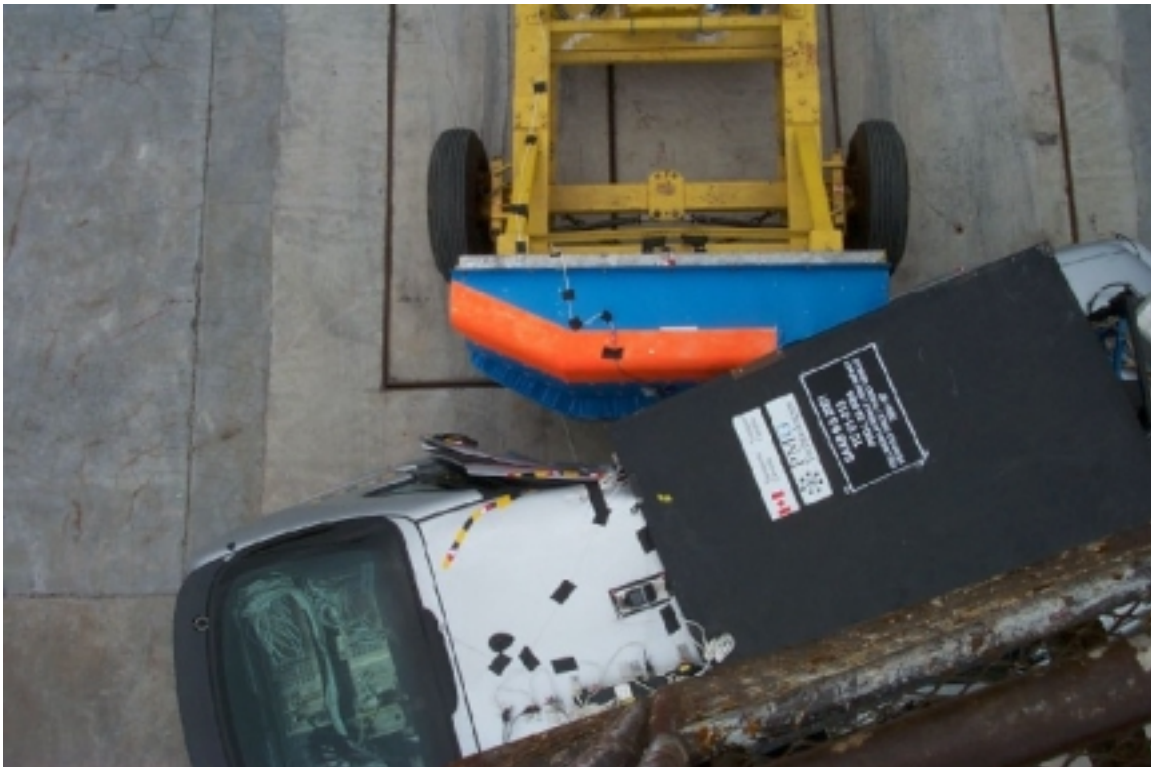
30. Vue de plan des véhicules en contact, après essai. Top view of vehicles in contact, post-test.