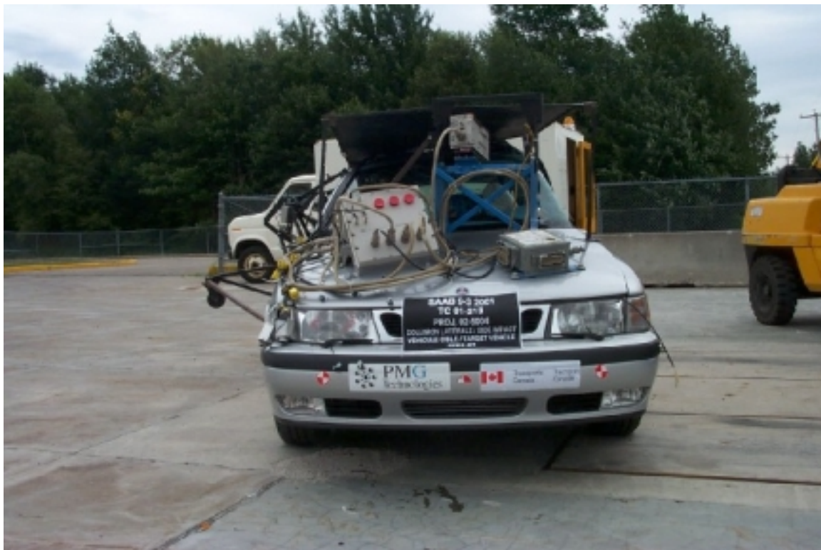
10. Vue générale avant du véhicule cible, après essai. General front view of target vehicle, post-test.