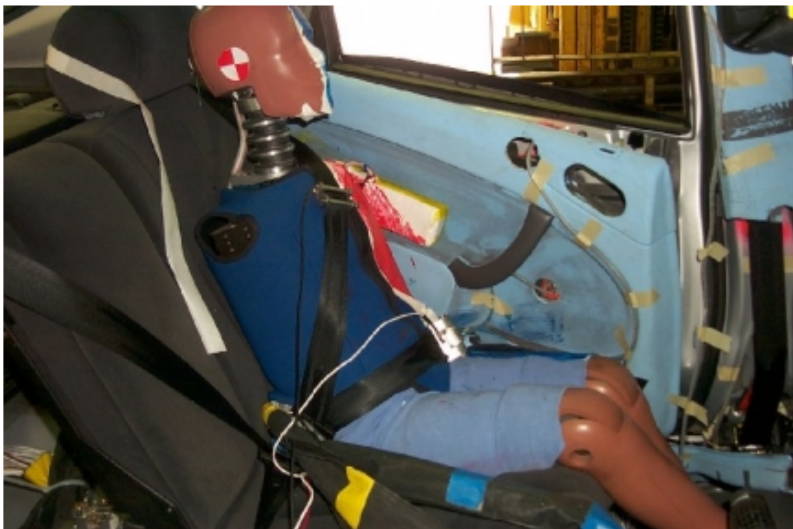
48. Côté droit du passager arrière gauche, véhicule cible, après essai. Right side of left rear passenger, target vehicle, post-test.