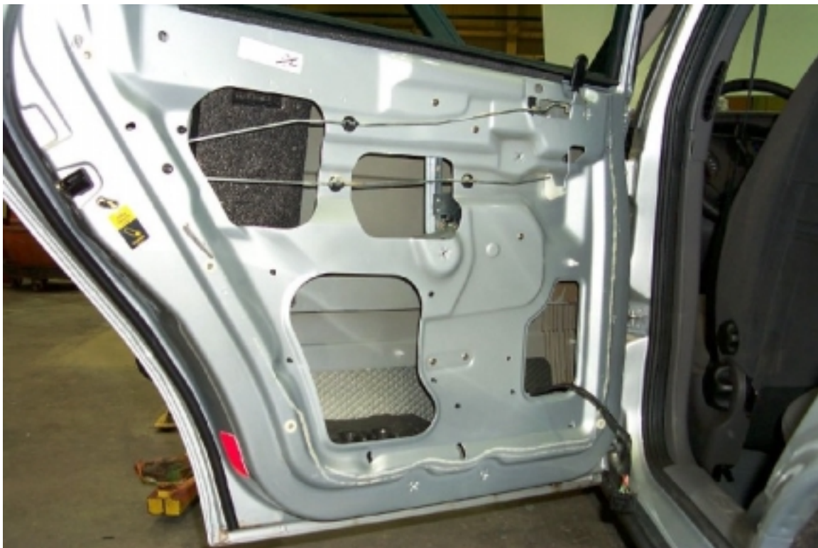
34. Mousse de protection à l'intérieur de la porte arrière gauche. Protective foam inside left rear door.