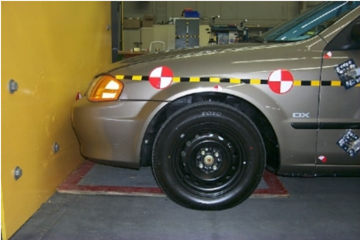
17. Vue côté gauche de l'avant du véhicule d'essai, avant essai. Left side view of front of test vehicle, pre-test.