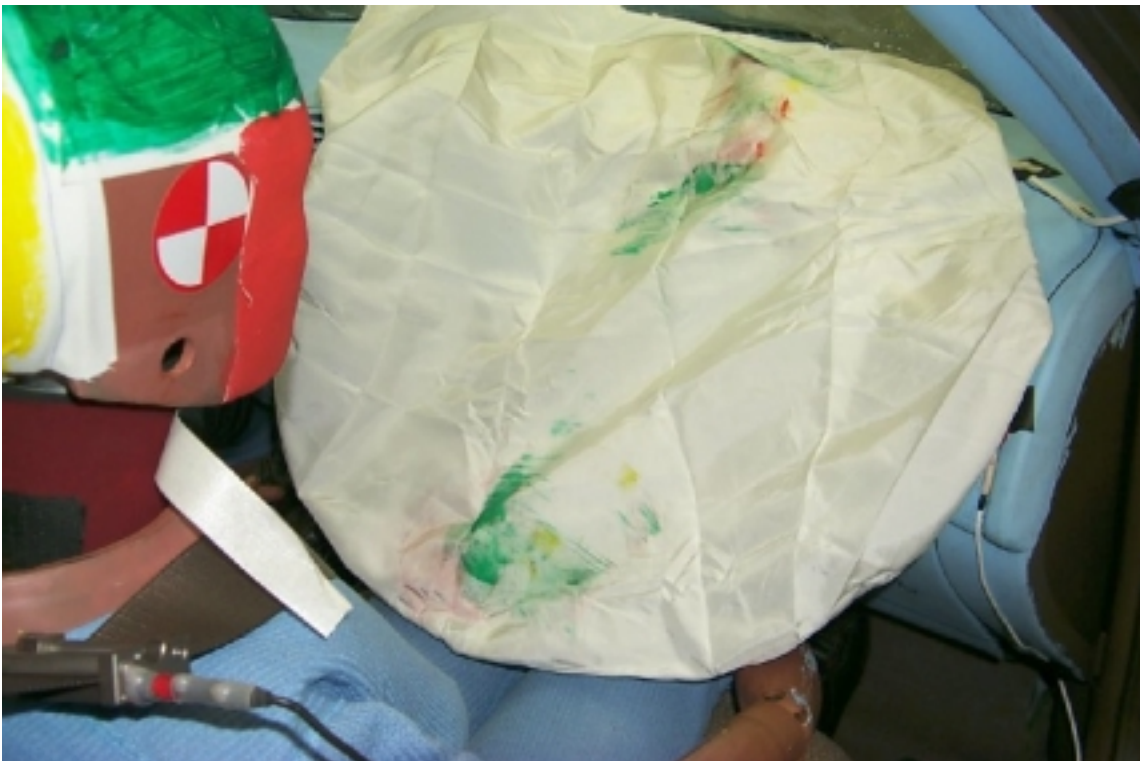
33. Point de contact de tête du passager, après essai. Passenger's head contact point, post-test.