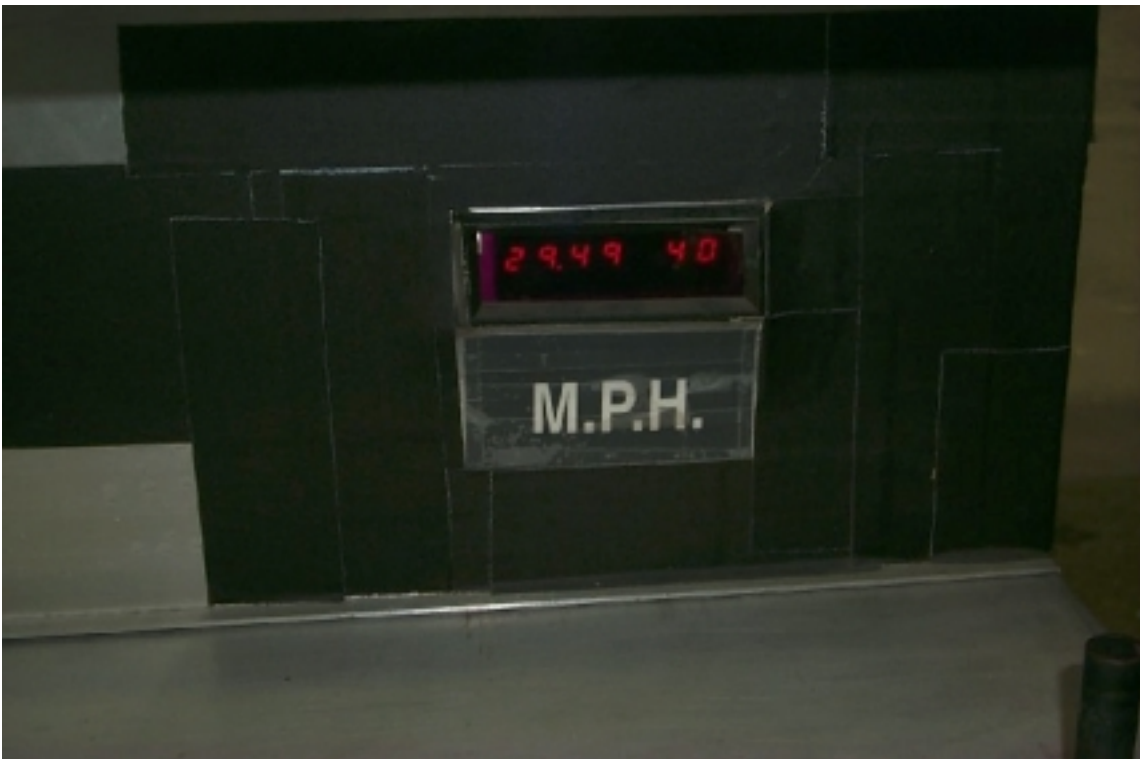
35. Affichage du lecteur de vitesse. Speed trap reading.