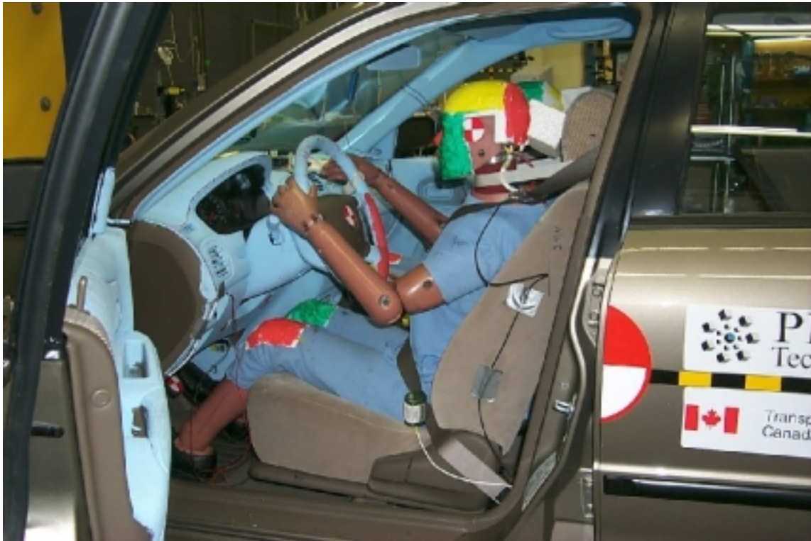
25. Position du conducteur, avant essai. Driver's position, pre-test.