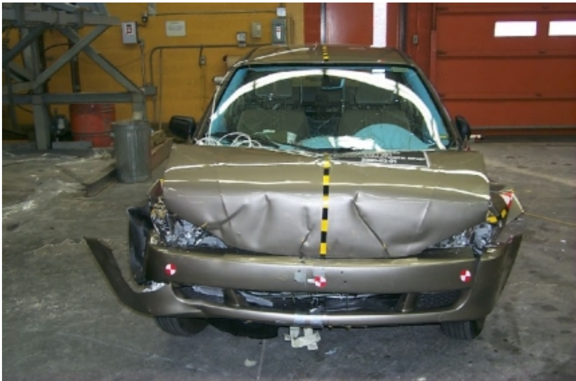
12. Vue avant du véhicule d'essai, après essai. Front view of the test vehicle, post-test.