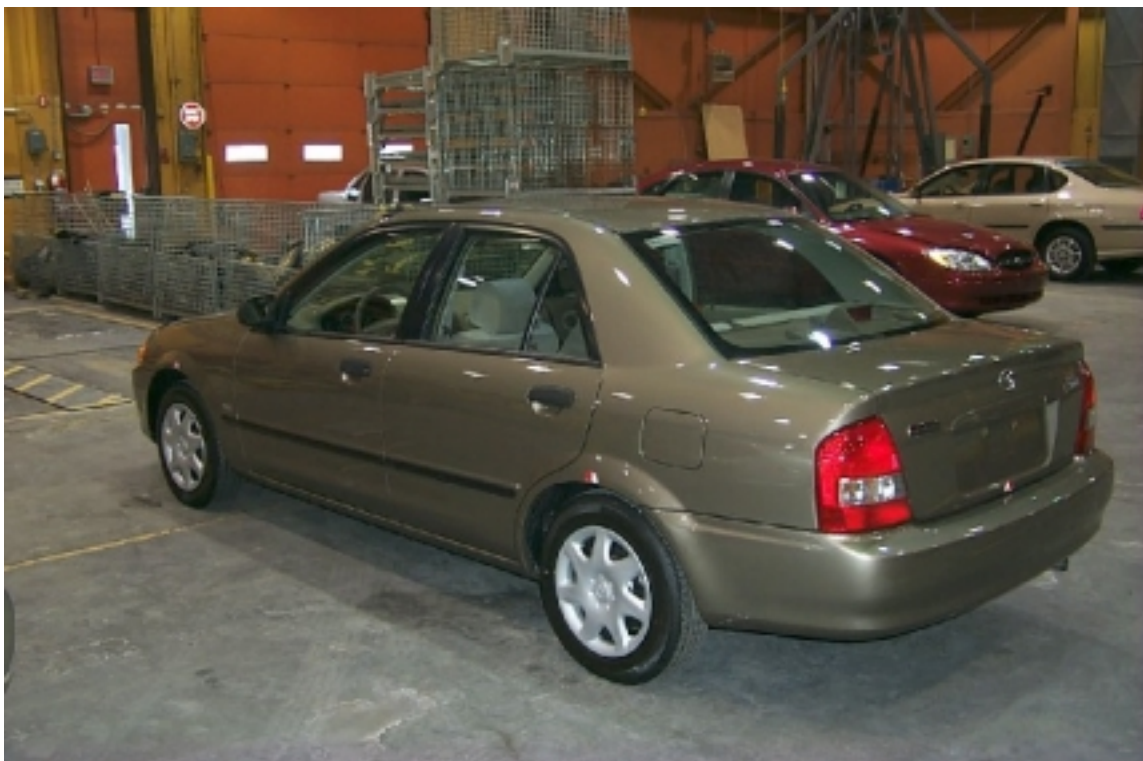
4. Vue \frac{3}{4} arrière du véhicule d'essai. \frac{3}{4} rear view of the test vehicle.