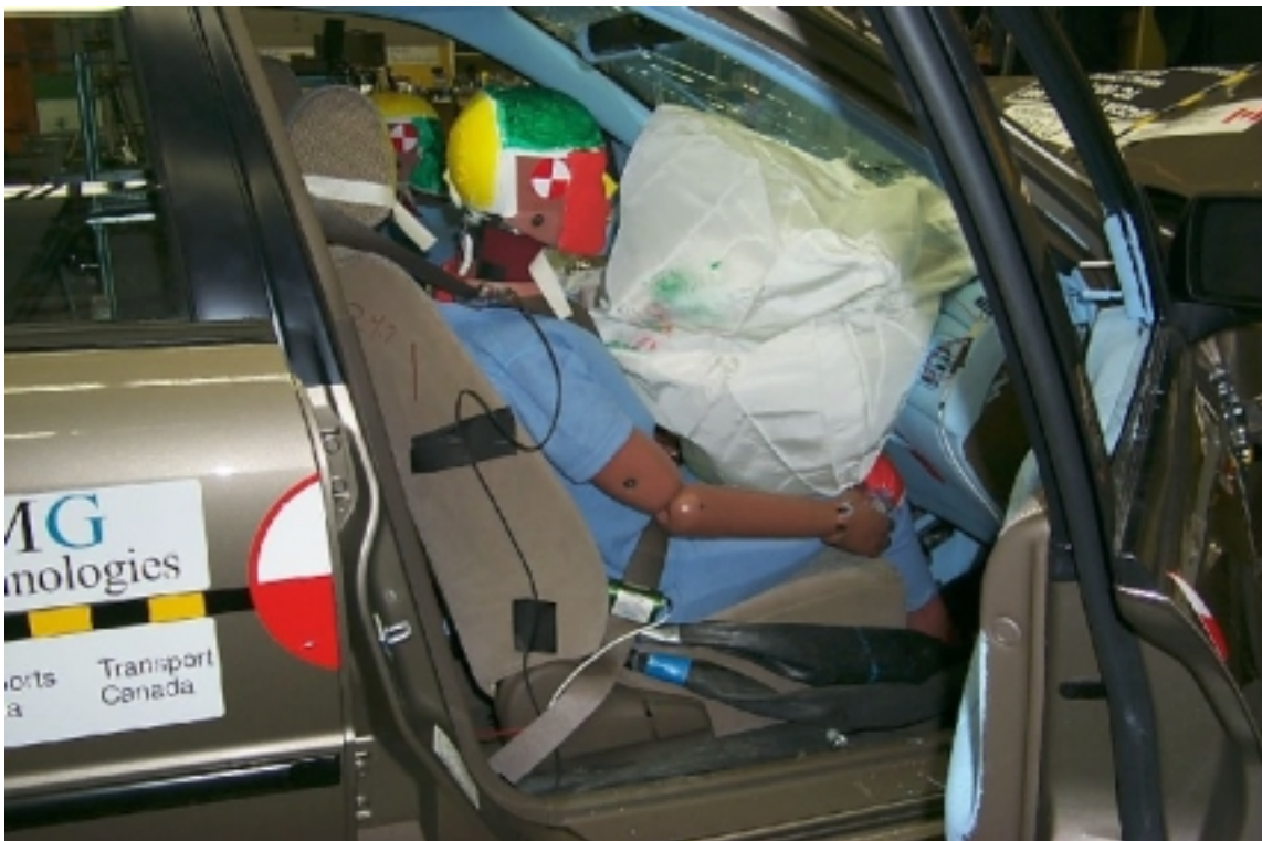
31. Position du passager, après essai. Passenger's position, post-test.