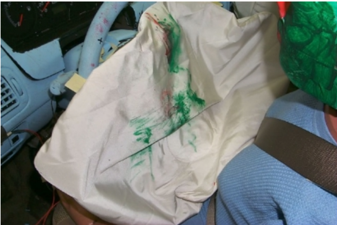
28. Point de contact de tête du conducteur, après essai. Driver's head contact point, post-test.