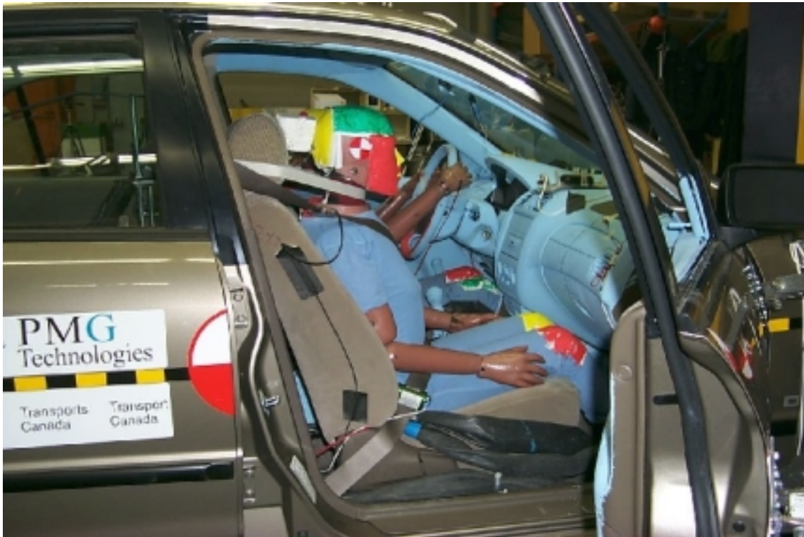
30. Position du passager, avant essai. Passenger's position, pre-test.