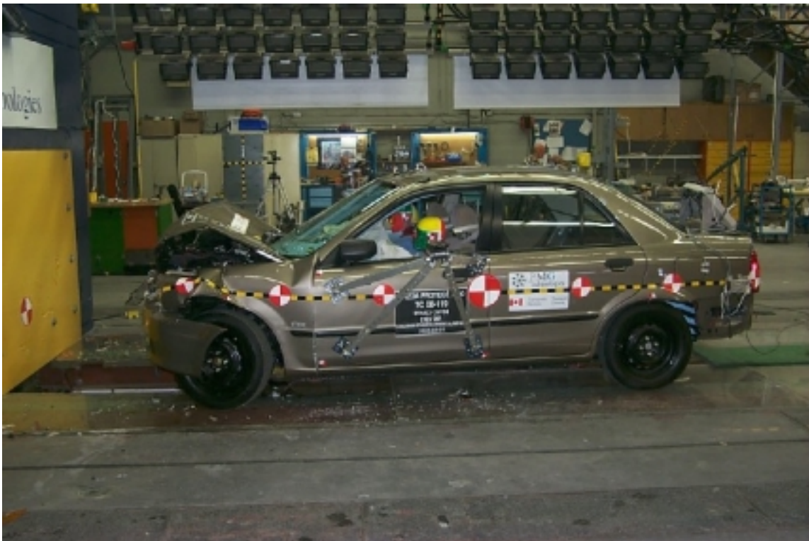
6. Vue générale côté gauche du véhicule d'essai, après essai. Left side view of the test vehicle, post-test.