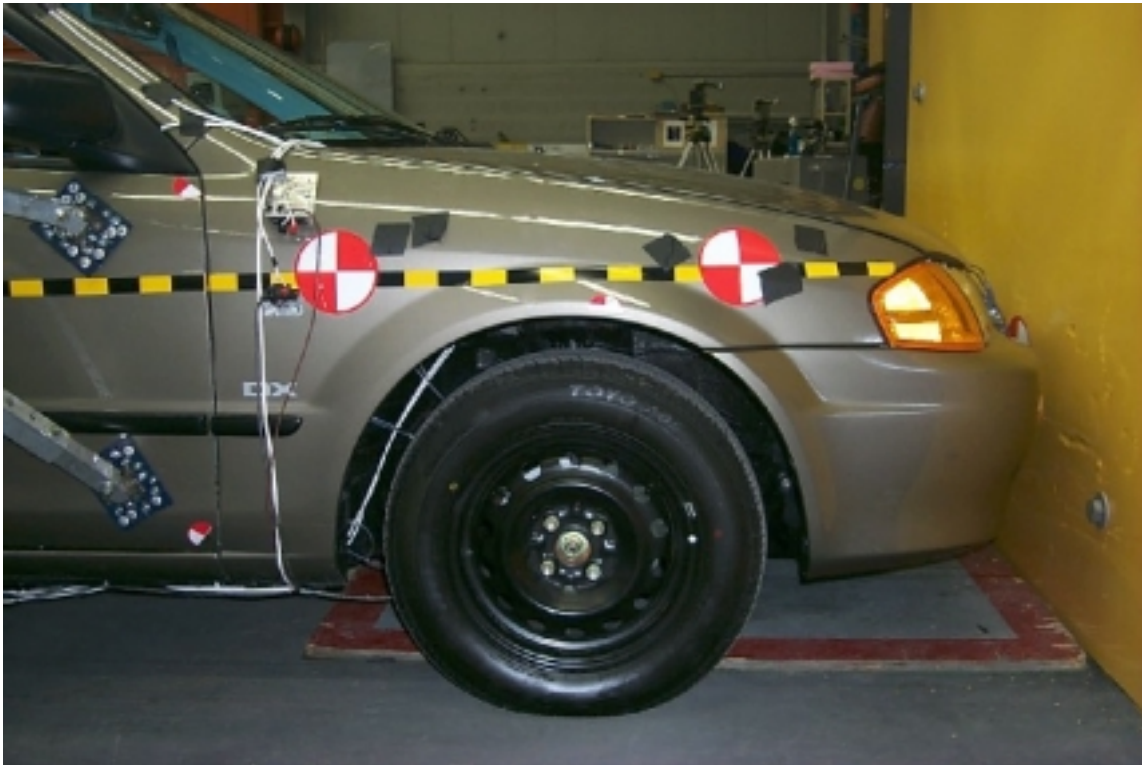
19. Vue côté droit de l'avant du véhicule d'essai, avant essai. Right side view of front of test vehicle, pre-test.