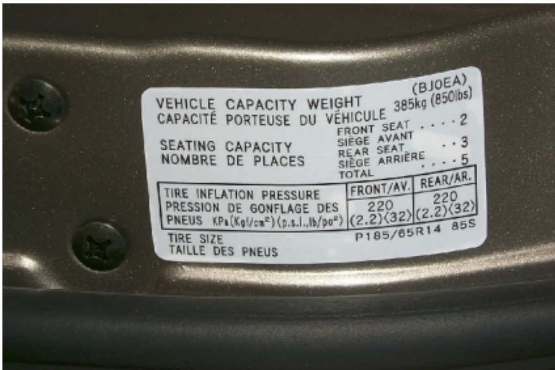
2. Étiquette d'information des pneus. Tire information label.