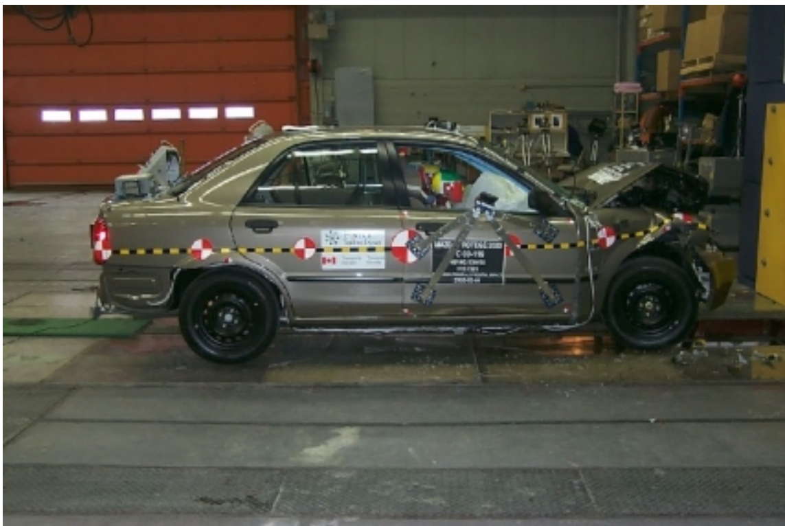
10. Vue générale côté droit du véhicule d'essai, après essai. General right side view of the test vehicle, post-test.