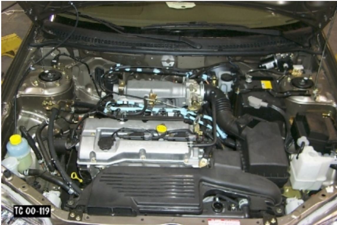
21. Vue du compartiment moteur du véhicule d'essai, avant essai. Engine compartment view of the test vehicle, pre-test.