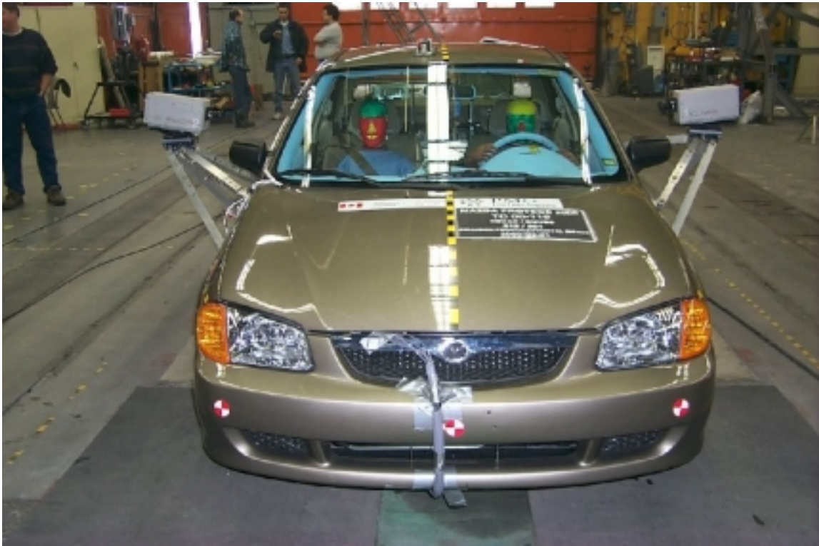
11. Vue avant du véhicule d'essai, avant essai. Front view of the test vehicle, pre-test.