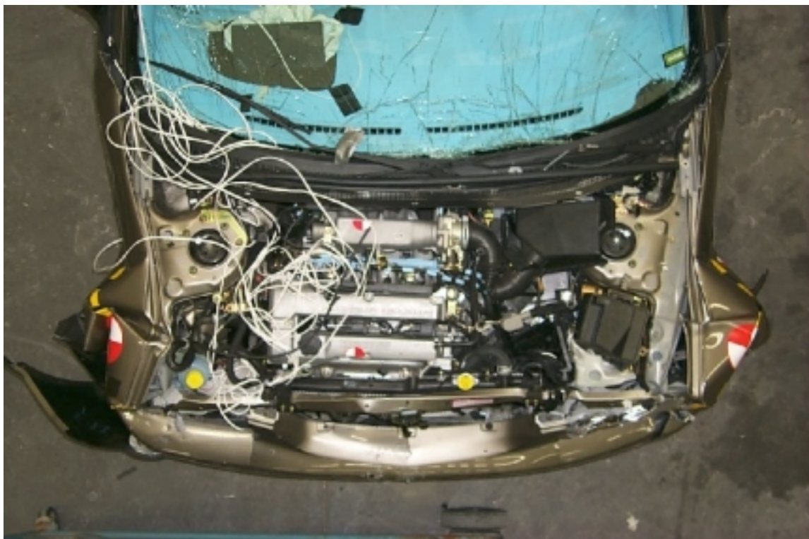
22. Vue du compartiment moteur du véhicule d'essai, après essai. Engine compartment view of the test vehicle, post-test.