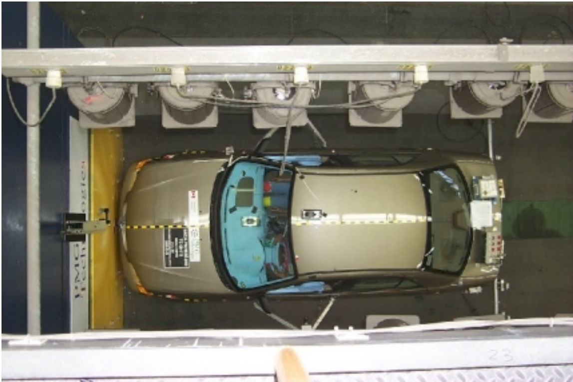
13. Vue de plan du véhicule d'essai, avant essai. Overview of the test vehicle, pre-test.