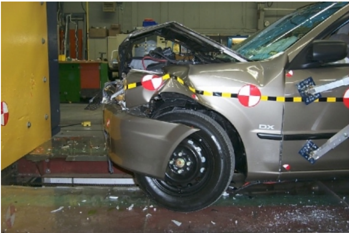
18. Vue côté gauche de l'avant du véhicule d'essai, après essai. Left side view of front of test vehicle, post-test.