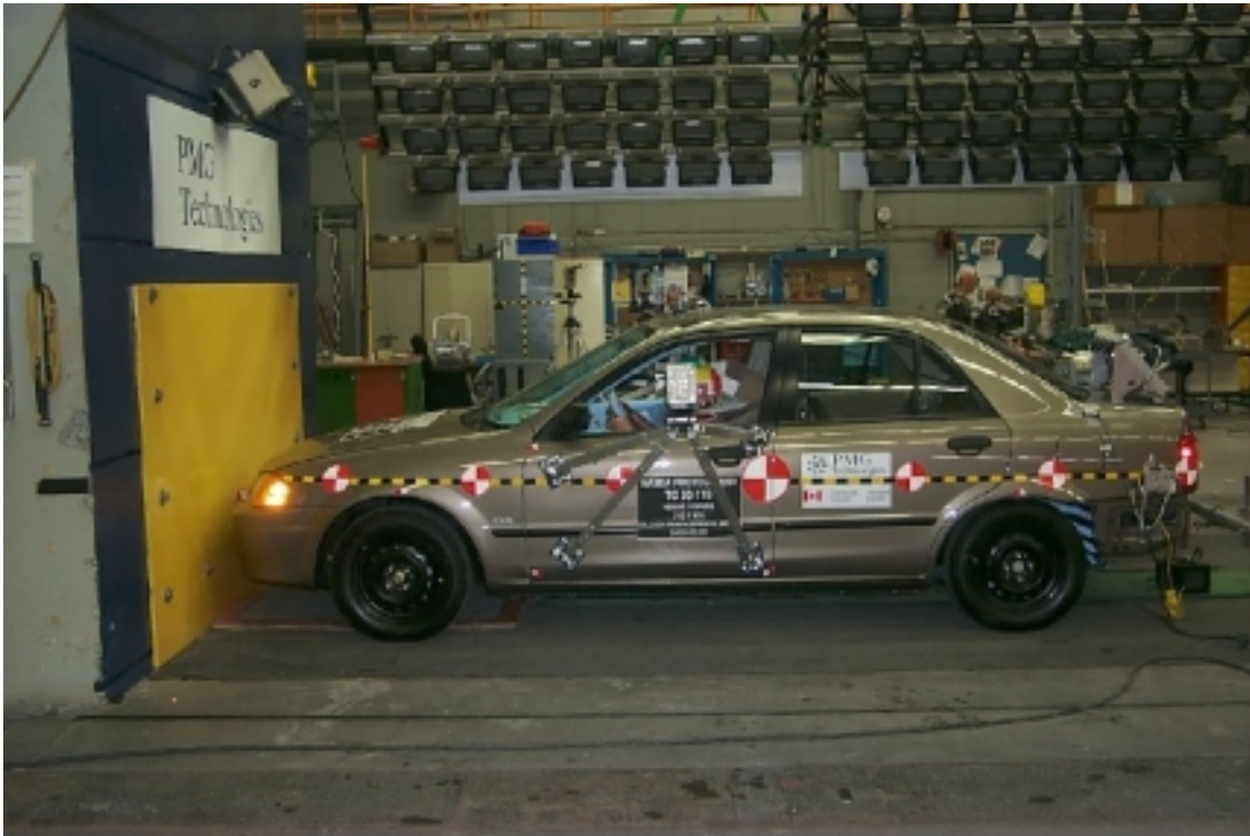
5. Vue générale côté gauche du véhicule d'essai, avant essai. Left side view of the test vehicle, pre-test.