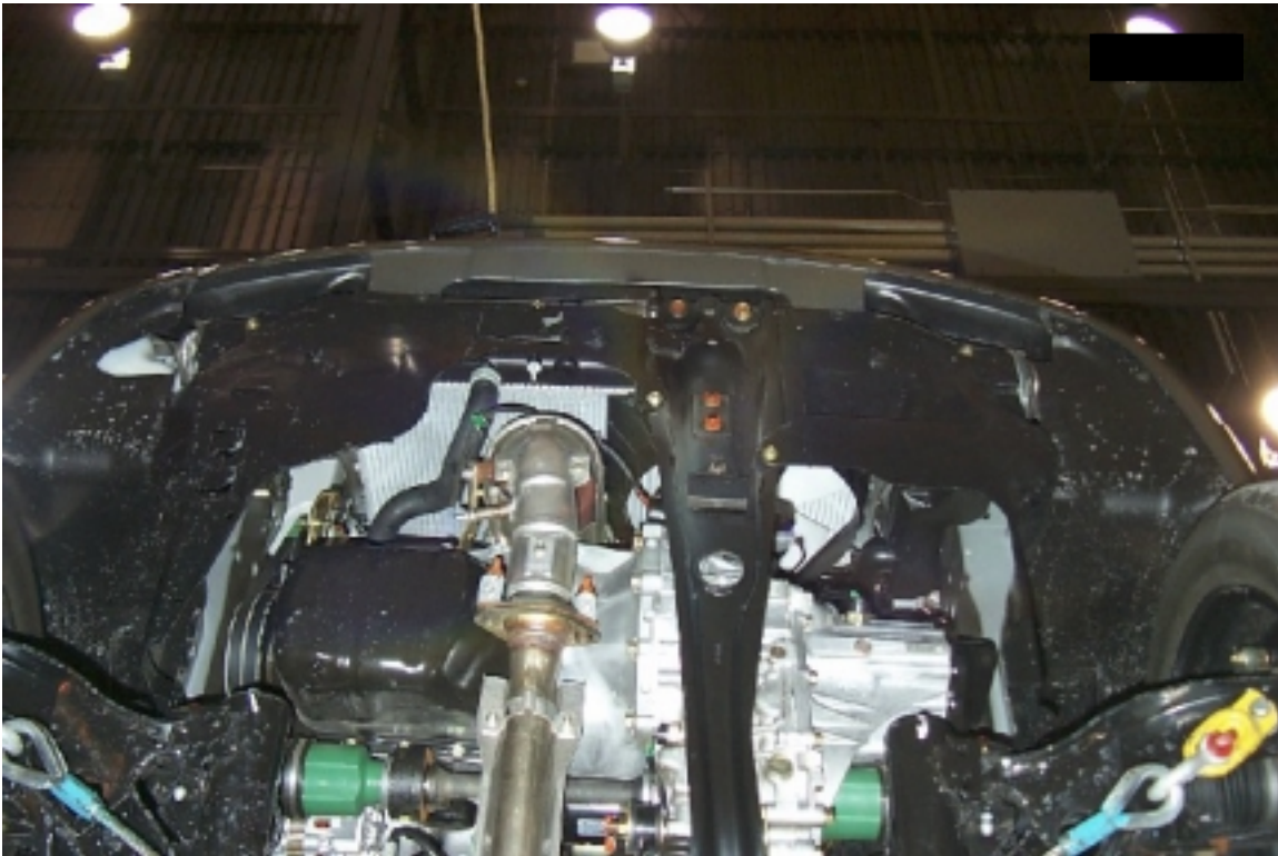
23. Vue du dessous du compartiment moteur, avant essai. Under view of the engine compartment, pre-test.