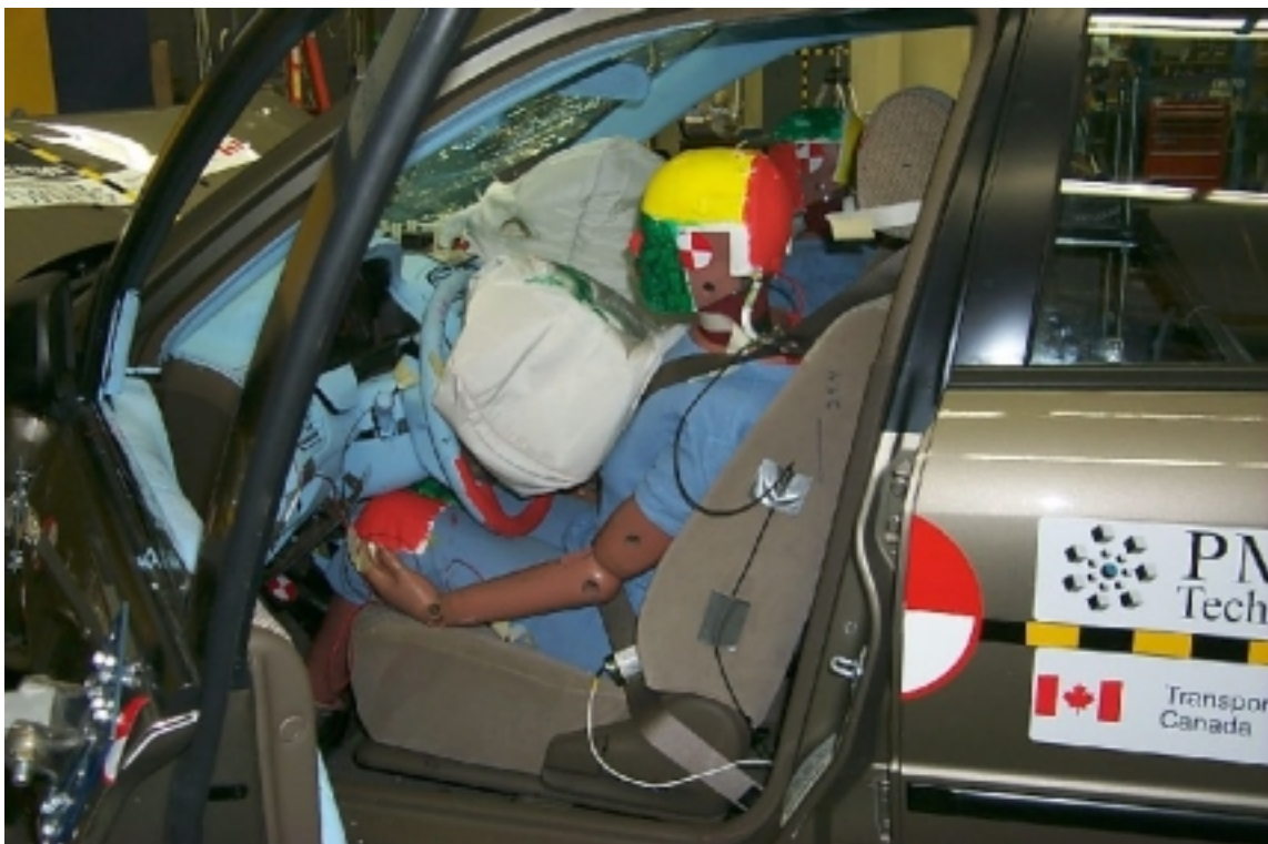
26. Position du conducteur, après essai. Driver's position, post-test.