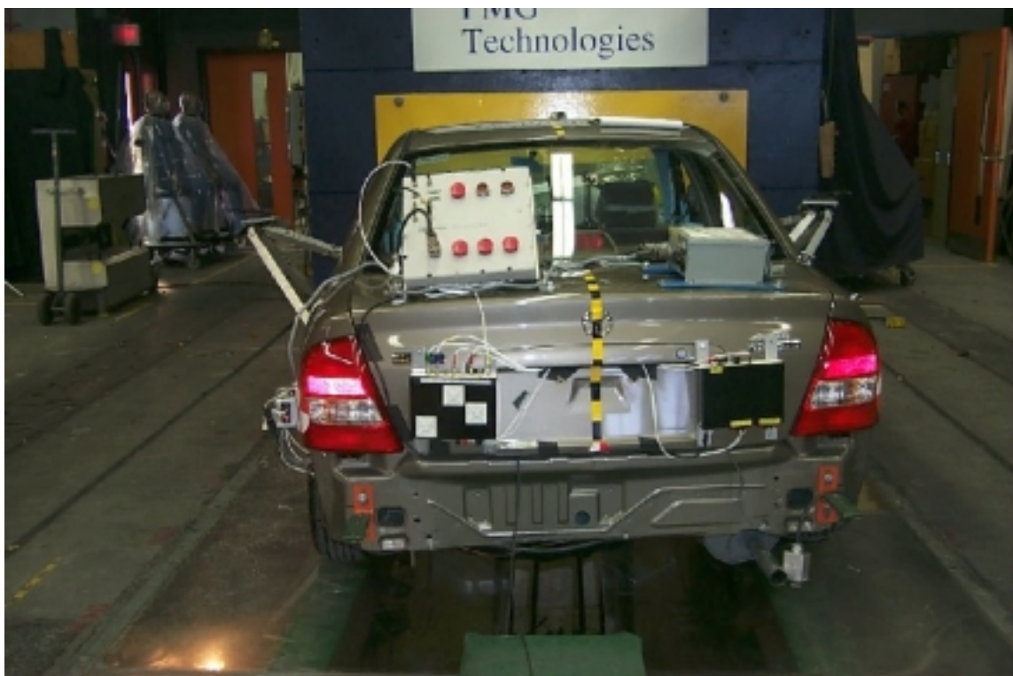
8. Vue arrière du véhicule d'essai, après essai. Rear view of the test vehicle, post-test.