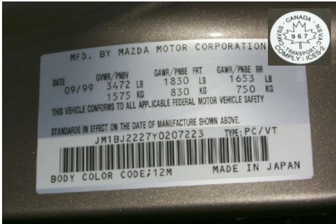
1. Étiquette de déclaration de conformité du véhicule d'essai. Statement of compliance label of the test vehicle.