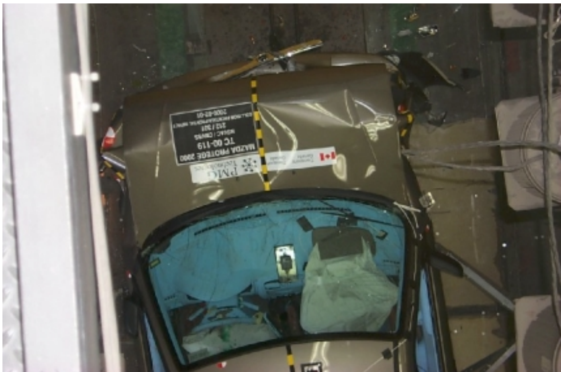
16. Vue de plan du devant du véhicule d'essai, après essai. Overview of the front part of the test vehicle, post-test.