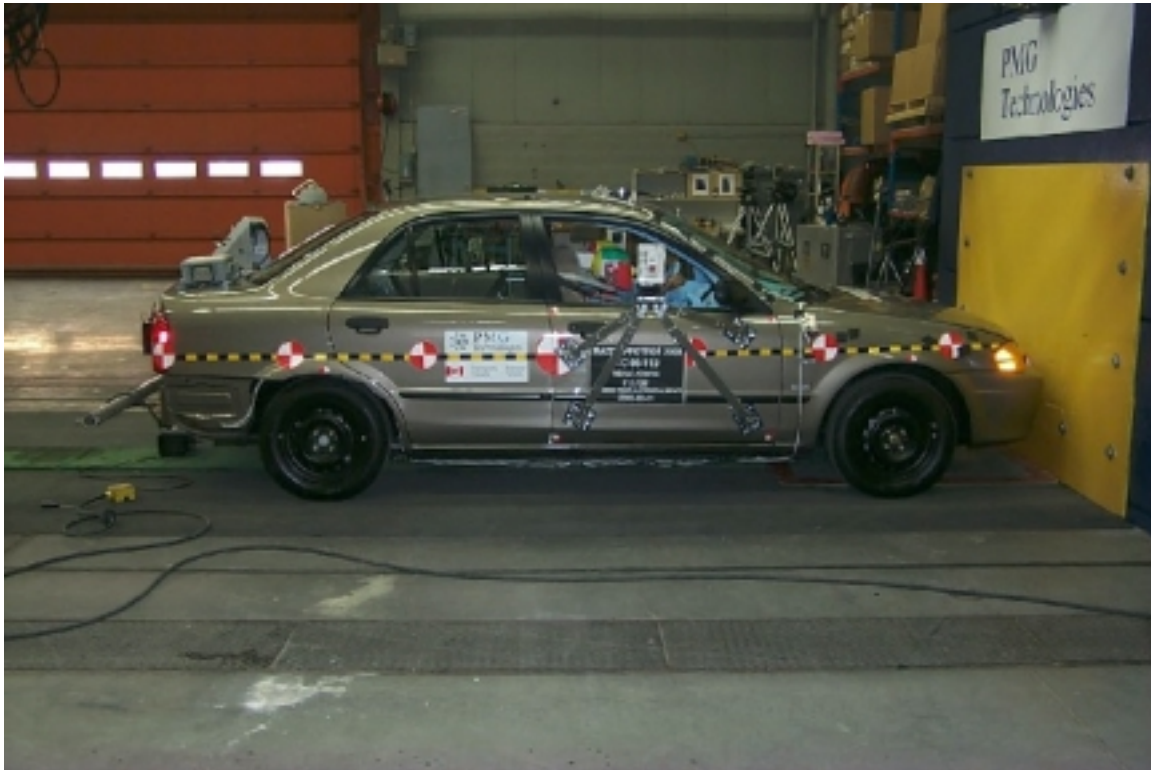
9. Vue générale côté droit du véhicule d'essai, avant essai. General right side view of the test vehicle, pre-test.