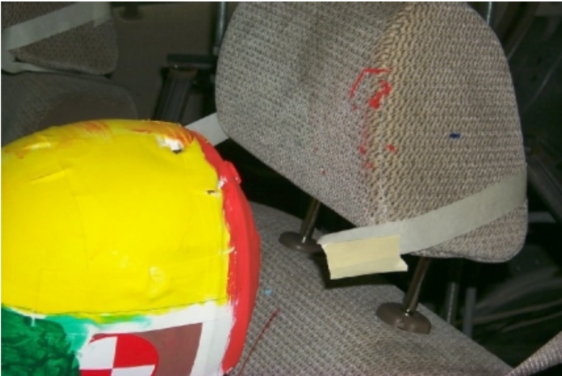
27. Point de contact de tête du conducteur, après essai. Driver's head contact point, post-test.