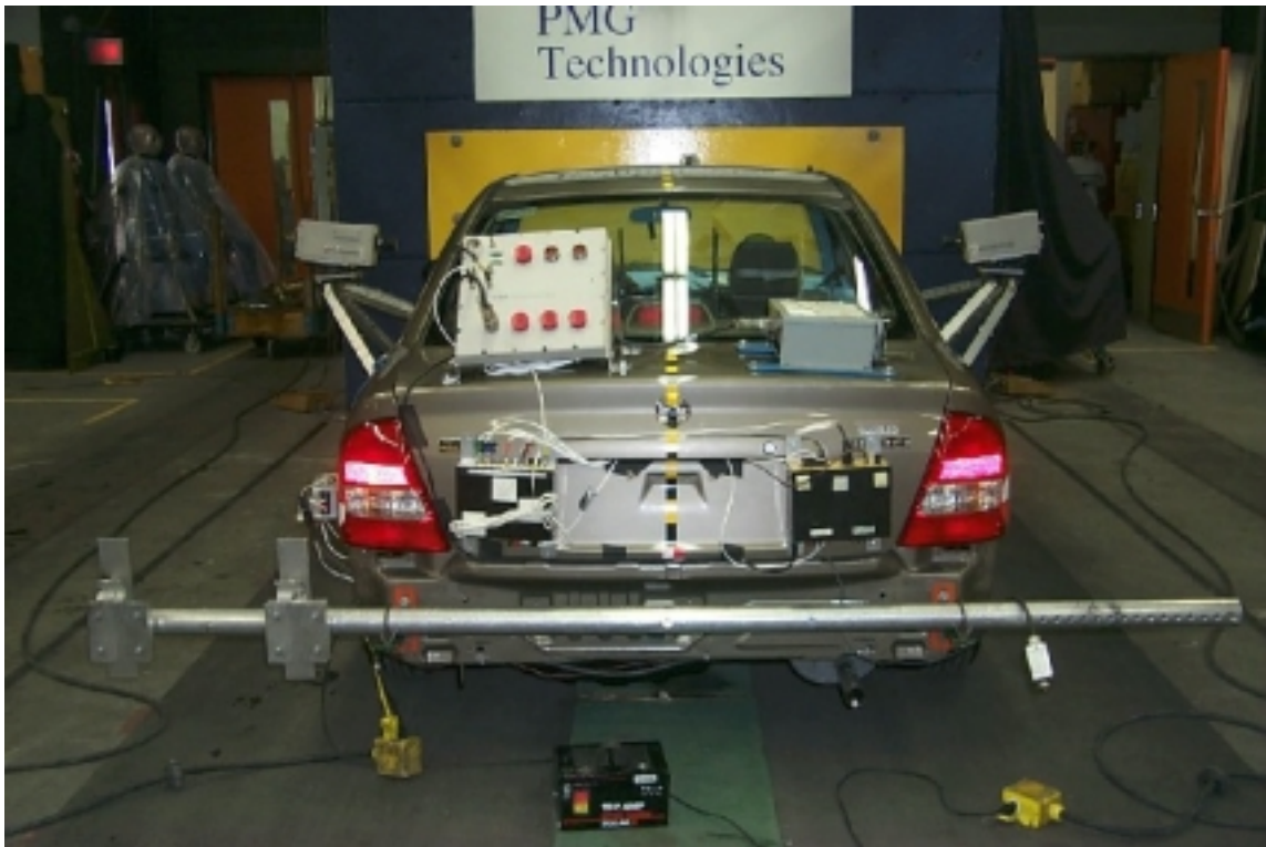
7. Vue arrière du véhicule d'essai, avant essai. Rear view of the test vehicle, pre-test.