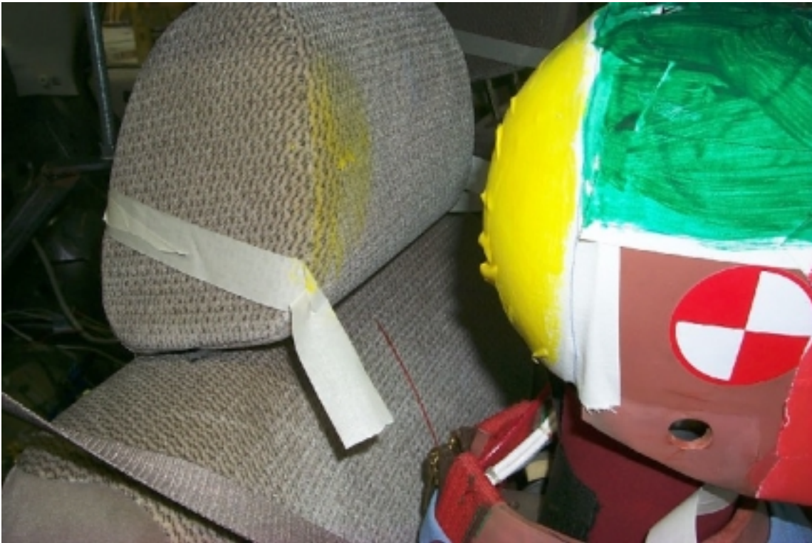
32. Point de contact de tête du passager, après essai. Passenger's head contact point, post-test.