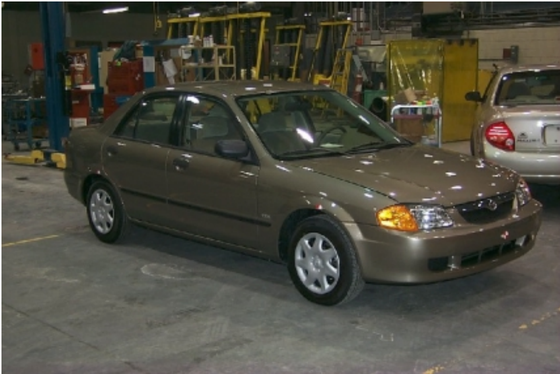
3. Vue \frac{3}{4} avant du véhicule d'essai. \frac{3}{4} front view of the test vehicle.