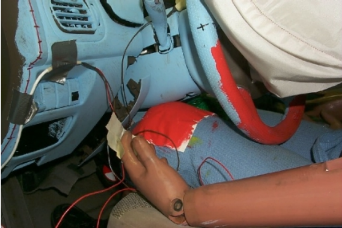
29. Point de contact des genoux du conducteur, après essai. Driver's knee contact points, post-test.