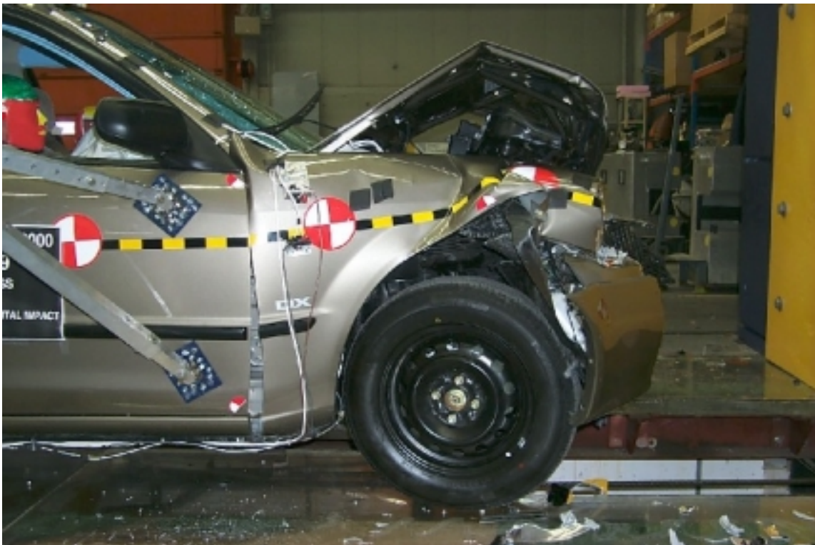
20. Vue côté droit de l'avant du véhicule d'essai, après essai. Right side view of front of test vehicle, post-test.