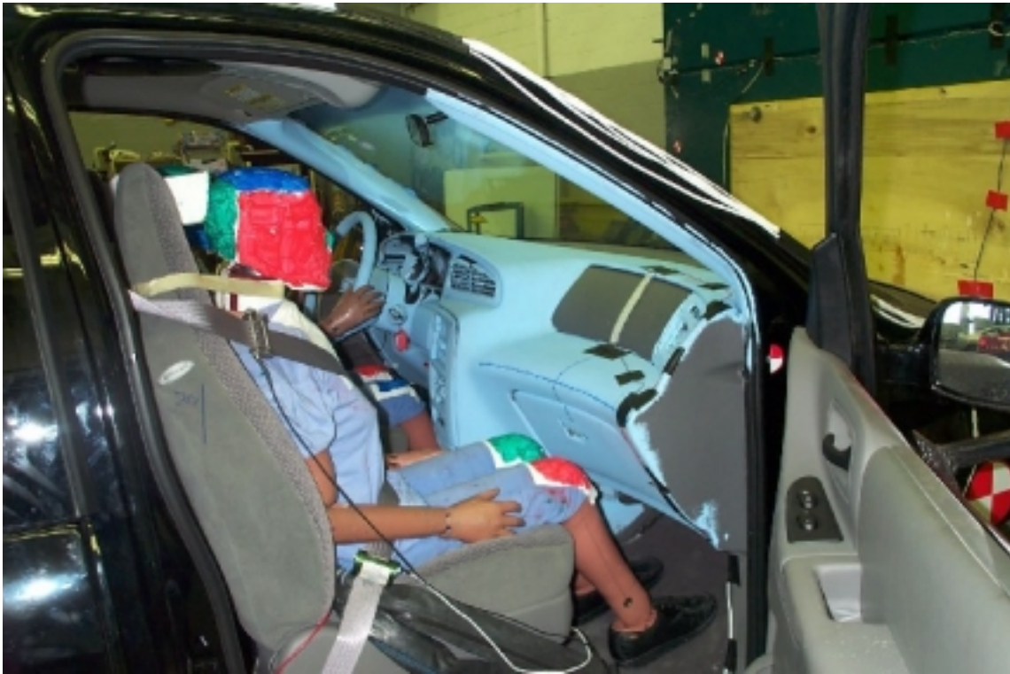
26. Position du passager, avant essai. Passenger's position, pre-test.