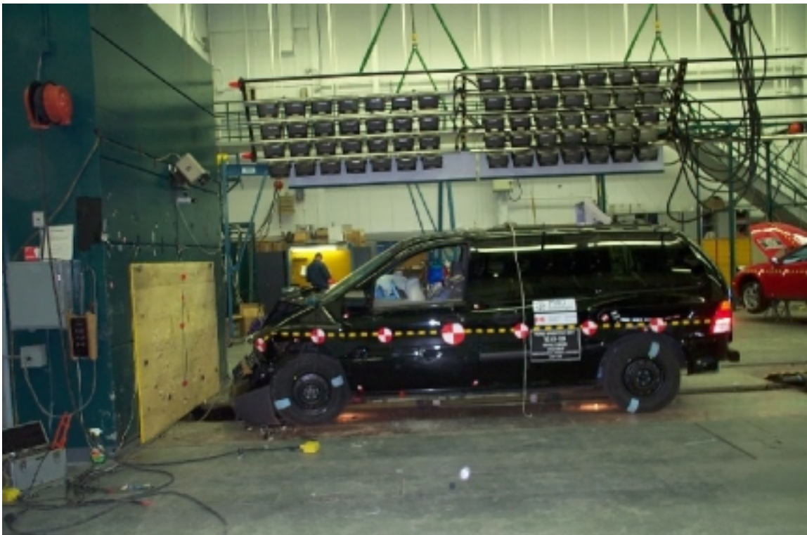
6. Vue générale côté gauche du véhicule d'essai, après essai. Left side view of the test vehicle, post-test.