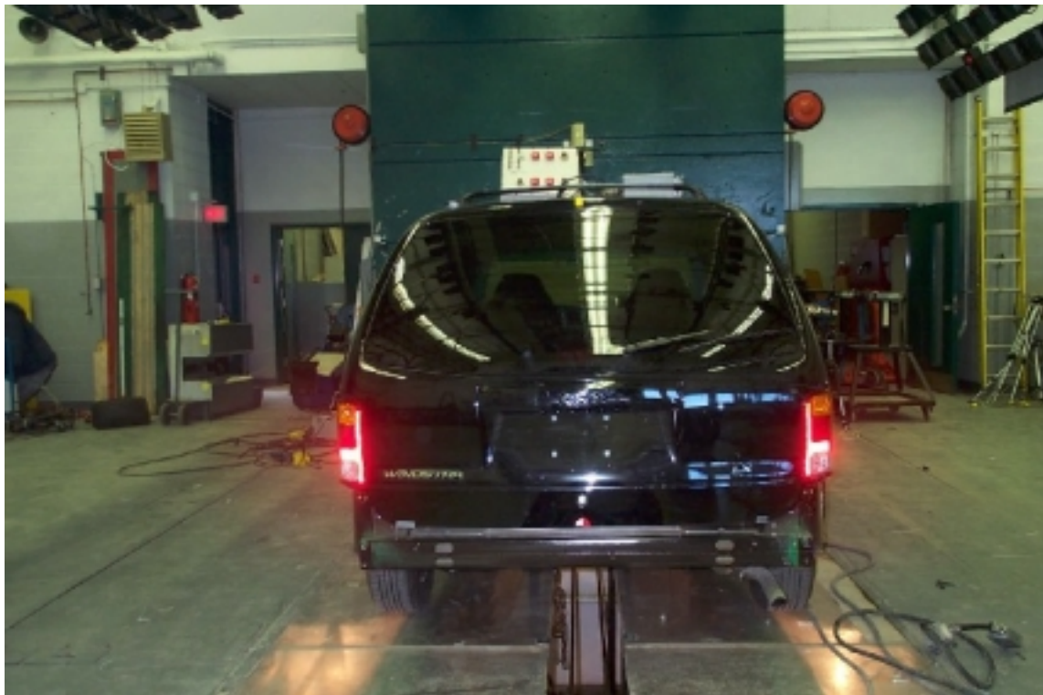
8. Vue arrière du véhicule d'essai, après essai. Rear view of the test vehicle, post-test.