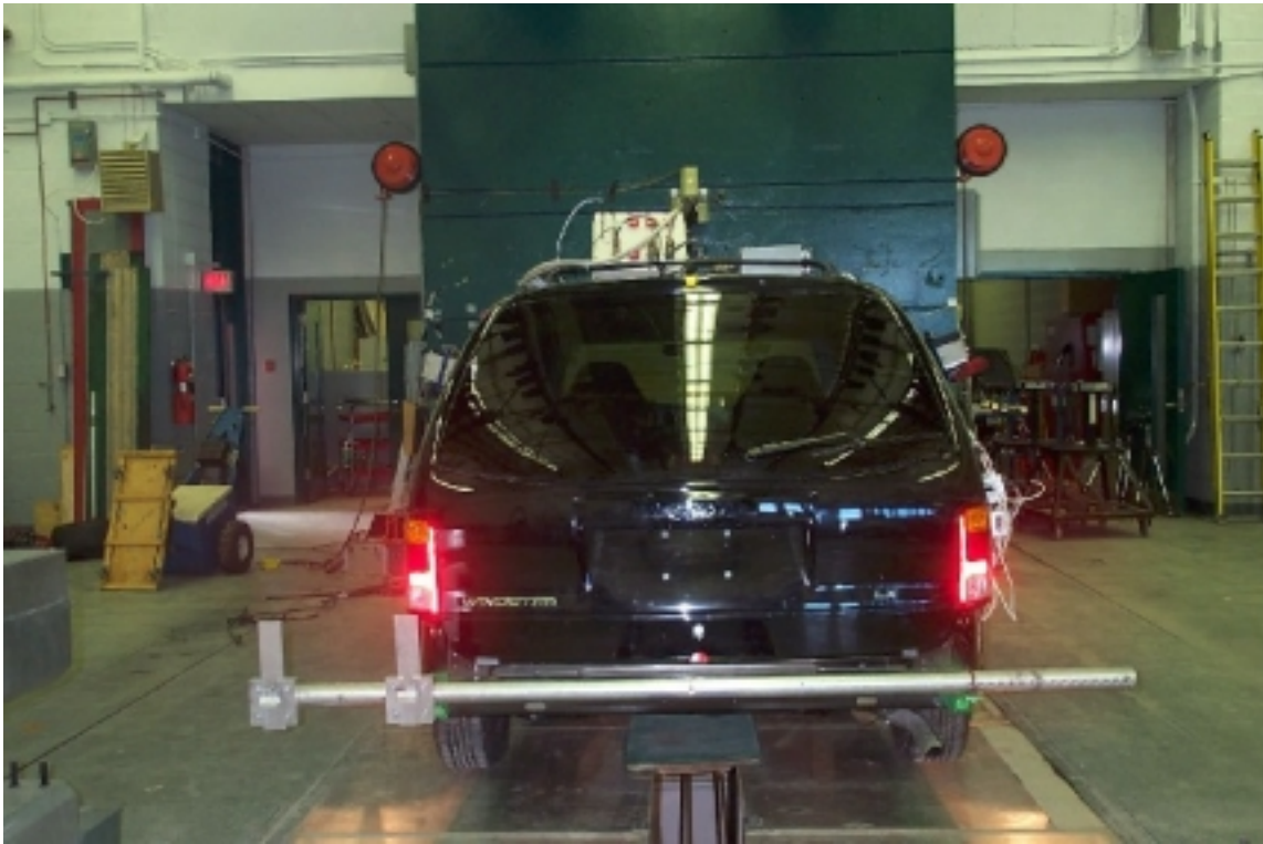
7. Vue arrière du véhicule d'essai, avant essai. Rear view of the test vehicle, pre-test.