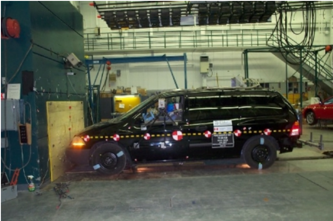
5. Vue générale côté gauche du véhicule d'essai, avant essai. Left side view of the test vehicle, pre-test.