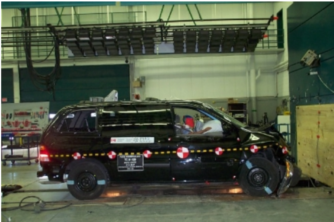
10. Vue générale côté droit du véhicule d'essai, après essai. General right side view of the test vehicle, post-test.