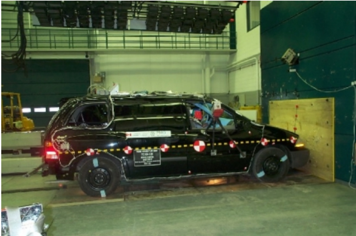
9. Vue générale côté droit du véhicule d'essai, avant essai. General right side view of the test vehicle, pre-test.