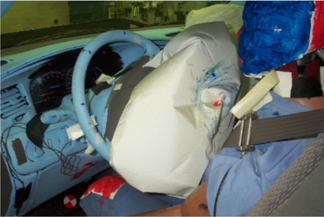
23. Point de contact de tête du conducteur, après essai. Driver's head contact point, post-test.