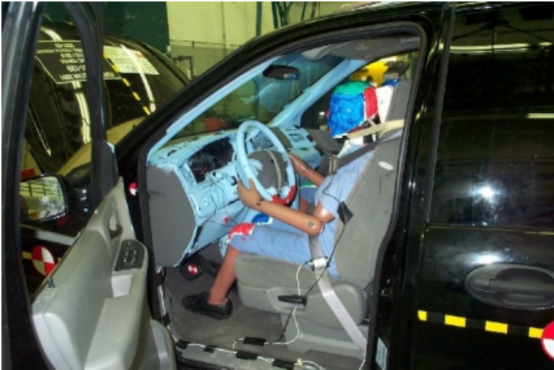
21. Position du conducteur, avant essai. Driver's position, pre-test.