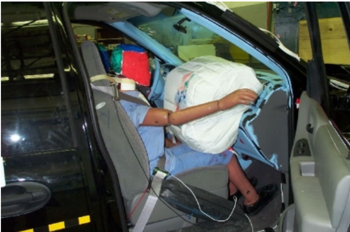
27. Position du passager, après essai. Passenger's position, post-test.