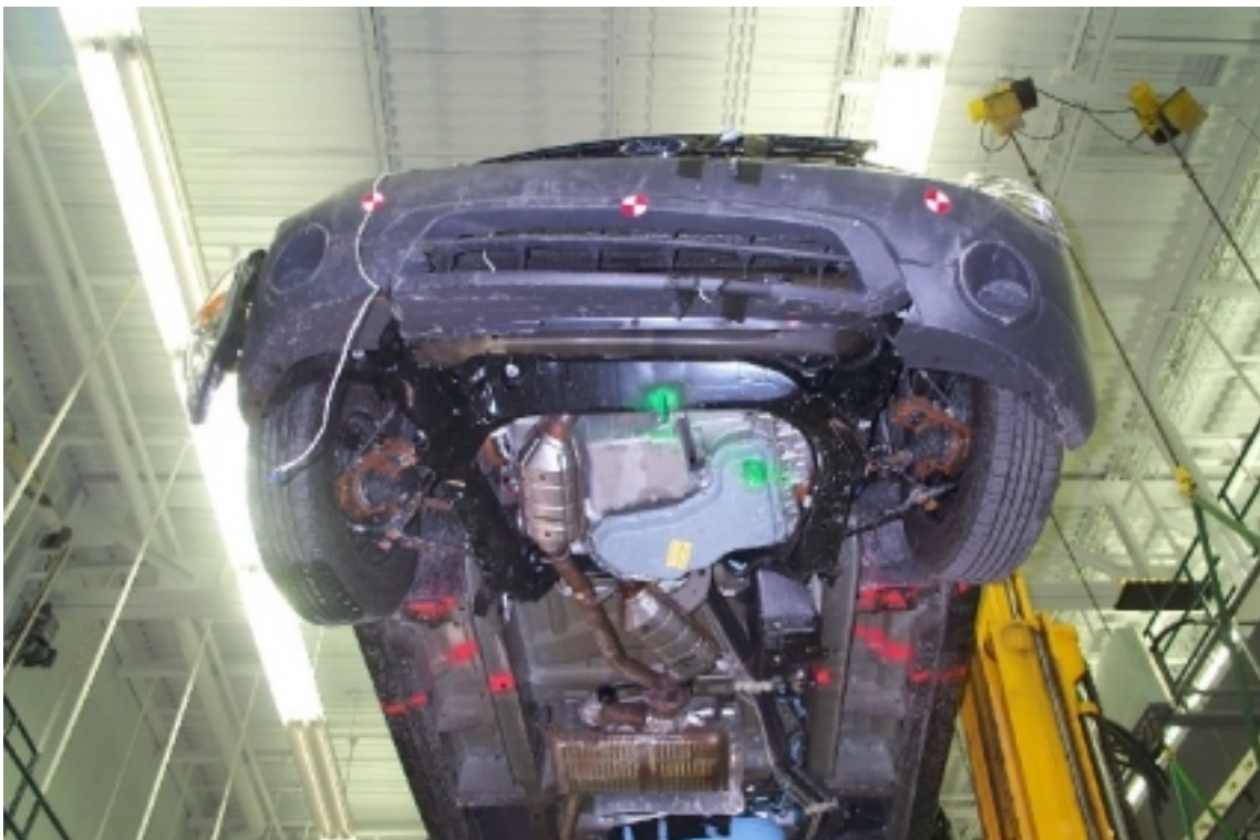
20. Vue du dessous du compartiment moteur, après essai. Under view of the engine compartment, post-test.