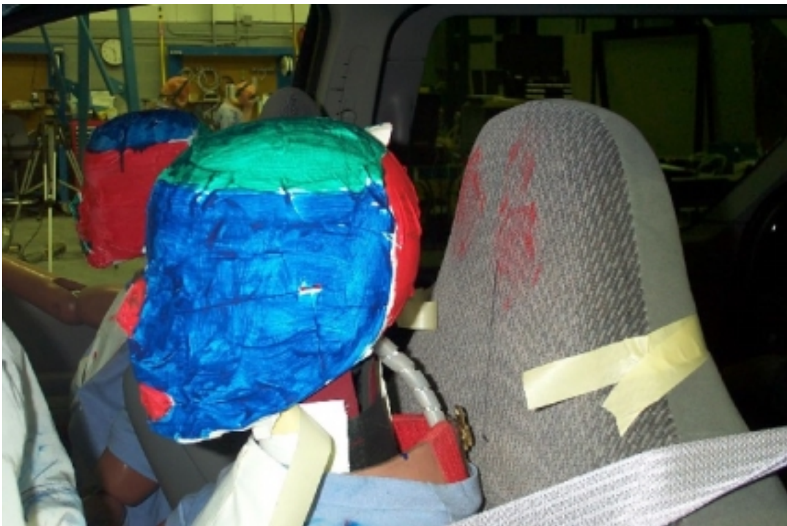
24. Point de contact de tête du conducteur, après essai. Driver's head contact point, post-test.