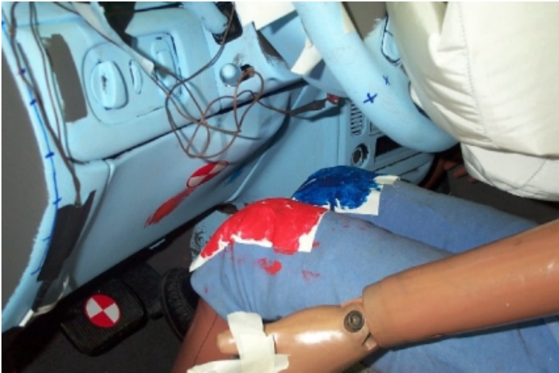
25. Point de contact des genoux du conducteur, après essai. Driver's knee contact points, post-test.