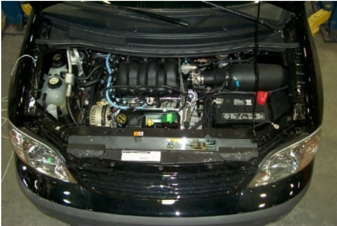
17. Vue du compartiment moteur du véhicule d'essai, avant essai. Engine compartment view of the test vehicle, pre-test.