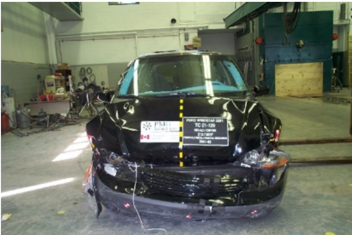
12. Vue avant du véhicule d'essai, après essai. Front view of the test vehicle, post-test.