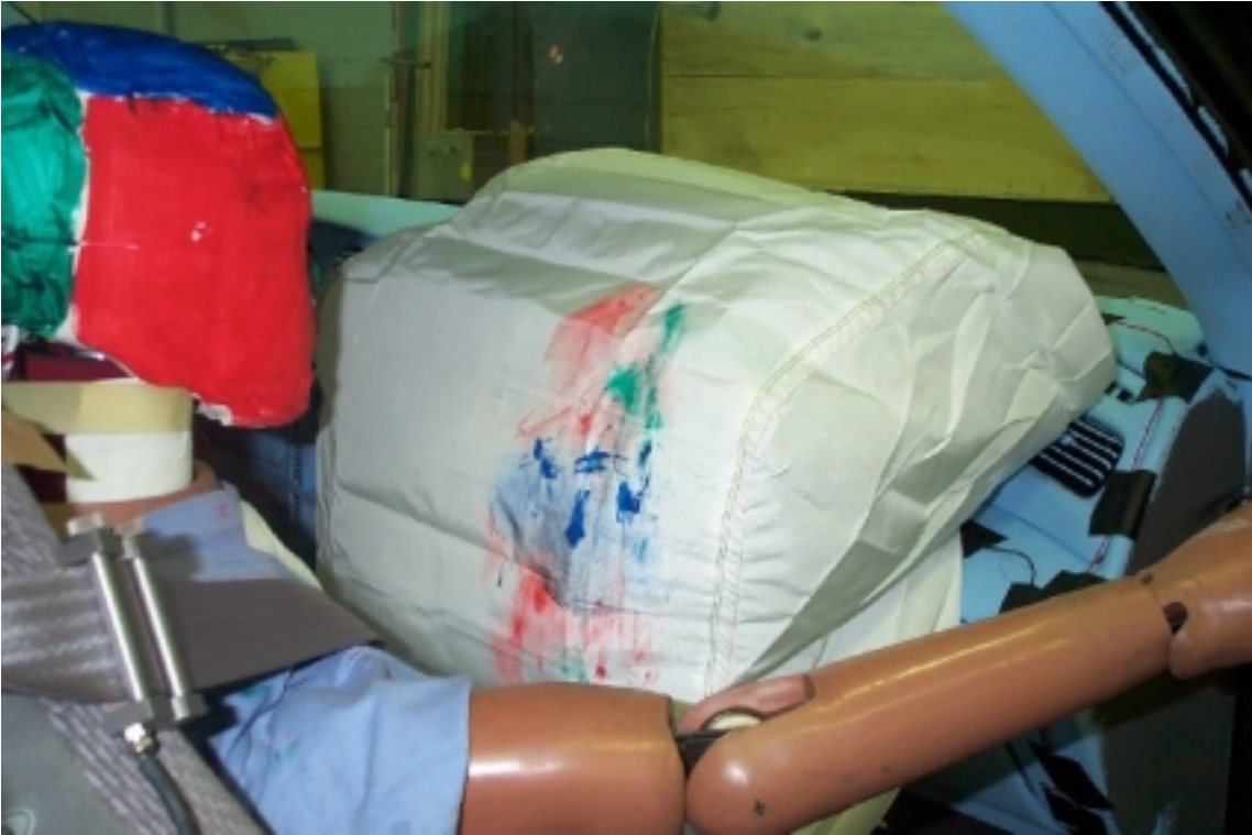
28. Point de contact de tête du passager, après essai. Passenger's head contact point, post-test.