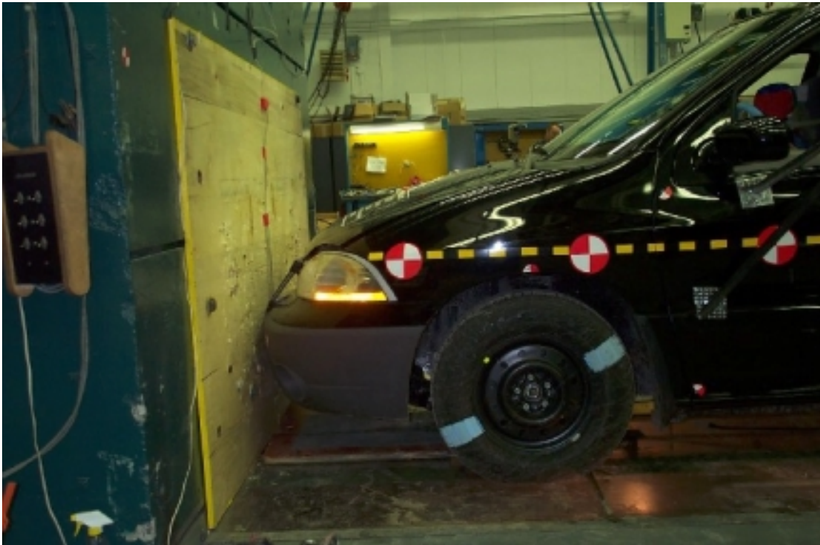
13. Vue côté gauche de l'avant du véhicule d'essai, avant essai. Left side view of front of test vehicle, pre-test.