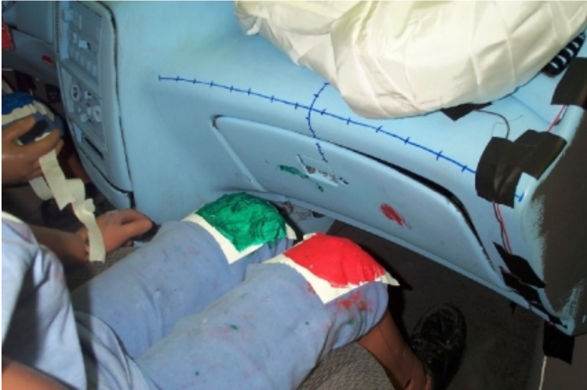
30. Point de contact des genoux du passager, après essai. Passenger's knee contact points, post-test.