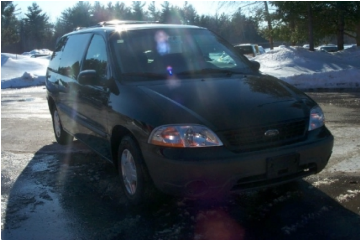
3. Vue \frac{3}{4} avant du véhicule d'essai. \frac{3}{4} front view of the test vehicle.