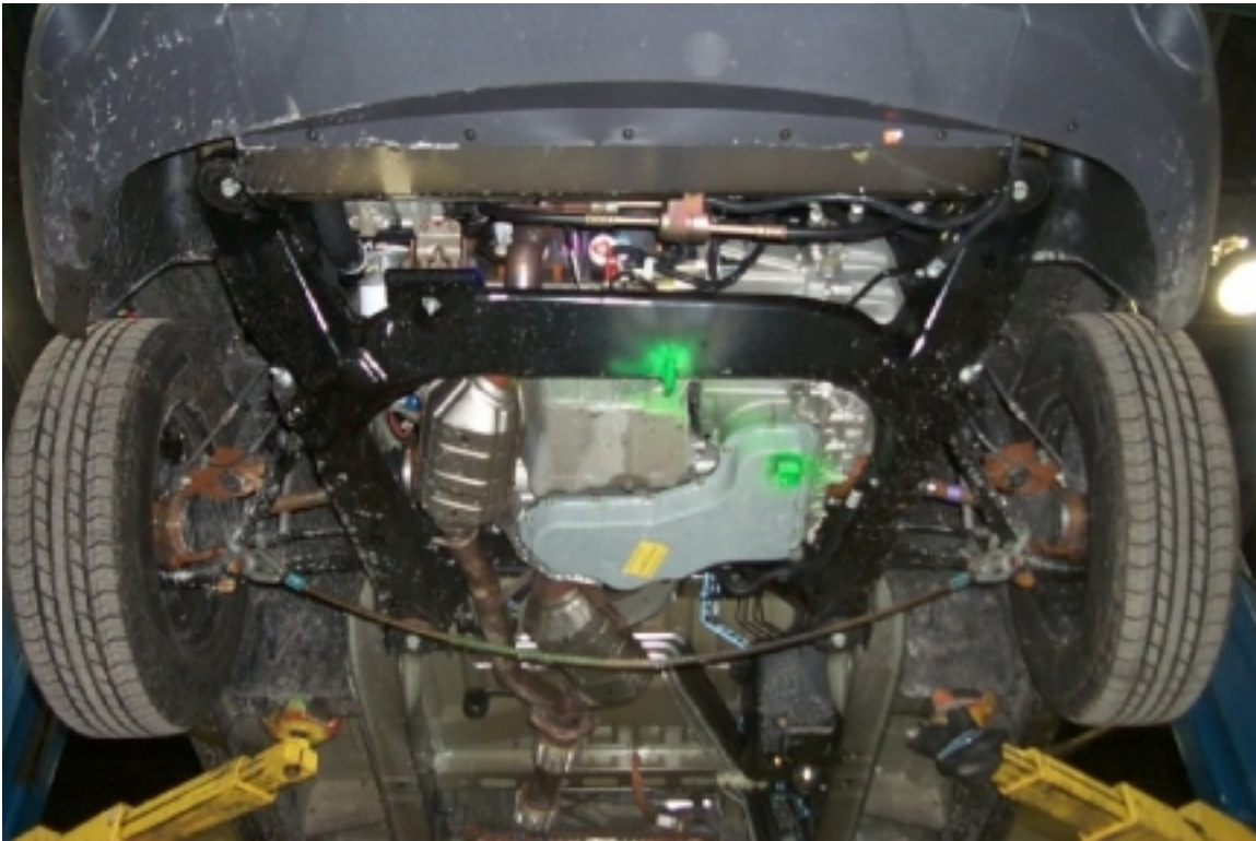
19. Vue du dessous du compartiment moteur, avant essai. Under view of the engine compartment, pre-test.