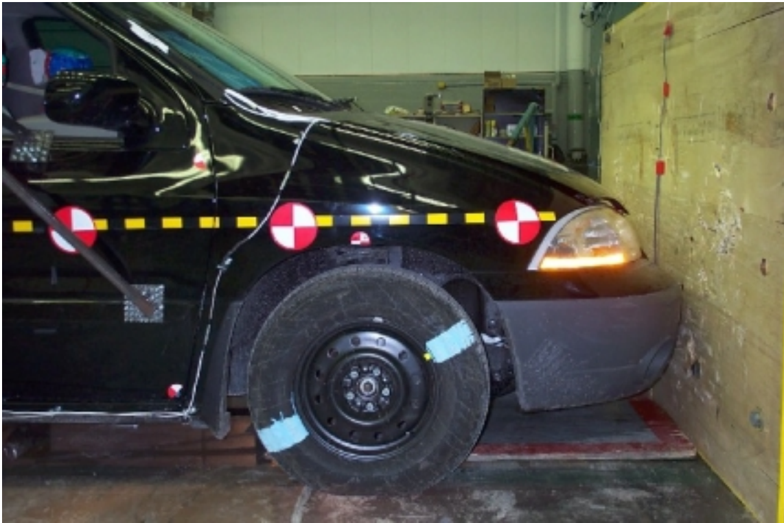
15. Vue côté droit de l'avant du véhicule d'essai, avant essai. Right side view of front of test vehicle, pre-test.