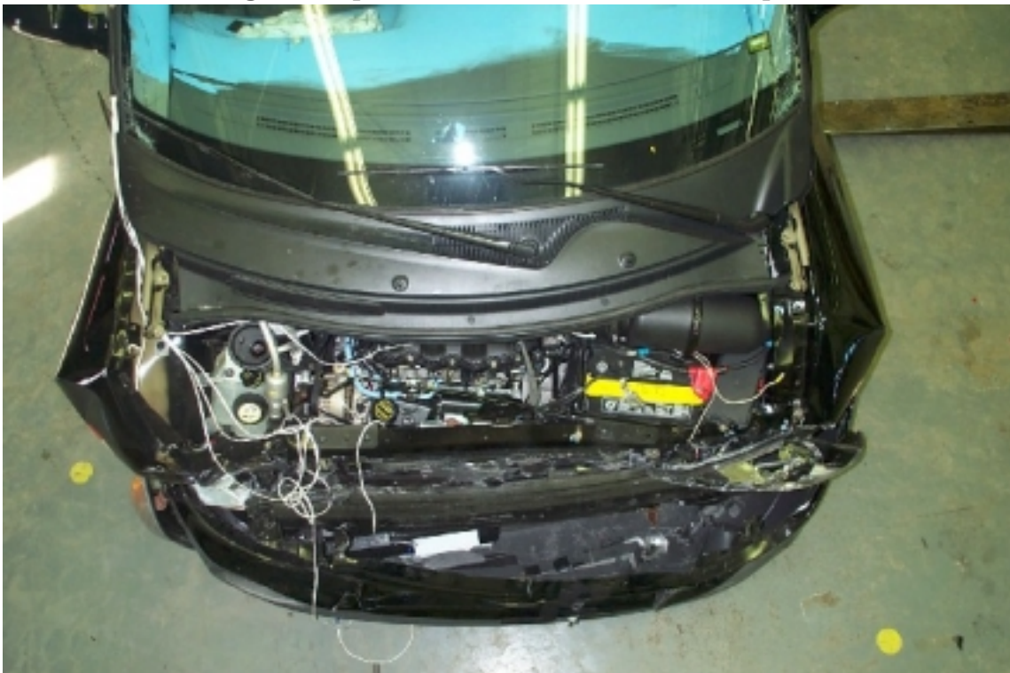
18. Vue du compartiment moteur du véhicule d'essai, après essai. Engine compartment view of the test vehicle, post-test.