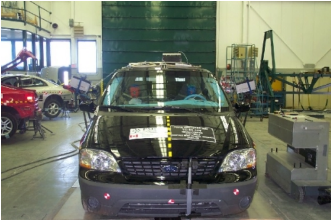
11. Vue avant du véhicule d'essai, avant essai. Front view of the test vehicle, pre-test.