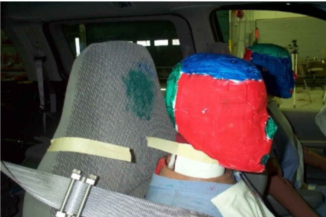
29. Point de contact de tête du passager, après essai. Passenger's head contact point, post-test.