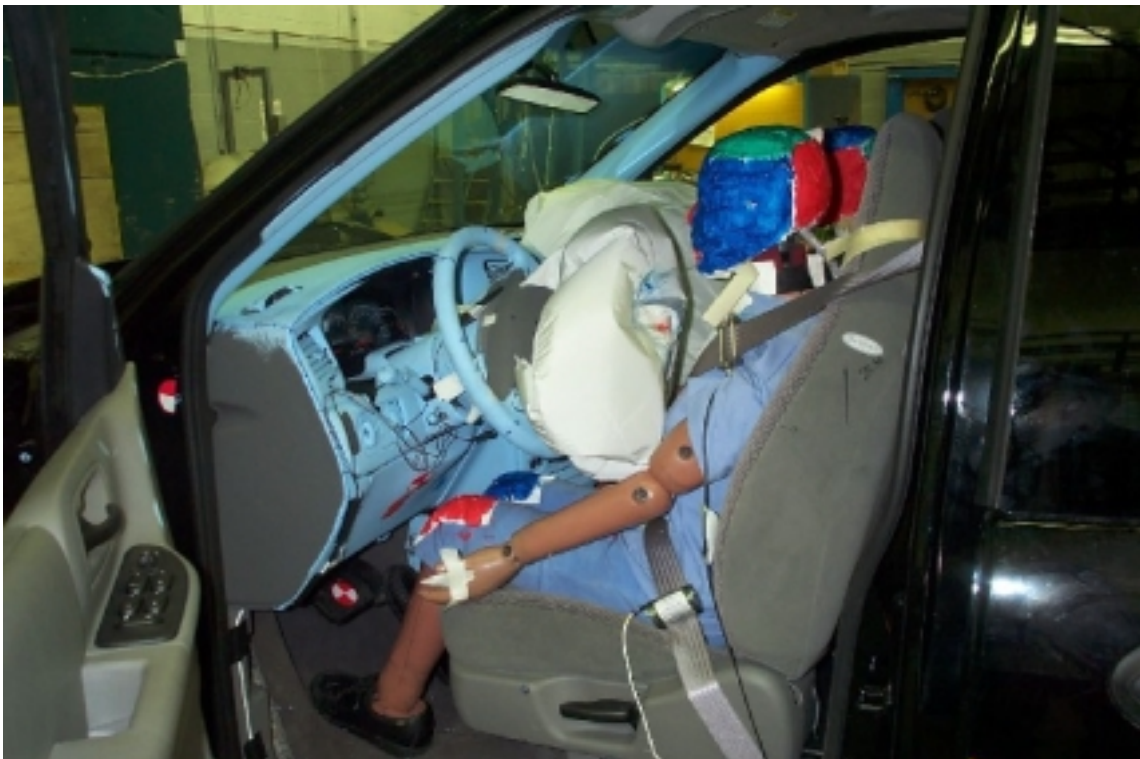
22. Position du conducteur, après essai. Driver's position, post-test.