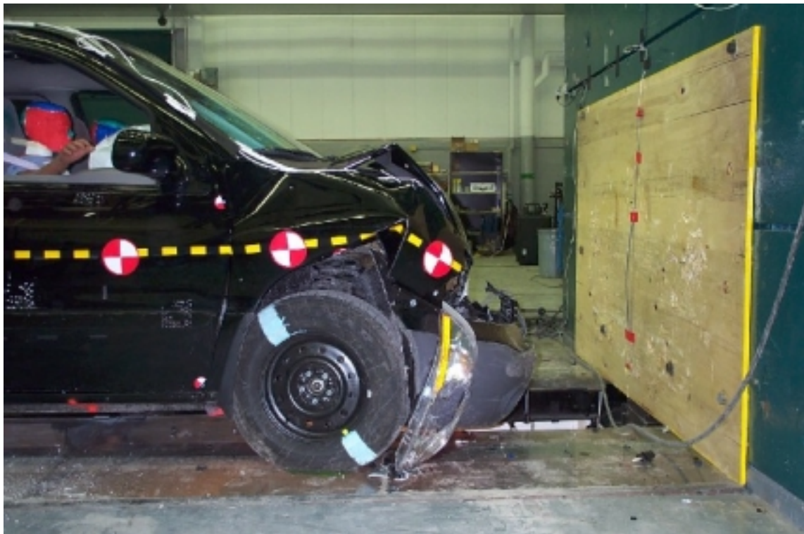
16. Vue côté droit de l'avant du véhicule d'essai, après essai. Right side view of front of test vehicle, post-test.