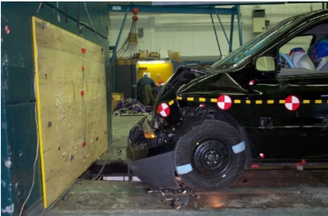
14. Vue côté gauche de l'avant du véhicule d'essai, après essai. Left side view of front of test vehicle, post-test.