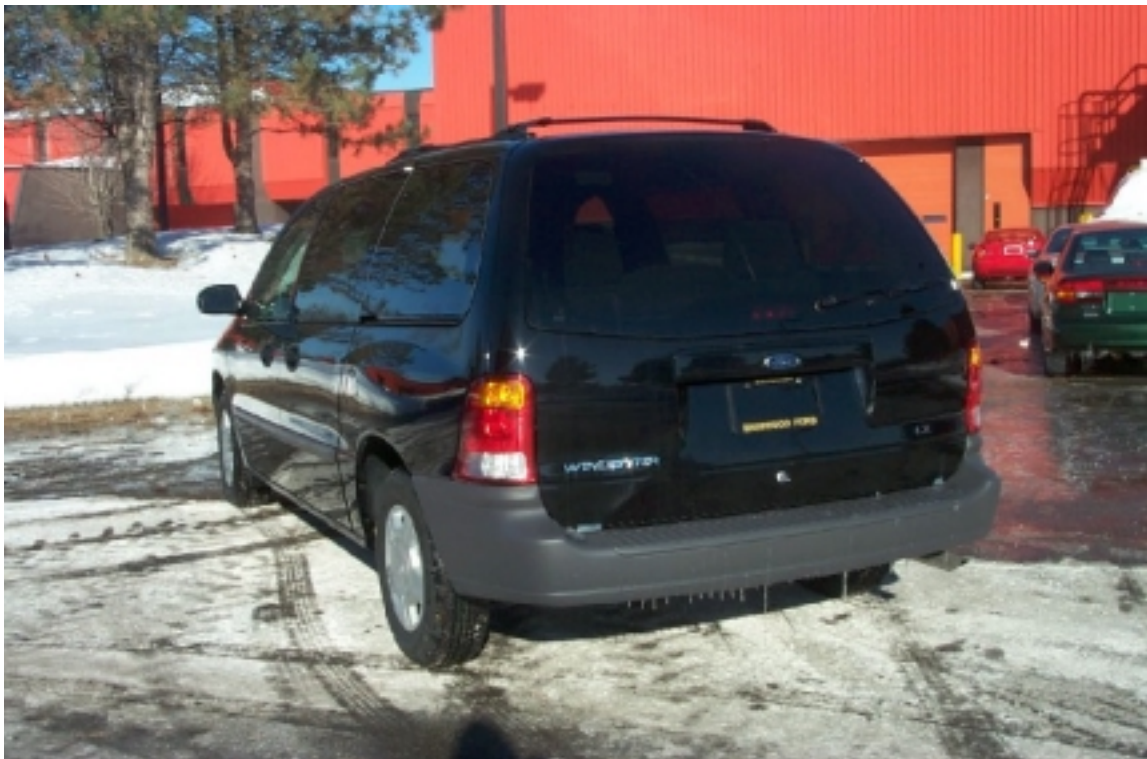
4. Vue \frac{3}{4} arrière du véhicule d'essai. \frac{3}{4} rear view of the test vehicle.