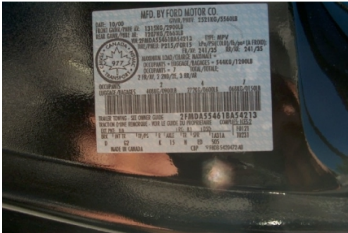
1. Étiquette de déclaration de conformité du véhicule d'essai. Statement of compliance label of the test vehicle.